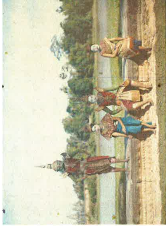
Ekzemplo de fotografo per la ‘ autochrome -tekniko’. La motivo estas de Angkor Wat en la Siem Reap -regiono, Kampuĉea.

Kahn sendis fotografojn dise en la mondon por fotografi kaj filmi homojn, lokojn kaj eventojn ... lia teorio estis, ke se ni pli bone konas unu la alian, ni pli bone komprenas unu la alian – same kiel pensis Zamenhof . Kahn volis kapti la diversajn popolojn kaj iliajn lingvojn, vestaĵojn kaj kutimojn, por ke oni pli bone komprenu kaj akceptu la diversecon de la mondo.