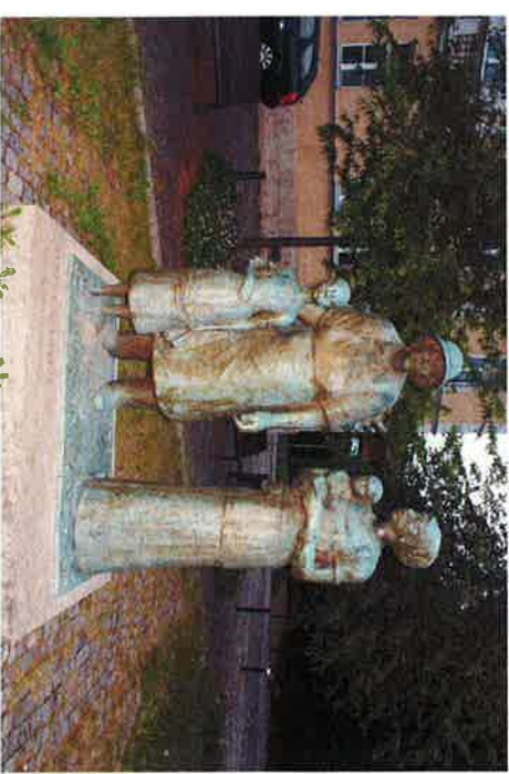
Memorstato en Weimar, Germanio

dum la subtenantaj landoj havas ankaŭ siajn reprezentantojn. La malsanulejo nun servas al ĉ. 50.000 homoj en la regiono, kaj estas 160 dungitoj. Ĉiutage 140 homoj vizitas la ambulatorion, kaj oni faras 2200 operaciojn ĉiutage. Entute oni havas ĉ. 150 litojn por pacientoj.