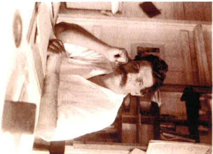
La Juna Albert Schweitzer