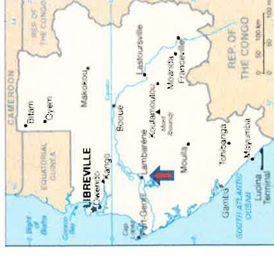
La Afriko de Albert Schweitzer - Afrique-Équatoriale Française , la nuna Gabono La urbo Lambaréné estas markita per sago

La delto de la rivero Ogooué kovras grandan areon de la teritorio de Gabono. La urbo Lambaréné , nun kun 24.000 enloĝantoj, situas mezokcidente en la lando.