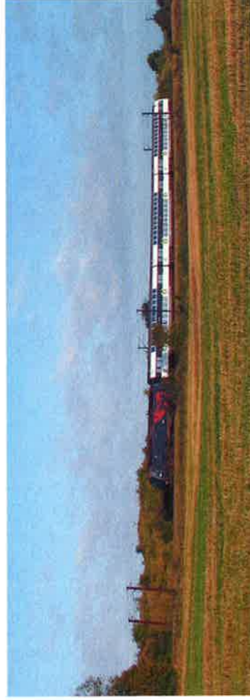
Unu el la lokomotivtipoj, kiuj devas havi novajn filtrojn.