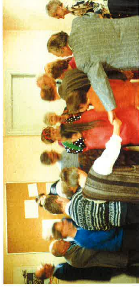
En Grønnegade, Næstved, ni dancis ĉirkaŭ la ABlo ...

Nun, post nelonge, Astrid fariĝos 80-jara, - daŭre ŝi havas koron por Vandailio, kaj daŭre ŝi estas persista, obstina kaj kuraĝa ... daŭre ŝi konvinkas la obstaklojn, kiujn donas al ŝi la vivo, kaj ĉiuj ĉirkaŭ ŝi povas nur admiri ŝin kaj la multajn farojn kaj opukojn, kiujn ŝi majstras.