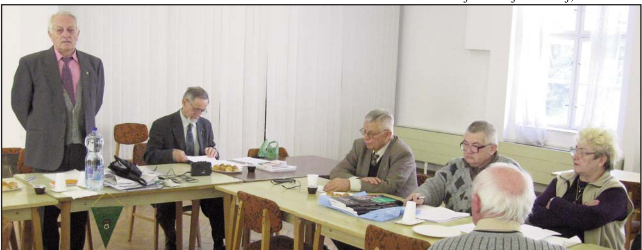
La prezidanto de la asocio raportas

En la jaro 2011 okazis multaj interesaj eventoj kaj ĝojplenaj okazintaĵoj. La plej grava estis la 63-a IFEF-kongreso, okazinta en la pitoreska ĉeĥa urbo Liberec. Partoprenis ĝin entute 173 kongresanoj el 18 landoj, inter ili 15 personoj el Hungario. La kongreson eminente organizis la ĉeĥaj fervojistaj esperantistoj. La komitato de IFEF traktis multajn tagordpunktojn, akceptis la raportojn de la estraranoj, la ĉefkomitatano kaj la gvidantoj de la Faka Komisiono. La komitato laŭ la kongrespropono elektis novan redaktoron, kiel la kvinan estraranon. La komitatoj detale traktis la situacion de kelkaj landaj asocioj, taksis la