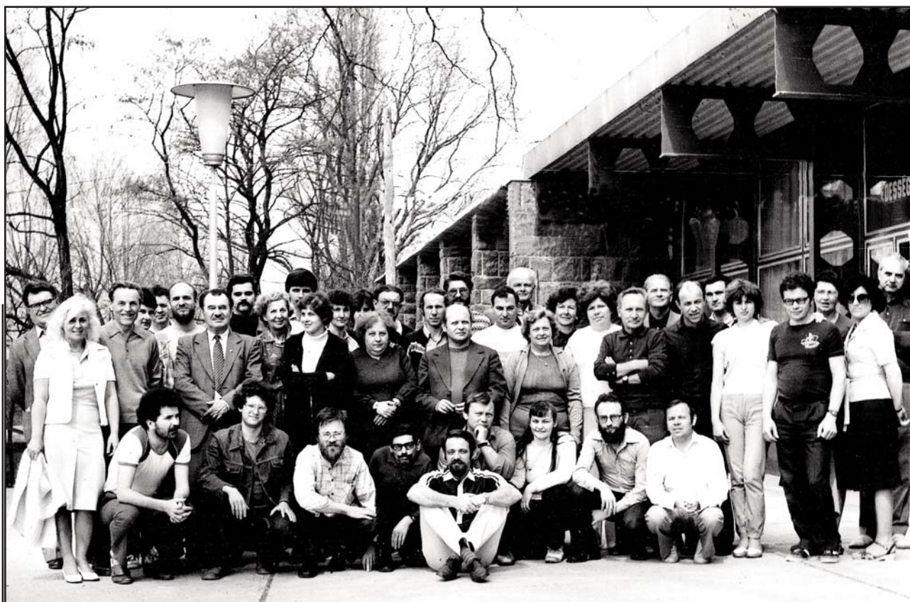
Partoprenantoj de la Esperanto-perfektiga kurso apud la Balatono en 1983