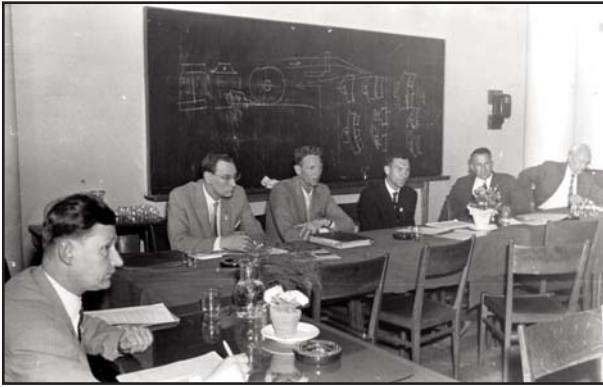
Partoprenantoj de la kunsido de la Faka Komisiono