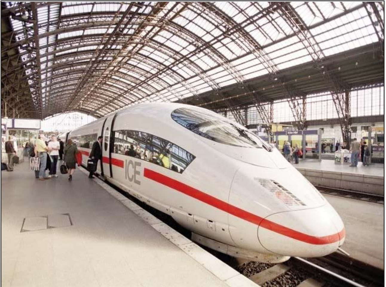
ICE trajno en Germanio