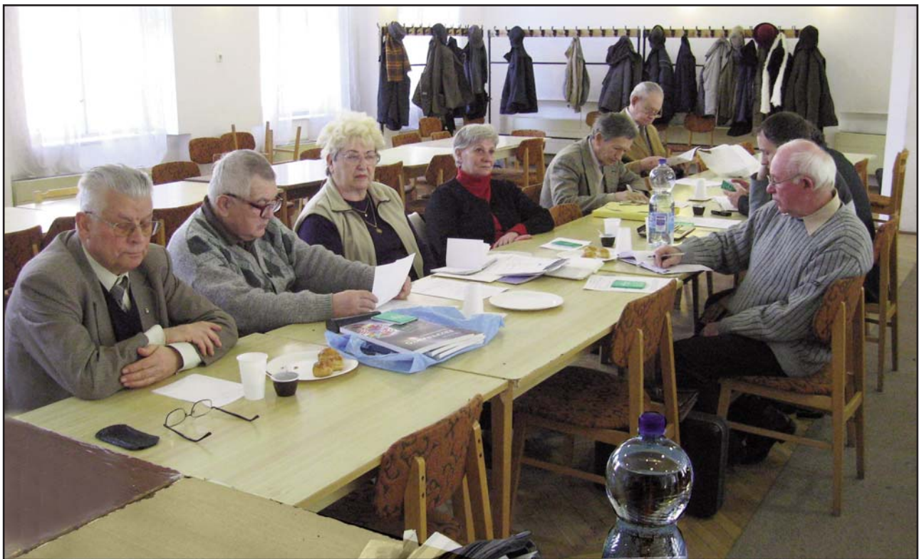
Partoprenantoj en la ĝenerala kunsido