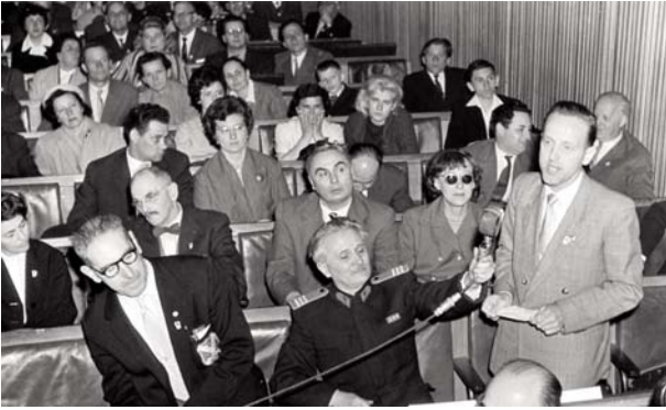
Konataj vizaĝoj en la 14-a IFEF-kongreso.

laŭnome adresitaj leteroj dankis la sinoferan laboron de la helpantoj.