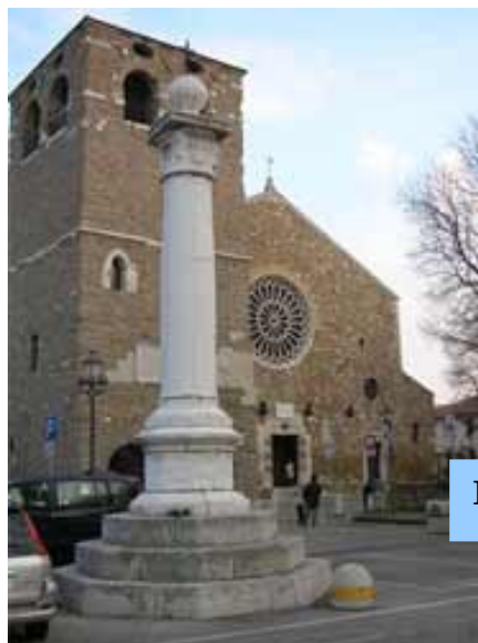
Katedralo Sankta Justo