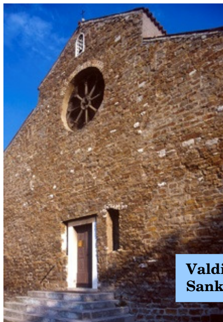
Valdisma Preĝejo Sankta Silvestro