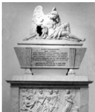
Funebra monumento al Winkelmann - Muzeo pri Historio kaj Arto -

Muzeo Revoltella : historia vilao el la 18 a jarcento, aparteninta al Barono Pasquale Revoltella , en kiu troviĝas verkoj de la plej gravaj italaj artistoj.