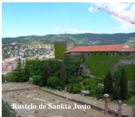
Kastelo de Sankta Justo

Kastelo de Duino : sepcentjara reĝejo, dronanta en parko densa je rozoj kaj begonioj, ankoraŭ nuntempe loĝata de la Princoj von