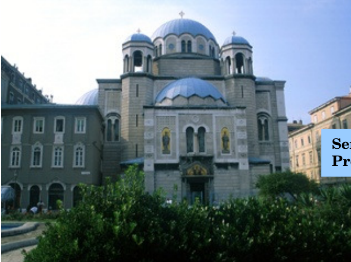
Serbo-ortodoksa Preĝejo Sankta Spiridiono