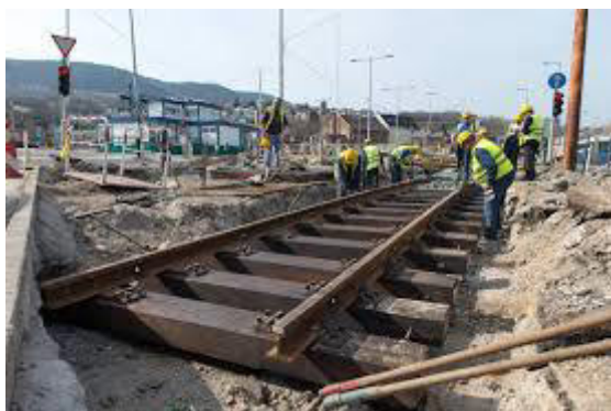
La fervojaj laboristoj rekonstruas la relojn

La rekonstruita pasaĝerhalo de stacidomo Vác ekfunkciis, kie la tage/nokte funkciantaj ĝiĉetoj servadas ĉ. sep-mil pasaĝerojn po tage. La stacio estas artobjekto. Cetere la plena rekonstru-laboro ankoraŭ daŭras, sed la rekonstruita halo estas je la dispono de la pasaĝeroj. Dum kulmina tempo oni povas aĉeti vojaĝbiletojn ĉe tri gicetoj, eĉ ĉe ĉiuj kasoj eblas pagi per bankokarto. La ĝiĉetoj