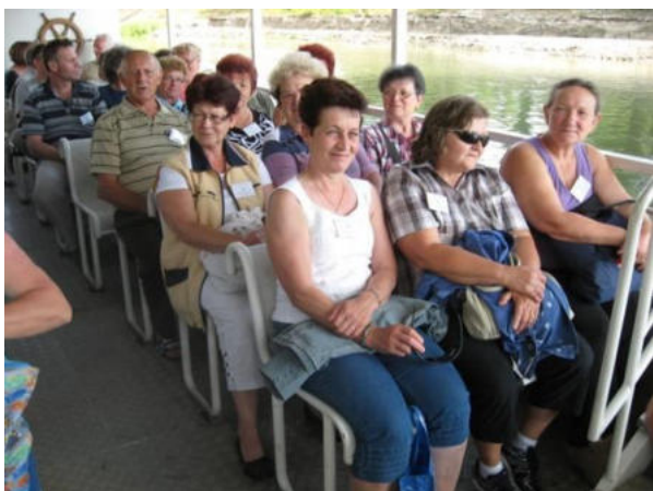
Partoprenantoj de la ŝipveturado

Dimanĉe matene okazis sankta meso, kaj poste orgenkonzerto en la katolika preĝejo. Bedaŭrinde por la „laborkunsido” restis nur unu horo, en kiu partoprenis nur dek personoj. La prezidanto de la Hungara Fervojista Esperanto-Asocio mallonge parolis pri la 66-a IFEF-kongreso, okazinta en majo en la itala urbo San Benedetto del Tronto. La plej gravaj temoj estis la du kongresproponoj por modifi la minimuman membronombro de la landaj asocioj, kaj