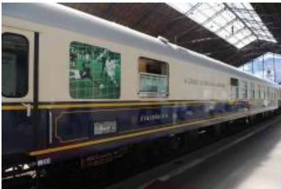
La "Császár" restoracivagono

En la Okcidenta Stacidomo antaŭ la reĝa atendejo oni solene proklamis la „Császár restoracivagonon” je la nomo „Albert Flórián”, okaze de la ĉi-jara Fervojista Festo. La portreto de la mondfama futbalisto Flórián Albert ornamas la eksteran surfacon de la vagono. La internaĵo de la vagono estas stilo „verda-blanka” kolora. En la vagono oni aranĝis specialan ekspozicion sub la titolo „Moviĝanta Albert-ekspozicio”, kiu per bildoj prezentas la karieron de la eminenta sportisto; la plej valoraj ekspoziciaj relikvoj estas la „Orpilko”, la „Arĝentaj ŝuoj” kaj la „Pokalo de Foirurboj”.