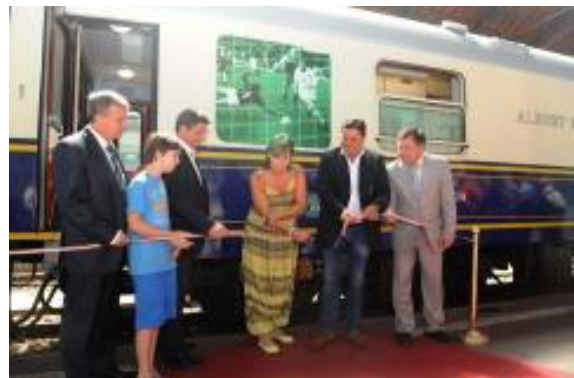
La solena rubando-tratranĉado

en la vagonaroj „Gyertyafény Expressz” (Kandellumo Eksprestrajno), „Élményvonat” (Travivaĵ-trajno) kaj „Jewels of Persia” (Trezojoj de Persio) luksaj trajnoj. Post la solenaĵo la „memortrajno” veturis al Veresegyház; inter la invititaj pasaĝeroj troviĝis la Hungara a Elita Taĉmento de Ĵurnalistoj, kaj Elita Taĉmento de Aktoroj kaj futbalistoj de Ferencváros. En Veresegyház la du Taĉmentoj pilkoludis kun la lokaj futbalistoj. La tuttaga programo reduktiĝis sur la sporto kaj rezervis dignan primemoron al la „Cezaro”, flegante la noblajn