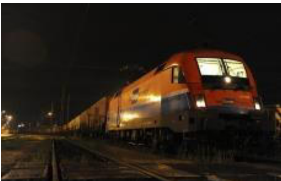
Unu el la kontenertrajnoj

La investado de la itinero Budapest-Beograd kontribuus akiri tiun celon, ke Hungario estu la ĉefa tranzitlando por transporti la orientajn varojn al Okcident-Eŭropo. Serbio jam