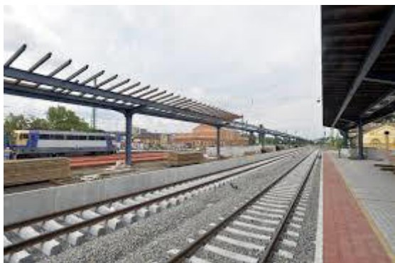
Konstruataj peronoj kaj trakoj

La rekonstruita pasaĝerhalo de stacidomo Vác ekfunkciis, kie la tage/nokte funkciantaj ĝiĉetoj servadas ĉ. sep-mil pasaĝerojn po tage. La stacio estas artobjekto. Cetere la plena rekonstru-laboro ankoraŭ daŭras, sed la rekonstruita halo estas je la dispono de la pasaĝeroj. Dum kulmina tempo oni povas aĉeti vojaĝbiletojn ĉe tri gicetoj, eĉ ĉe ĉiuj kasoj eblas pagi per bankokarto. La ĝiĉetoj