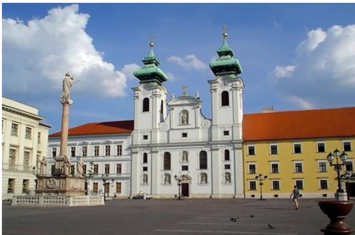
: La placo Széchenyi en la urbo Győr