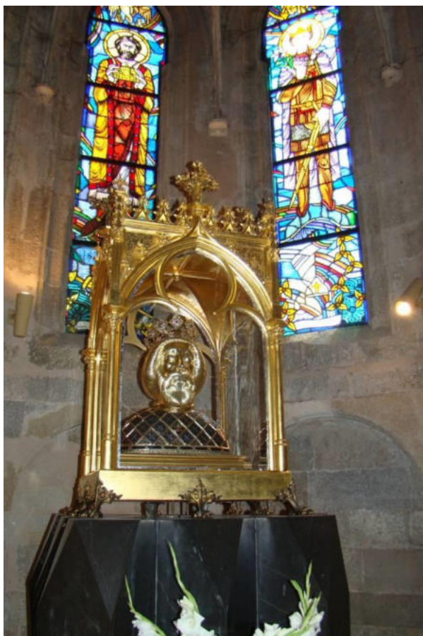
La fama kaprelikvujo de Sankta Ladislao

placo rekondukas nin en la etoson de antaŭjarcentaj tempoj.