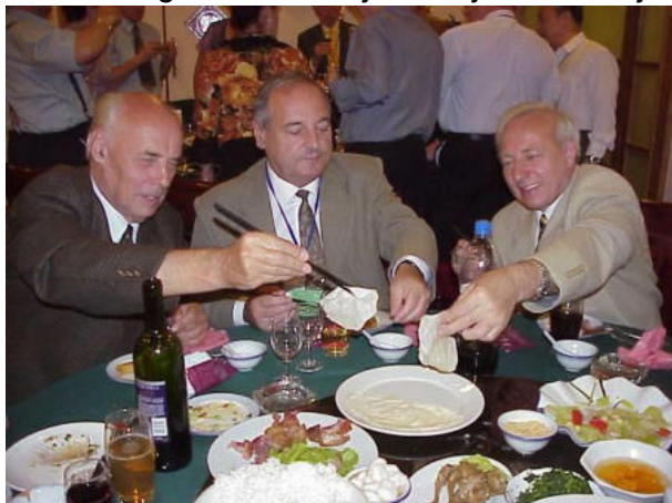
Tagmanĝo dum la 58-a IFK en Ĉinio

kaj ni devas serĉi koalicianojn. Niaj naturaj koalicianoj povas esti la defendantoj de la gepatra lingvo. En ĉi tiu batalo, inter la lingvoj la atakoj kontraŭ Esperanto estas antaŭsignoj. Se ĉi tiu procezo daŭros, la atakoj atingos ankaŭ nian gepatran lingvon. En la mondo troviĝas ekzemplo ankaŭ pri tio. En Svedio la supergrada teknika instruado okazas angle. La svedaj fakuloj la teknikajn