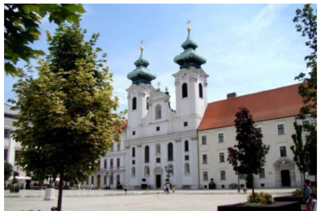
La placo Széchenyi kun la Benediktana preĝejo

La fiŝo-, nutro- kaj rifuĝdonaj riveroj kaj interakvaj altaĵoj allogis por loĝiĝo jam en la antikveco. Daŭraj setlejoj establiĝis unuafoje en la bronzepoko. Ĉirkaŭ en 500 a.K. konstruis ĉi tie loĝlokon iliroj, kaj 300 jarojn poste keltoj, kiuj donis la nomon Arrabona (loĝloko ĉe Rába) al sia sidejo ĉe la rivero Arrabo (Rába). La nomon konservis ankaŭ la romianoj, konstruitaj sian fortikaĵon kaj sub ĝi sian civilan urbon sur la monteto Káptalan. Post hunoj, gotoj, longobardoj, avaroj loĝis daŭre kaj refortikigis defendajn instalaĵojn de la romianoj. Kontraŭ ilia fortikaĵo persone gvidis sian armeon la franka imperiestro Karolo la Granda. La unua hungara reĝo Stefano la Sankta ekkonis la strategian signifon de la loko, kaj ĉi tie fondis multajn regionajn administraciajn centrojn kaj episkopejojn. Stefano la 5-a venkis en 1271 ĉe Győr la ĉeĥan reĝon Otokaro, kaj danke pro la subteno fare de la urbanoj li donis al Győr la privilegion de libera urbo. En 1529 la urbo estis bruligita, por ne esti okupita de