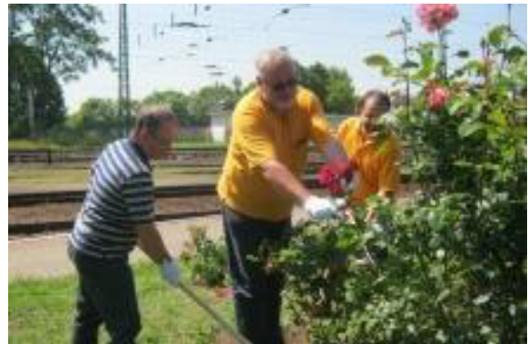
La ĝardenistoj de MÁV beligas la stacidomon

Ekde du jaroj ekiris akcio-serio de propravolaj MÁV-dungitoj sub la moto: „Pure por la fervojo”. En la kadro de tiu ĉirkaŭ kvincent dungitoj de la fevojkompanio faris memvolan purigon sur pliaj 71 frekventitaj stacioj. La du semajnojn daŭriĝinta akcio en la regionoj de Balatono, lago Velence, departementaj sidejoj kaj grandaj urboj, ekskurslokoj beligis la fervojajn staciojn per forigo de la malpuraĵoj, sarkis la florbedojn, pentris kaj riparis la difektajn benkojn, staciajn meblojn, faris la bezonatajn bontenadajn laborojn..