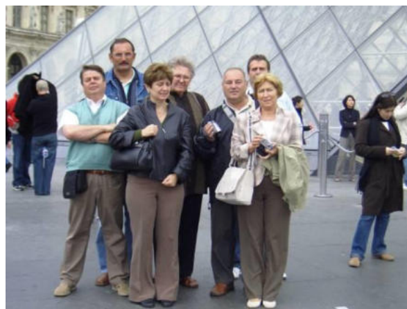
Miskolca grupo en la 59-a IFK en Parizo