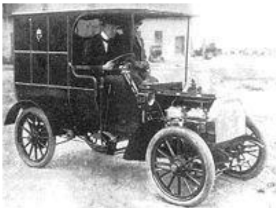
La unua aŭtomobilo de János Csonka

studvojaĝoj li dungiĝis en la Teknika Universitato de Budapeŝt kaj laboris kiel metieja estro ĝis emeritiĝo (1925). Li estis la inventisto de la karburatoro; kaj la ekirigo de la hungara motor- kaj maŝinfabrado. En la forĝista metiejo de lia patro li fariĝis faklaboristo. Plurloke li laboris: en la ĉefriparejo Fervojkompanio Alföld-Fiume de Szeged (1870-1873), MÁV Lokomotivejo de Budapeŝt (1873-1874), poste en Vieno, Zuriko, Parizo kaj Londono. Daŭre li pluper-fektigis sin, kaj akiris la estran postenon de la instrua metiejo de „József Teknika Universitato” (1877-1925). Dume li aŭskultis la universitataj lekcionojn.