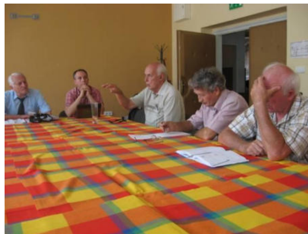
Alia parto de la partoprenantoj de la kunsido

Vespere okazis festa vespermanĝo, kaj poste balo kun muziko kaj tombolo. La muziko estis