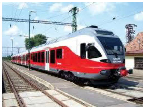
Trajno en la stacio Vác

ro 70. Depost la horarŝanĝo sur la linio n-ro 71 ĉ. 50, kaj sur la linio 75 ĉ. 35 trajnoj tuŝas la stacion de Vác. Laŭtempa taktio iras la investado de la Internacia