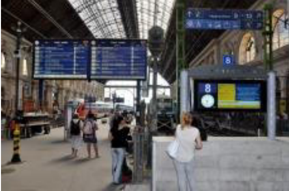
La TFT-monitoroj en la stacio Keleti

En la stacio Budapest-Keleti funkcias modernaj TFT-monitoroj (TTS: Text To Speech – teksto por parolo) por informi la pasaĝerojn anstataŭ la malnov-sistemaj tabuloj – eĉ virinsonaj laŭtaj informoj anstataŭ la pli fruaj virsonoj.