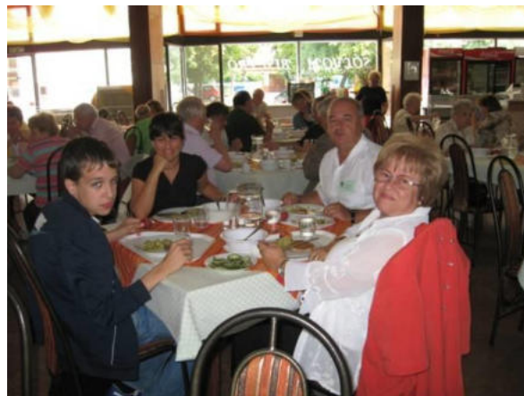
Dum la Landa Amika Renkontiĝo kun la familianoj en Hódmezővásárhely en 2011

kiu ni parolas Esperante. Antaŭ kelkaj jaroj mi instruis al mia nepo matematikon kaj statikon