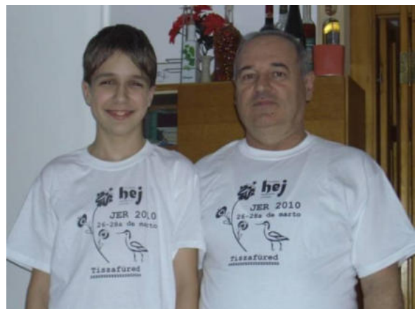
Kun sia nepo en JER en 2010 (Tiszafüred)

Oficiale nei la utilecon de Esperanto-lingvo kaj movado ne estas dece. Eĉ kelkfoje internaciaj organizaĵoj mencias Esperanton kun rekono. Ĉi-jare ni rememoras pri Rezolucio de UNESKO, aperinta antaŭ 60 jaroj. Tamen la praktika agado estas alia. La hegemonio de la angla lingvo estas evidenta. En nia lando la instruado de angla lingvo estas deviga. Pli kaj pli estas kondiĉo de