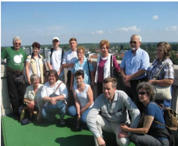
Kelkaj partoprenantoj en la urborigardo

Inter la 11-a kaj 13-a de julio 2014 en la belega urbo Győr okazis la 46-a Landa Amika Fervojista Esperanto-Renkontiĝo. Antaŭ sep jaroj okazis ĉi tie la 39-a Renkontiĝo, kiu estis memorinda pro la 50-a datreveno de la fondiĝo de nia Asocio. Ambaŭ renkontiĝojn organizis eminente kaj profesie la Fakgrupo Győr.