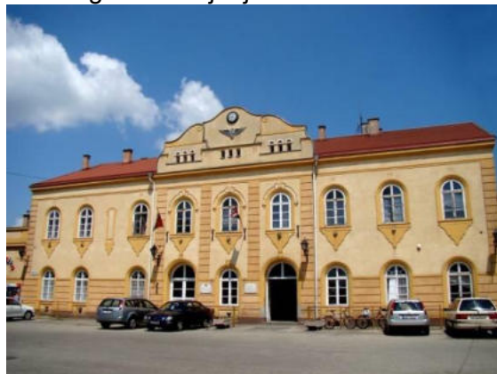
La rekonstruita stacidomo

krom la antaŭurba trafiko la internacian itineron Budapest-Szob (sur linio n-ro 71). Dum la rekonstrua laboro ĝis la jarfino malpli da trajnoj veturas tuŝante la stacion Vác, labortage 130-140 trajnoj haltas en la stacio Vác. Depost la decembra horarŝanĝo atendeble la trajnoj veturos ĝis Vác sur la linioj 71 kaj 75. Nuntempe labortage 135 trajnoj veturas sur la linio n-