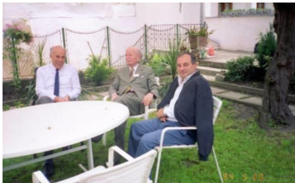
En amika rondo dum la 46-a IFK en Krems

La demando estas iom flata kaj eble troiga. Vere mi okupiĝas pri aferoj de diversaj terenoj, sed ankaŭ mem la vivo estas multkolora. Kiam mi konatiĝis kun lingvo Esperanto, mi pensis, ke miajn fakajn konojn mi devas priskribi en ĉi tiu lingvo. Komence mi faris tradukojn de mallongaj faktekstoj, poste mi verkis mallongajn artikolojn. Mi tre ĝojis kiam kelkaj el ili aperis en nia fakrevuo, en Hungara Fervojista Mondo. Grava rekono estis por mi, kiam en 1984 nia fakrevuo prezentis mian jam