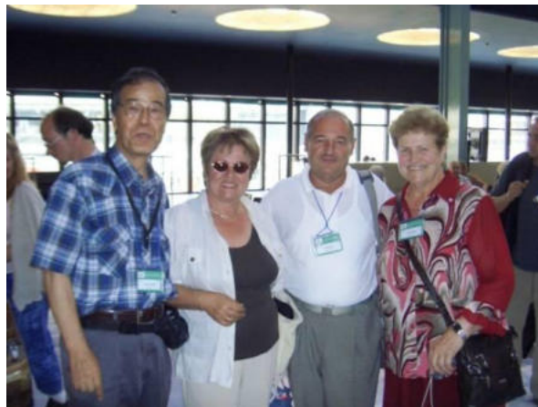
Renkontiĝo kun malnovaj geamikoj en la 93-a UK

Memkompreneble la vivo konsistas ne sole