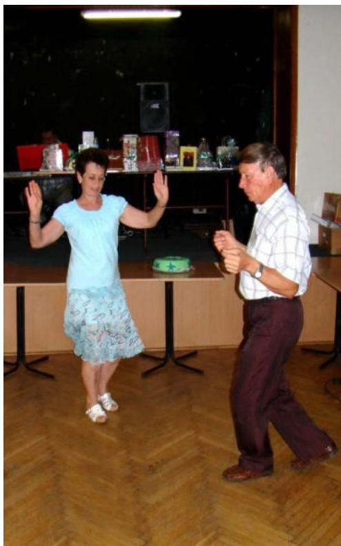
Dancemuloj sur la pargeto

plej modernaj italaj konstruaj principoj, kaj fariĝis la plej fortika loko de la lando. Post incendio plaginta la tutan urbon en 1566, ĝi rekonstruiĝis kun stratoj geometrie