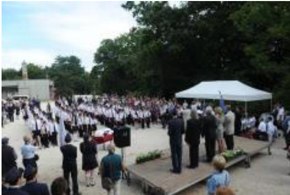
La proklamiga ceremonio