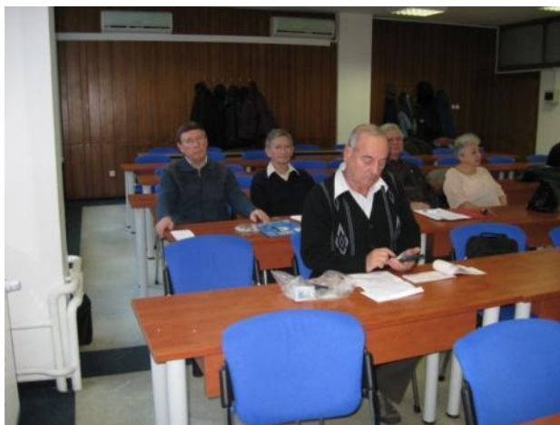
Parte de la partoprenantoj

Malfacila jaro estas malantaŭ ni. La serio de malsanoj, la malserta financa stato, la malfacilaĵo de la translokiĝo de nia asocio kaj aliaj homaj kaj asociaj problemoj kaŭzis zorgojn en la agado de la hungaraj fervojistaj esperantistoj. Eĉ ne nur en Hungario, sed en la tuta Esperantujo okazis multaj neatenditaj malbonaj eventoj kaj