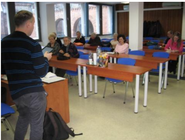
La sekretario konigas la raporton de la estraro