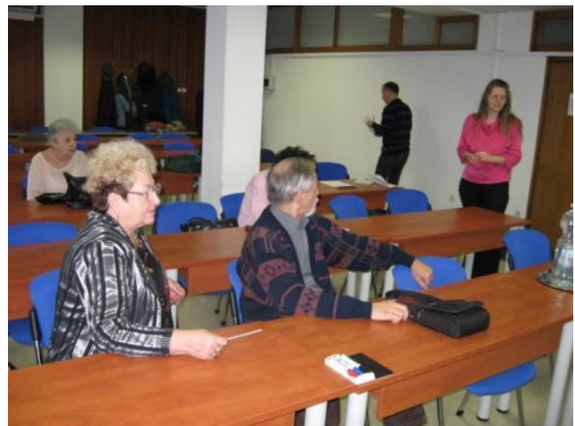
La vicprezidantino de HEA alparolas

En la pasinta jaro inter la hungaraj fervojistaj esperantistoj ne okazis mortado, sed bedaŭrinde kelkaj