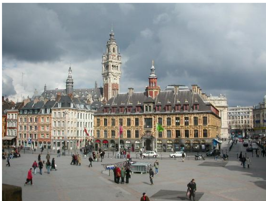
La ĉefplaco de la franca urbo Lillo, kiu okazos la centa Universala Kongreso de Esperanto