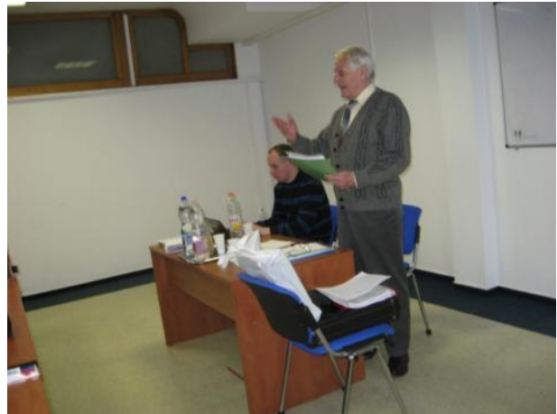
La prezidanto salutas la kunsidon

agadplano de IFEF, la agadon de la du komisionoj kaj de la establitaj sep laborgrupoj. La ĝenerala kunsido akceptis la raportojn pri la efektivigo de la buĝeto por la jaro 2014 kaj la raporton de la Kontrola Komitato, kaj fine la kunsido akceptis la laborplanon kaj la buĝeton de nia asocio por la jaro 2015. Pro la ŝanĝo de la landaj reguloj la kunsido ankaŭ ŝanĝis la statuton. Finfine la kunsido akceptis la raporton pri la nunjara „Landa Amika Fervojista Esperanto-Renkontiĝo”, kiun la membroasocio Tata organizas en la urbo Tata.