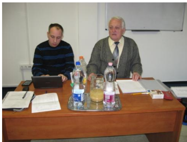
La prezidanto kaj la sekretario

Unu el la plej grava tagordpunkto de la ĝenerala kunsido estis la raporto de la estraro pri la agado de nia asocio en la jaro 2014. Laŭ la raporto la membro-nombro signife ŝanĝiĝis. Nia asocio havis 471 membrojn kune kun la du membroasocioj (en 2013 tiu nombro estis 524), inter ili 15 IFEF-membrojn (en 2013: 20), 6 fakdelegitojn, 6 individuajn membrojn de UEA kaj 12 dumvivajn membrojn. Se ni ekzamenas la konsiston de nia membraro, ni povas konstati, ke la