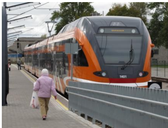
La nova trajnkompleto

La Estonaj Fervojoj AS Eestiliinirongid (Elron) aĉetis ĉe Stadler Bussnang AG en Svisio trajnkompletojn por la elektrizita ĉefurb-regiona trafiko ĉe Tallin kaj ankaŭ