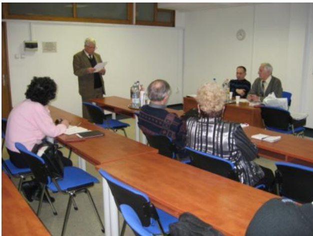
La Kontrola Komisiono raportas

progresigi al ĝusta vojo. La komitato de IFEF akceptis la novan strategian laborplanon por la jaroj 2014-2016. La komitatoj akceptis la raportojn de la estraro, la ĉefkomitatano kaj la gvidantoj de la Faka Komisiono, aprobis la buĝeton kaj la novajn jarkotizojn, kaj decidis pri la venontaj kongresoj. Dum la kongreso la partoprenantoj aŭskultis altnivelajn fakprelegojn kaj faris ekskursojn en la belega regiono de Italio, eĉ ili ĝuis interesajn kulturajn