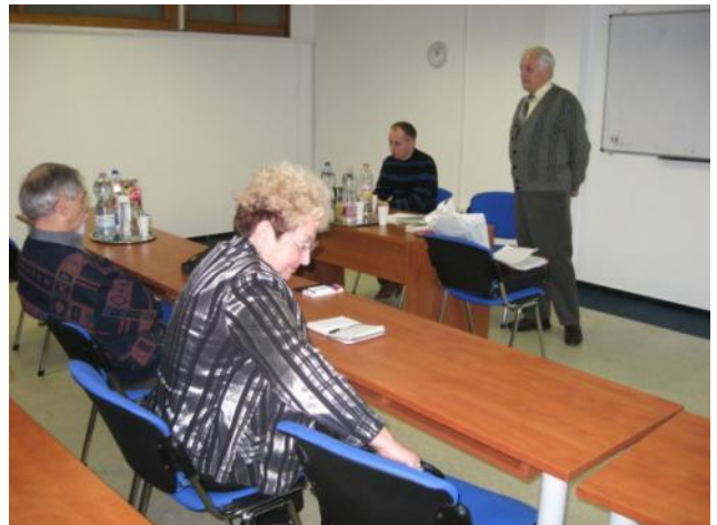
La prezidento respondas

La 47-a Landa Amika Fervojista Esperanto-Renkontiĝo okazos en la urbo Tata. La organizantoj jam aranĝis multajn renkontiĝojn, pro kio ili havas spertojn por akiri sukcesojn. Dum la renkontiĝo okazos duontaga ekskurso per urba trajneto al la fortikaĵo Tata, kiu situas apud la granda lago. La organizantoj planas tuttagan ekskurson per speciala aŭtobuso al la fama urbo Esztergom, kie la partoprenantoj vizitos la Bazilikon, postrestaĵojn, trezorejon kaj