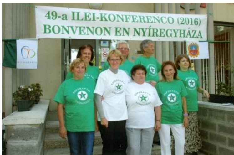
LKK-anoj en la konferenco

Prezidanto de la Hungara Fervojista Esperanto-Asocio, honora membro de IFEF.”