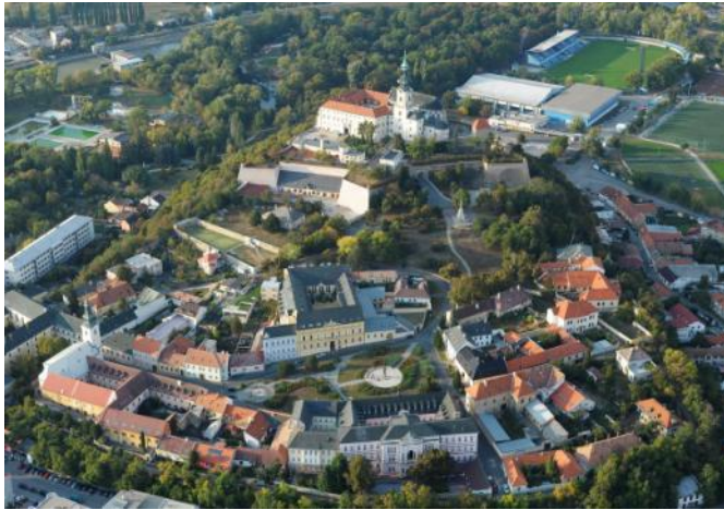
La urbo Nitra el birdoperspektivo