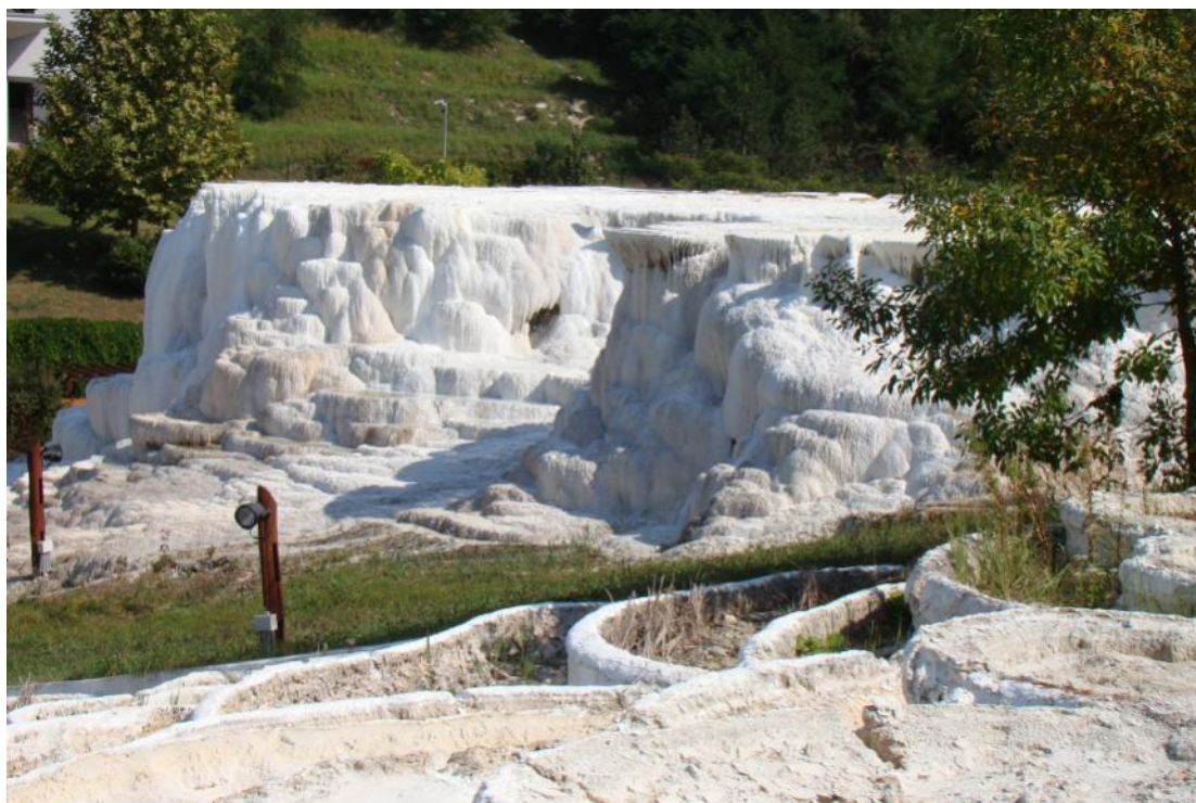
La salmonteto en Egerszalók