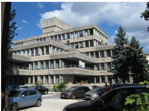
La rezidejo de HEA

La estraro de la Hungara Fervoĵista Esperanto-Asocio (HFEA) la 5-an de oktobro 2016 kunsidis en la rezidejo de la Hungaria Esperanto-Asocio. Partoprenis el la trimembra estraro du estraranoj (D-ro József Halász pro malsano mankis), la trimembra Kontrola Komitato kaj unu gastu. La estraro traktis ses tagordpunktojn. Unue la prezidanto raportis pri la laboro de la asocio laŭ la „Agadplano”. Laŭ tio kelkaj punktoj: