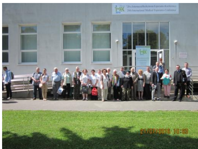
Partoprenantoj dum la 20-a IMEK

La medicinista konferenco kaptis la atenton de la amaskomunikilo tiel, ke radio kaj televido intervjuis partoprenantojn kaj raportis pri la IMEK.