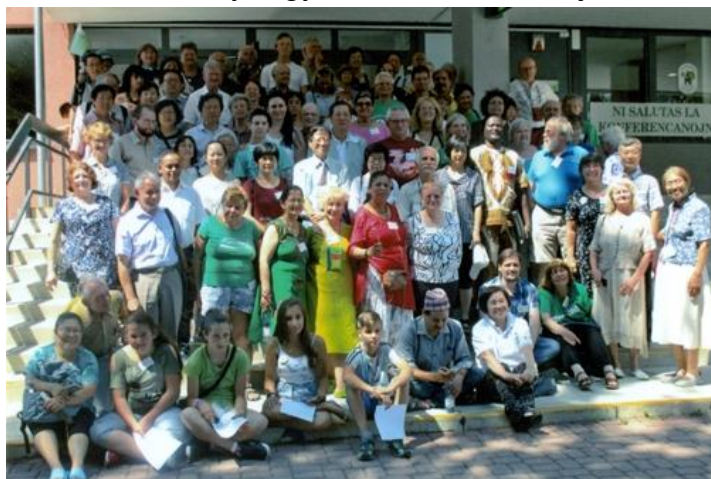
Partoprenantoj de la 49-a ILEI-konferenco