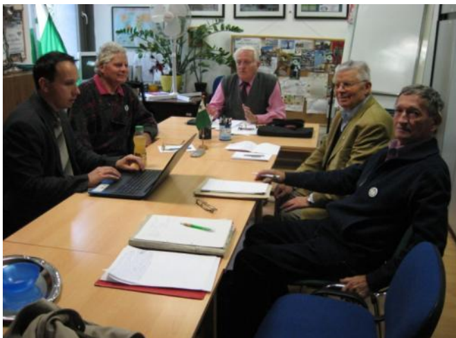
Dum la estrarkunsido

La estraro decidis ankoraŭ pri la bindaĵo de HFM numeroj de la jaroj 1991-2015. Ankaŭ decidis la estraranoj pri la historio de nia asocio, kiun devas finpretigi, kaj poste presi, se niaj financaj eblecoj ebligas.