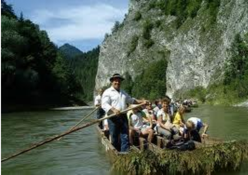
Flosado sur la rivero Dunajec

15-a jarcento. Okaze de la konstrulaboro de tiu ĉi preĝejo oni ne uzis feronajlojn nur tenonojn. La preĝejo estas ekde 1991 kulturaj mondaj heredaĵoj de Unesko. Dumvoje ni haltis ĉe la fortikaĵo „Nedec” ( Niedzica ). La fortikaĵon konstruigis en gotika stilo la hungara princo Géza en la jaro 1325, poste posedis ĝin la familio Zápolya , poste la familio Pálóczy Horváth , kaj fine la familio Salamon . Post la dua mondmilito la fortikaĵon posedis la pola ŝtato. Poste ni daŭrigis nian ekskurson en la nacia parko, kaj sekvis la