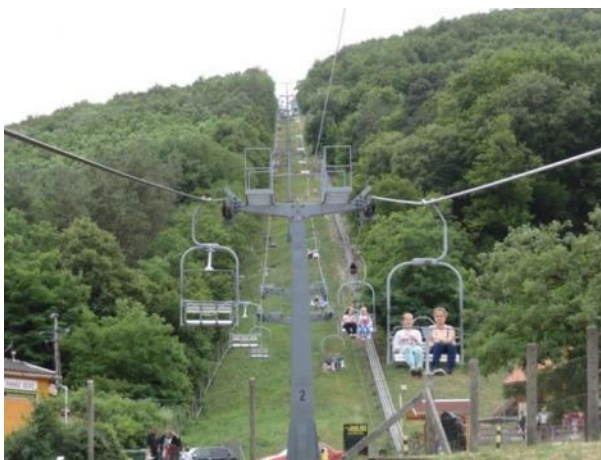
La plej longa seĝa telfero en Hungario

En Hungario pri la plej longa seĝa telfero povas fieri urbo Sátorajjájhely . Longo de la telfero estas 1332 m, kiu inter 250 – 480 m alto super la marnivelo kapablas transporti per 99 lift-seĝoj samtempe ĉirkaŭ 200 pasaĝerojn. Tipo de la telfero estas unukabla karusela (kun rondira kablo). Ĝia plej granda alto super la ternivelo estas 14 m-oj. Daŭro de la veturo de la malsupra stacio ĝis la montopinto estas 19 minutoj. La ĉefa enirejo de la Aventurparko Zemplén troviĝas ĉe la