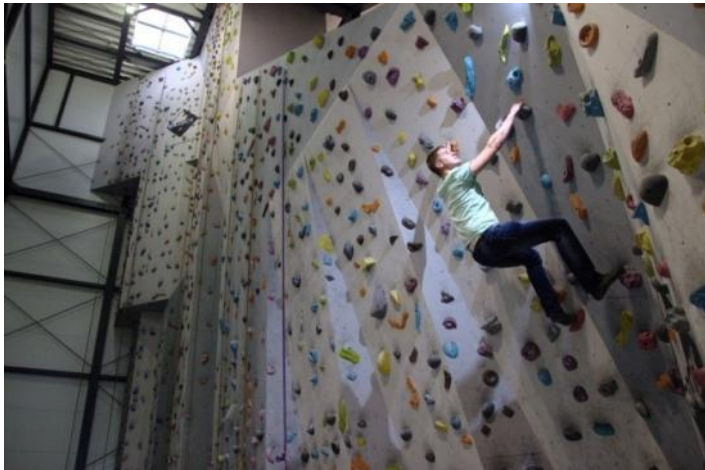
Bravulo sur la grimpomuro

La sekurigajn ekipaĵojn, mem la Aventurparko Zemplén disponigas, pro la nediskutebla responso. Pro la pli sekura grimpado memkompreneble muromajstro inspektas la grimpantojn. Krom la kunŝnura grimpado ricevis lokon ankaŭ la „ boulder ”. La signifo de „ boulder ” estas ŝtonbloko. Ĉi tiu estas gravita grimpado sen sekurigo en malgranda alto. La tasko estas libere grimpi per eltrovitaj movoj 3 – 4 metrajn altojn. La