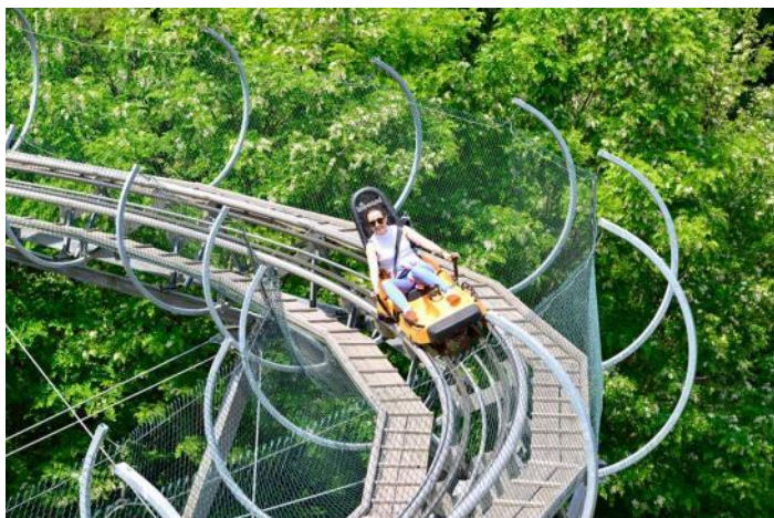
Veturo sur la bobvego

Ankaŭ la plej longa bobvego de nia lando troviĝas ĉi tie. Ĝia longo estas 2275 m-oj. La malsuprenlito estas absolute sekura, la bobo estas fiksita al kvar tuboj. Ĉiu pasaĝero memstare kondukas sian bobon, kiu ĉe rapido 37 km/h aŭtomate bremsiĝas, garantante tiel maniere la sekurecon de la glito. La kondiĉoj, ĉirkaŭaĵo, kaj beleco de la veĝo donas neforgeseblajn travivaĵojn por ŝatantoj de la rapidego.