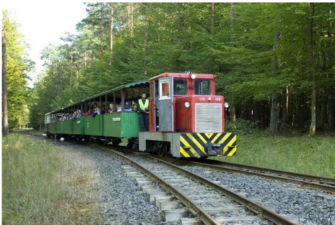
Arbara provinca fervojo en la „Bükki” Nacia Parko