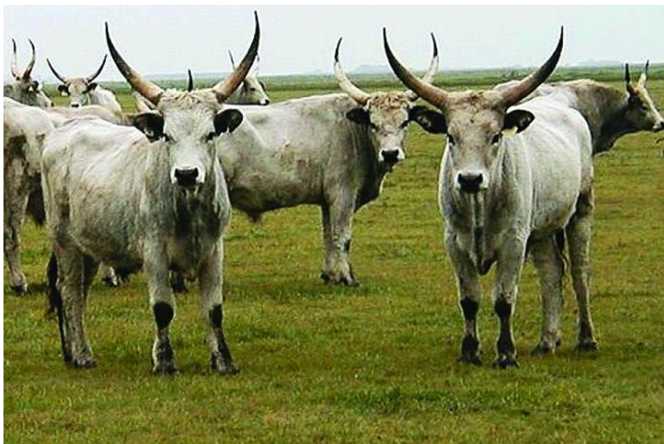
Grizbovoj en Hortobágy

Kelkaj muzeoj (Sághegyi, Őrségi k.a.) prezentas la naturan kaj kulturhistorian valorojn de tiu nacia parko. Ankoraŭ videblas tie minejoj, vinberkulturo kaj potfarista arto. En urbo „Kőszeg” ekzistas birdoprotekta modeloĝigejo, kie oni sanigas la difektitajn birdojn. Ĉi tie troveblas pli ol 200 speciaj arboj, inter tiuj la rara ĉina lariko.