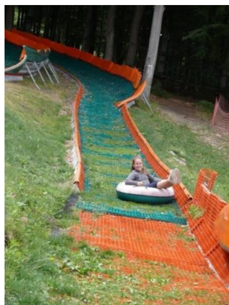
Sur la trogvojo

Por vizitantoj alvenantaj kun neplenaĝaj infanoj oni konstruis familiamike ludparkon konvenan al normoj