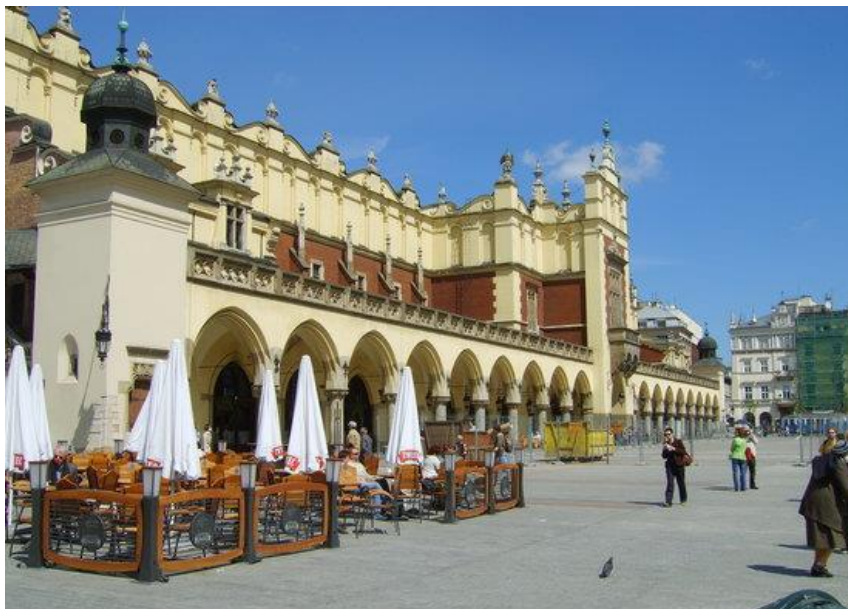
La ĉefplaco en Krakovo