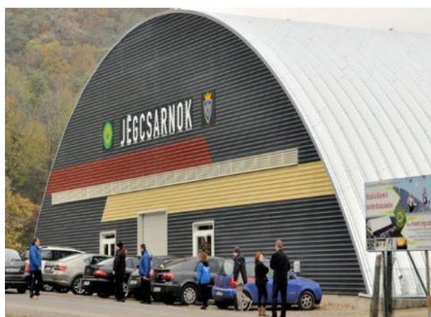
Kovrita sportejo por sketantoj

La ĉefa vidpunkto ĉe formado de la vojoj estis ke trovu por si konvenan mursurfacon infanoj, komencantoj kaj ankaŭ profesiuloj. Dank' al tio - de ĉirkaŭ IV minuso por la tute komencantoj ĝis X minuso kiu estas rigardebla por la ne tre spertaj grimpuloj tro malfacila - oni povas grimpi vojojn el iu ajn parto de la skalo, entute 25 – 30, inter ili ankaŭ negativajn. Sekve de tio, jam nur la kreiveco de la uzantoj limigas la senfinajn forneto, kuirplato. Oni povas rezervi peplomojn, kombinaĵojn.