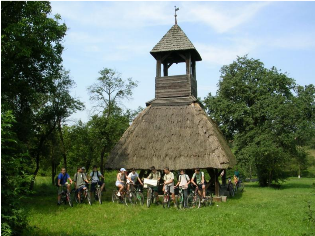
Ligna sonorilejo en la „Órségi” Nacia Parko