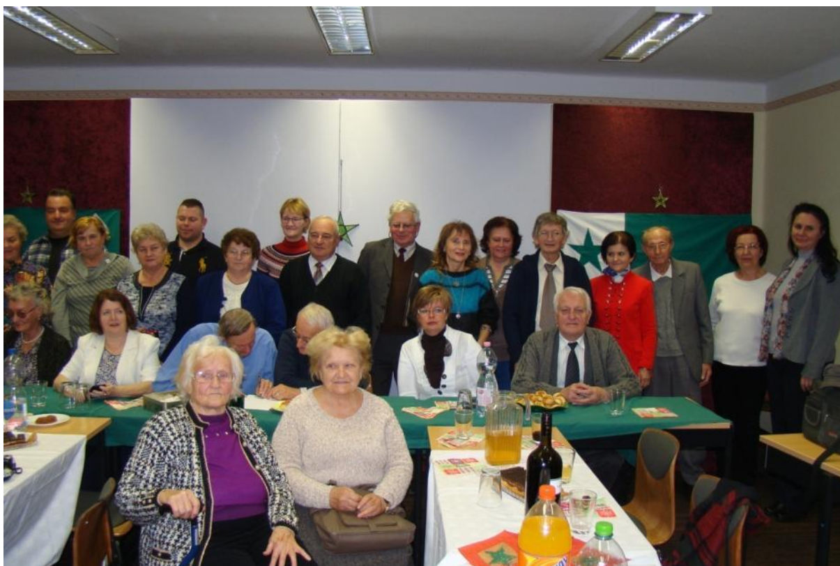
Partoprenantoj de la memorfesto

Por mi estis granda ĝojo kaj honoro, ke la „Verda Stelo” Esperanto Societo en Nyíregyháza invitis min partopreni en la ĉi-jara Zamenhof-memorfesto. Jam estas tradicio, ke ĉi tiu societo organizas ĉiujare tiun aranĝon, kiu okazis la 10-an de decembro en la fervojista kulturdomo. La gastoj venis el Budapeŝto, Debrecen kaj Miskolc, kaj kune kun la lokaj esperantistoj entute partoprenis 30 personoj en la memorfesto.