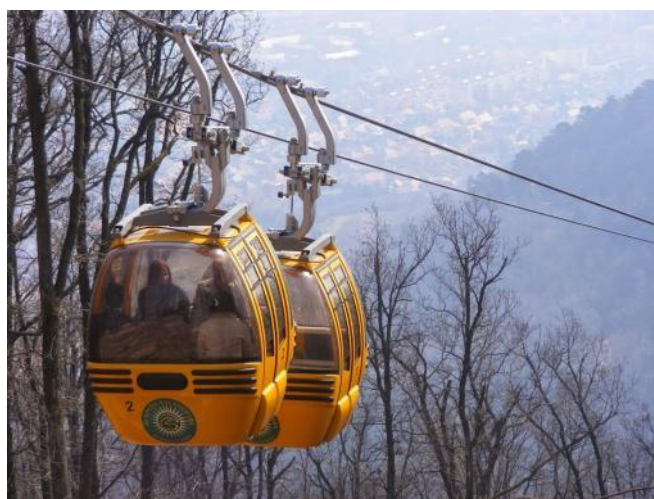
Etkabina telfero nomita "Burdo"

La 1036 m-ojn da distanco inter montopintoj Magas-hegy kaj Szár-hegy oni povas traveturi ne nur per etkabina telfero. Se la veturantoj en la kabino de telfero elrigardas tra la panorama fenestro ili povas vidi paralelajn kablojn. Tio estas la „Falko” per kiu dezirantoj de ekstrema aventuro povas traveturi la preskaŭ unu kaj duono kilometrojn da distanco kun rapido 80 km/h. Ankaŭ ĉi tiu ekstrema traglita