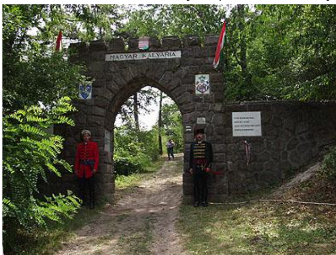
Enirpordego de Hungara Kalvario

Sátoraljaújhely iĝis malgranda apud landlima urbo, kiu mem estis dividita de la landlimo je du partoj. La revizia politika etoso de la postmilita erao ankaŭ en la urbo ekirigis socian agadon, Danke al tiu agado el sumo de publika monokolektado estis konstruita unika monumentaro en nia lando kies partoj estas Landa Standardo, Hungara Kalvario kaj