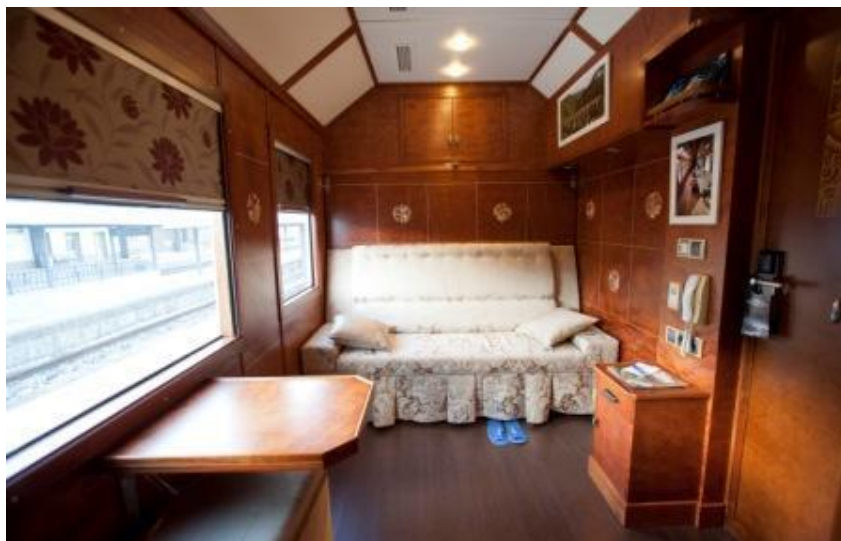
Luksa kupeo por du personoj

de vidaĵoj de la traveturata pejzaĝo, nek de la kvietaj sonĝoj. Post la abunda matenmanĝo la program en Jerez estas vizito de tipa vinkelo, sekve la facilan