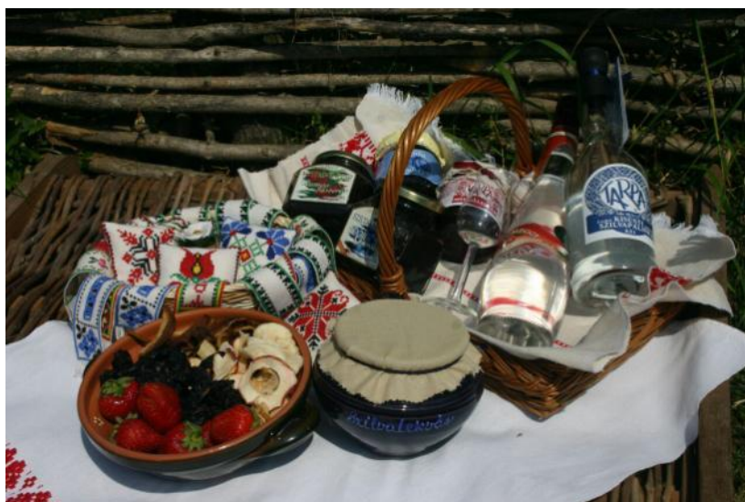
Lokaj produktaĵoj en la naturparkaj kolonioj

Tiu naturparko troveblas en la Mezmontaro de Transdanubio, kaj enhavas la tutan montaron „ Vértes ”, kaj grandan parton de la bazeno „ Zámoly ”. Sur la 36 mil hektaraj teritorio troveblas 17 kolonioj, el kiuj la plej gravaj estas Oroszlány, Mór, Csákvár, Szárliget .