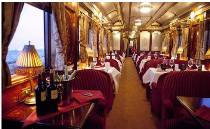
La restoracia vagono

majstraj manĝaĵoj de elstaraj ĉefkuiristoj dorlotas la gustoburĝonojn, konvene al la loka kuirarto, en iu ajn parto de la tago. Komence de la riĉa matenmanĝo, tra la sepplada tagmanĝo, ĝis la vespermanĝo akompananta per viva muziko ĉiu manĝado estas parto de la servo.