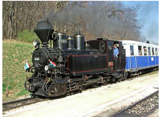
Provincaj fervojoj en Hungario