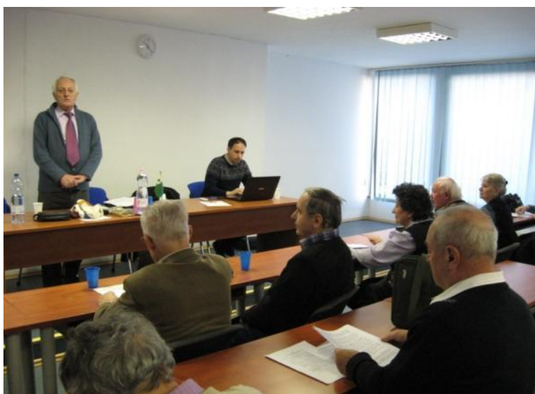
La prezidanto salutas la partoprenantojn