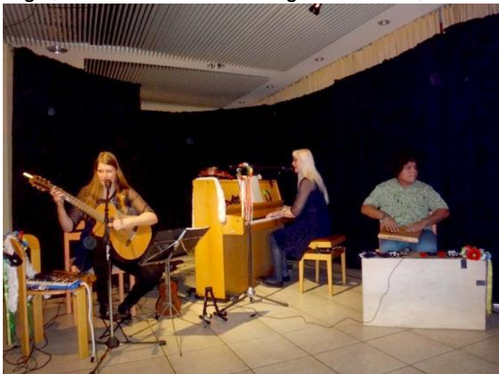
Vespera koncerto de ĴeLe

Ankaŭ la infanoj ĝuis tre riĉajn programerojn en multaj atelieroj. Interesis ilin pretigado de pilkoj por ĵonglado, origamio, fabrikado de strigoj kaj aŭtoj el kartono, pupetoj el ŝtofoj. Ne mankis rostado de bananoj kun ĉokolado, preparado de filmeto farita el fotoj, poŝtranĉiloj, kantado, ĵonglado, feltumado kaj ornamo sekvis "Mazi-kurson". Plaĉis al ili ludado kun samaĝuloj kaj libera petolado. Dum la paŭzoj virinoj trikis, iuj komputilis, legis, kartludis aŭ babilis ĉe glaso da vino, biero aŭ kafo.