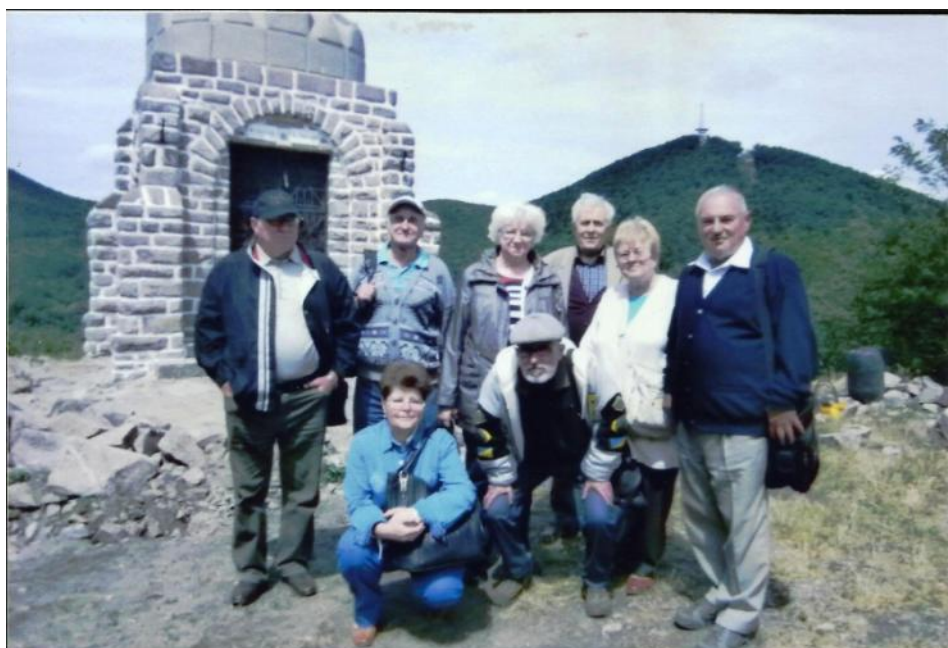
Antaŭ kapelo de Sankta Stefano

La Hungara Kalvario estis inaŭgurita la 4-an de oktobro 1936. La memorlokon kompletigis la kapelo de Sankta Stefano en 1938. La kupolo de la kapelo formas la hungaran reĝan kronon.