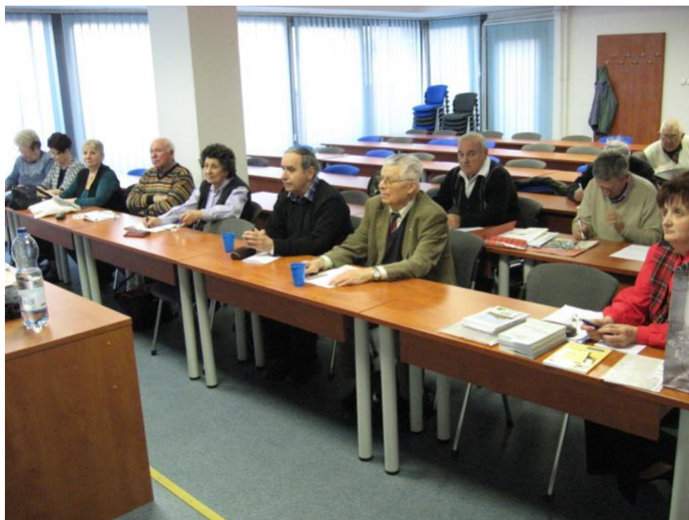
Partoprenantoj en la ĝenerala kunsido de la Hungara Fervojista Esperanto-Asocio