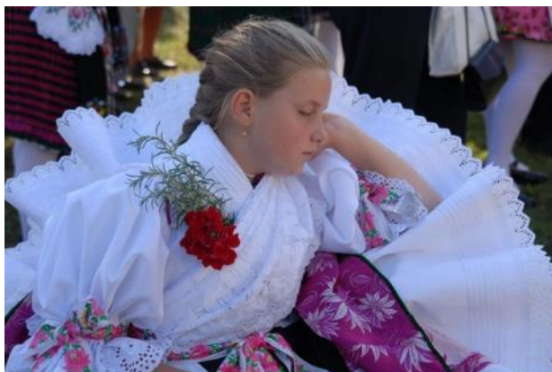
Ripozo inter du spektakloj en la naturparko

Tiu naturparko etendiĝas en la valo de la rivereto Koppány , 30 km-ojn de la lago Balatono . La surfaco de tiu naturparko estas la plej malgranda inter la naturparkoj, ĉar havas nur 400 hektarojn. Tiu kuntenas la plej primitivaj etvilaĝoj de la regiono „ Ekstera Somogy ”. Nuntempe nur 10 vilaĝoj apartenas al la naturparko.