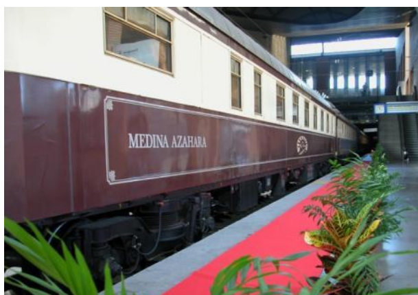
La trajno "Al Andalus" en stacidomo

Nun ni prezentas unu el la plej famaj luksaj trajnoj en Eŭropo, la „Al Andalus”.