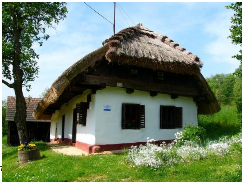
Tipa kamparana domo en la "Hét Patak Gyöngye" naturparko

Unu el la plej malgrandaj naturparkoj estas ĉi tiu naturparko. Ĝi havas 10 mil hektarajn teritorion, kiu etendiĝas en la landpartoj „Völgység” kaj „Nordzselic”. La nombroj de la kolonioj estas nur 8, el kiuj estas la plej gravaj Alsómocsolád, Csikóstóttós, Kárász kaj Kisvaszar .