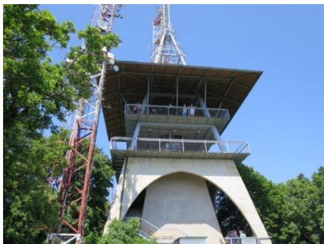
Belvidejo sur pinto de monto "Magas"

Sur la pinto de monto ( Magas-hegy ) troviĝas duetaĝa belvidejo el kiu bela panoramo aperas antaŭ okuloj de la vizitantoj. Oni povas vidi urbon Sátoraljaújhely ĉe piedo de la monto, la ebenaĵon de Bodrogköz , la ĉirkaŭajn montojn kun fortikaĵo Füzér , kaj en bona vetero ankaŭ pintojn de Altaj Tatroj.