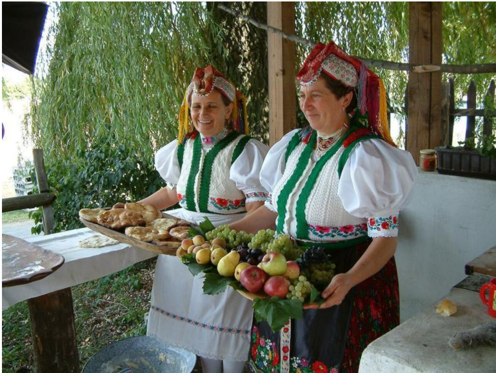
Virinoj en naciaj kostumoj en „Palócföld”