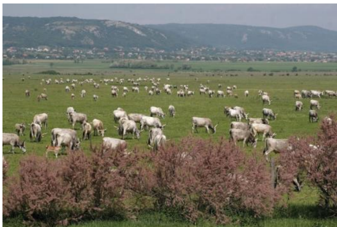
Paŝtiĝa grego en la naturparko

En la jaro 1991 la hungara-aŭstra komitato, kiu preparis la fondon de la „Fertő-Hanság Nacia Parko” lanĉis unue, ke flanke de la naciaj parkoj estus laŭcele fondi naturparkojn laŭ aŭstra modelo, kiuj bone kompletigus la aktivecon de la naciaj parkoj. La proponon sekvis ago, kaj en 1997 la kolonioj de la montaro Kőszeg fondis la „Irottkő Naturparkon”, kiu en 2006 ricevis la ministran aprobon por la „Naturparko” nomuzado.