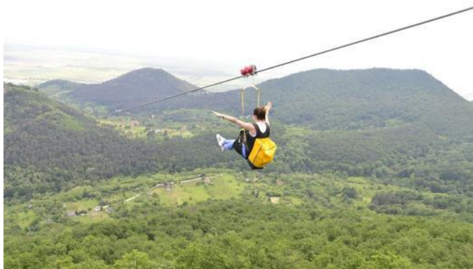
Falko - inter tero kaj ĉielo

kablovojo estas unika en nia lando, Eĉ ankaŭ en Eŭropo ĝi estas konata nur en regiono de Alpoj.