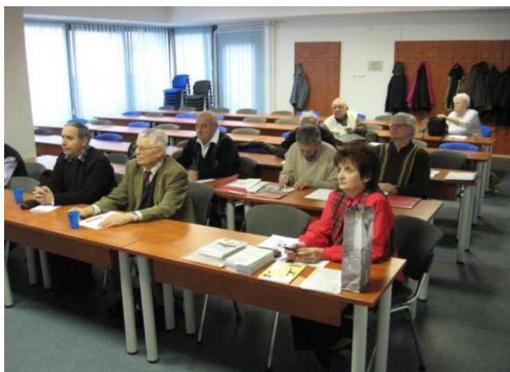
La deputitoj aŭskultas la raporton de la estraro

La Kontrola Komitato ekzamenis la mastrumadon de nia asocio, kaj konstatis, ke la librotenado estis laŭfaka, la estaĵoj estis laŭregulaj. La Komitato analizis la efikon de la monmanko, kaj proponis al la ĝenerala kunsido la akcepton de la raporto de la Komitato. La laborplanon la deputitoj de la kunsido sen ŝanĝo akceptis, kaj proponis, ke laŭ tiu laborplano pluagadu nia asocio. Same akceptis la deputitoj la nunjaran buĝeton. La prezidanto de nia asocio iomete detale parolis pri la agado de UEA, IFEF kaj HEA. Li konstatis, ke la Esperanto-movado havas krizon. Mankas gejunulojn en ĉiu tereno de Esperanto. Bedaŭrinde rapide maljuniĝas la movado, ne estas tiuj junuloj, kiuj povus transpreni la ŝtافetbastonon de la maljunaj movadanoj. Tiu fakto montriĝas ĉefe en la fervojista movado, kie kontinue malaltiĝas la membro-nombro de la landaj asocioj. En la fino de la pasinta jarcento la membro-nombro de IFEF estis pli ol 2000, nun nur 350,