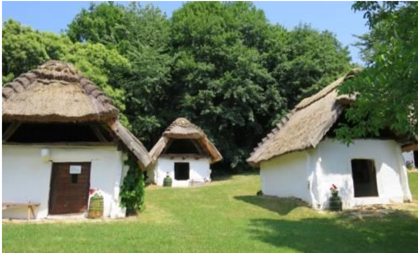
La kelovico en Cák