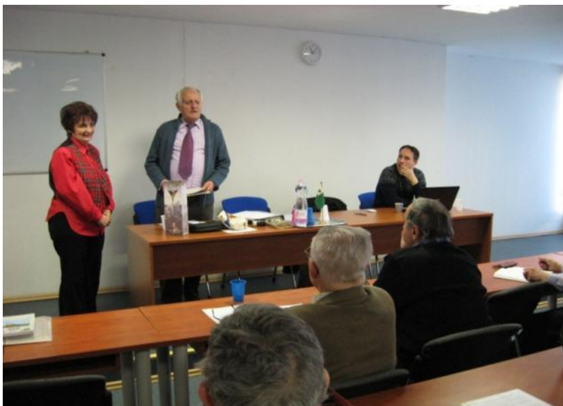
La prezidantino de HEA salutas la kunsidon

En la kadro de la hungarlanda Esperantomovado okazis kelkaj kunsidoj, kie oni elektis novan estraron, kaj ni provis ordigi niajn vicojn, kaj difini la direkton de la evoluo. Ni esperas, ke pere de la entuziasma kaj laborkapabla estraro la hungaraj esperantistoj kunlaborante agados por la sama nobla celo, por la disvastigo de Esperanto.