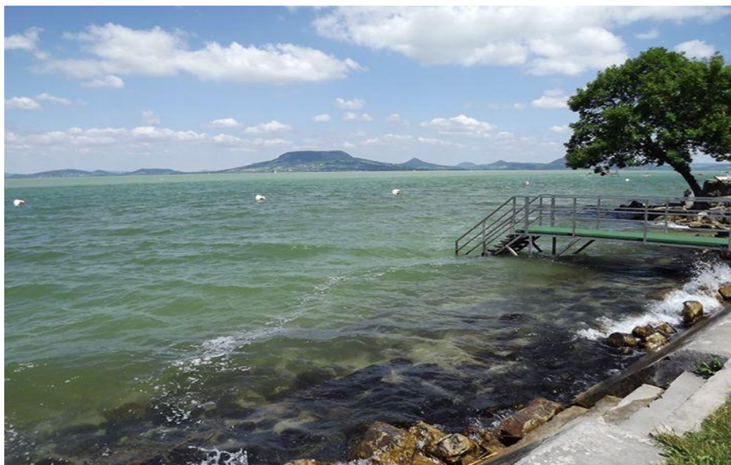
Panoramo de la Balatono kaj de Badacsony el la suda parto trafikanta trajno