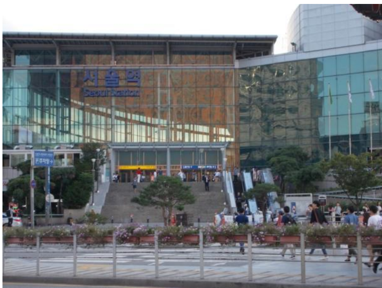
La nova stacidomo de Seulo

La hungara karavano partoprenis kvar postkongresajn tagojn en la kadro de la 13-a Internacia Esperanto Renkontiĝo de Meditado. Tio estis la plej granda kaj interesa travivaĵo por mi. Ni ekveturis per tri aŭtobusoj kune kun ĉirkaŭ cent partoprenantoj. La unua stacio estis urbo Iksan, kie ni vizitis nacian ĉefcentron de la budhismo. Ĝi havas belegan universitaton kaj kulturparkon. Ni vizitis la tian lagon, kaj tie oni faris fotojn pri la grupo. Okazis interesa kaj emocia interkona vespero. Tie ni