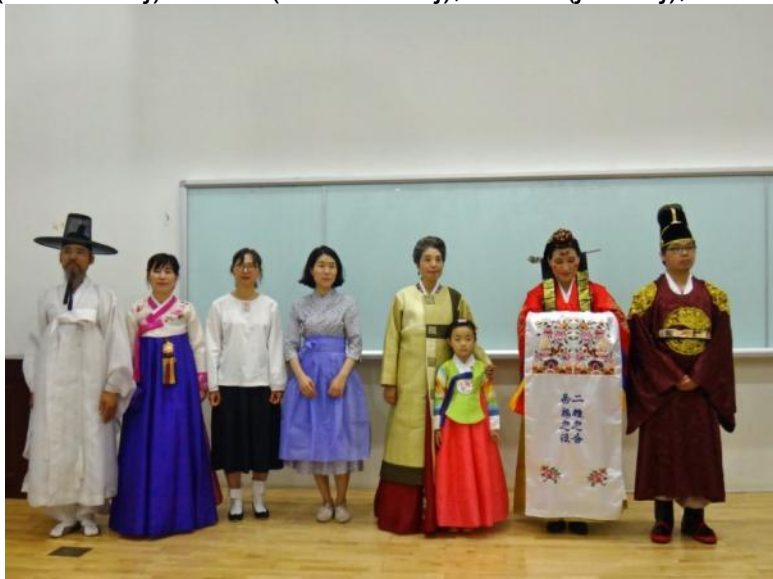
Diversaj kostumoj de Koreio

Okazis IKU-AIS sesioj, lingvaj kursoj kaj KER ekzamenoj, kunvenoj de diversaj asocioj, SAT (Sennacieca Asocio Tutmonda), KAEM (Komisiono pri Azia Esperanto-Movado), LIBE (Ligo Internaciaj de Blindaj Esperantistoj), IKUE-KELI, (kristanaj organizoj) ISAE (sciencistoj) IKEF (komercistoj), IEJA (juristoj), TEĴA (ĵurnalistoj), IREK (komunistoj),