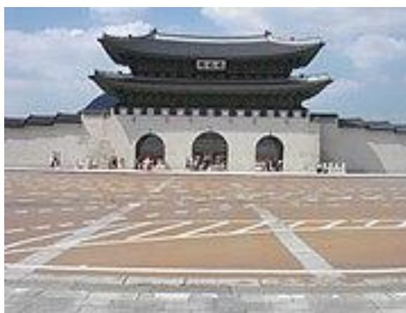
La granda pordego de Seulo

La Korea Respubliko kun trimiljara historio kaj riĉa kulturo estas lando de fascina mikso de malnovo kaj novo. La plej karaj trajtoj de la korea popolo estas diligenteco, pacamo kaj bonkoreco.