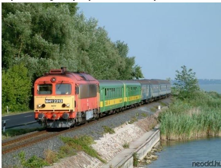
Trajno rekte apud la lago Balatono

Fine mi proponas nuntempe ĝoji pro la rekonstruaj laboroj, pro la planitaj evoluigoj, pro la elektrizado de la norda parta fervojlinio de la Balatono, kaj pacience atendi la efektivigon de la ĉirkaŭvojaĝa ebleco de la lago Balatono.