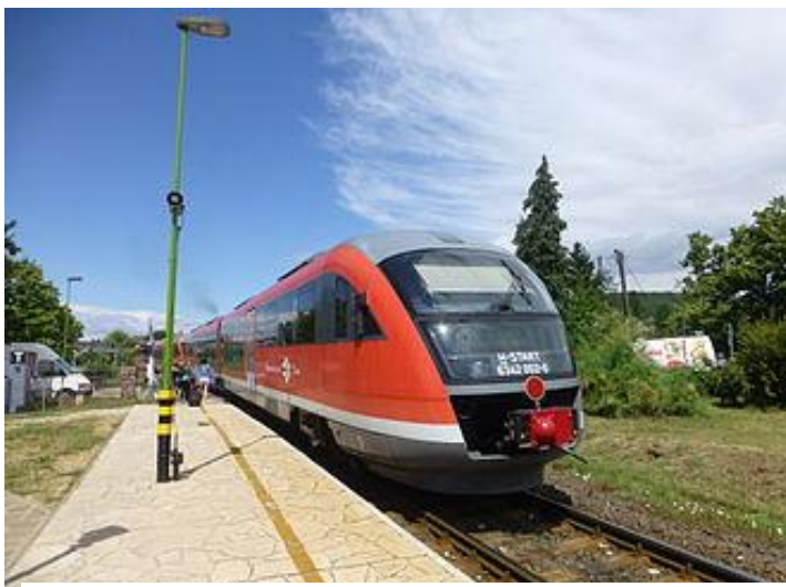
Trajno en la haltejo Balatonarács

en la Balatonon. Pro tio la linion oni rekonstruigis en la lago, kaj ankoraŭ funkcias la fervojo sur tiu traceo.