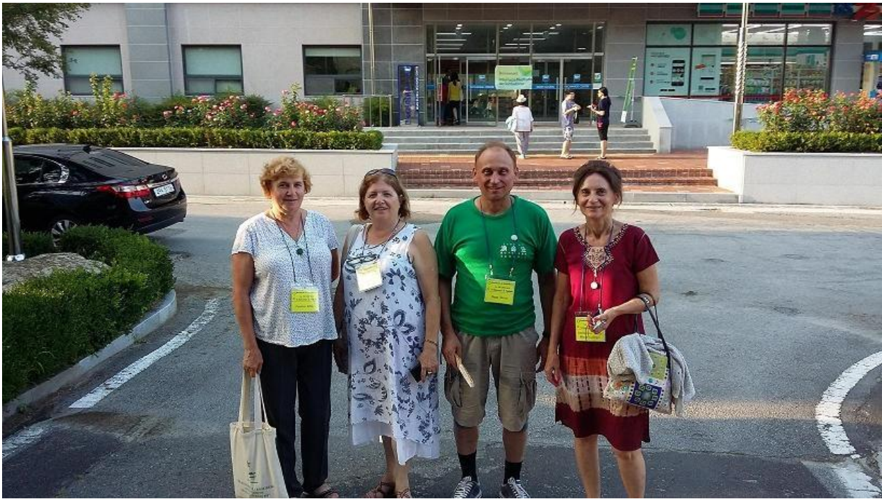
Hungaroj dum la 102-a Universala Kongreso de Esperanto