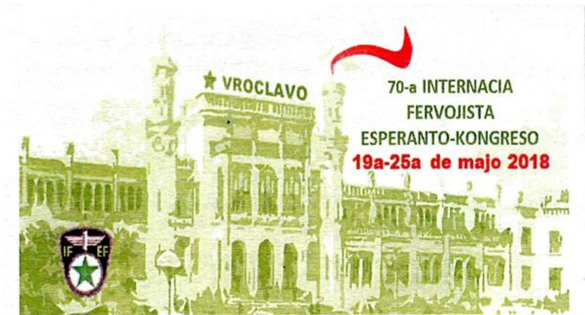
La 70-a kongreso de IFEF okazos de la 19-a ĝis la 25-a de majo 2018 en la pola urbo Vroclavo Informojn kaj aliĝilojn oni povas ricevi de la Hungara Fervoja Esperanto-Asocio