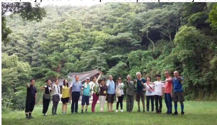
La meditada arupo en la postkonareso

Vendrede la 28-an okazis la jam tradicia aŭkcio de diversaj movadaj eldonaĵoj kaj objektoj helpe de la aŭkciisto Humprey Tonkin. La fermo estis aparte bonetosa. Koncizaj raportoj estis prezentitaj fare de la estraranoj de UEA, kaj la prezidanto laŭtlegis la Kongresan Rezolucion. Sekvis anonco de la rezultoj de la Belartaj kaj Oratora Konkursoj, kaj la transdono de la Premio Deguchi de Oomoto. En la ferma parolo de la prezidanto de UEA taksis la rezultojn de la kongreso, kaj poste alvenis pli ol 60 partoprenintoj de la Internacia Infana Kongreseto, kies kantoj ricevis grandan aplaŭdon de la kongresanoj. Mi rimarkas, ke la kulturaj programoj, kiel la Nacia Vespero, Internacia Arta Vespero, Azia Vespero, Kajto koncerto, Japana Kulturo, Afrika movado ktp plaĉis al mi, kiuj kolorigis la tutan kongresan semajnon. La plej