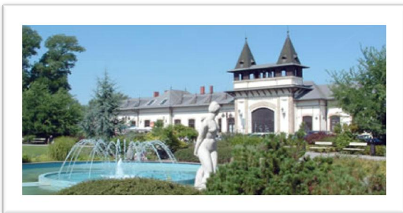
La stacidomo de Siófok

El la stacio Tapolca disforkiĝas duaranga fervojlinio al Celldömölk kaj Szombathely. La konstruo de tiu fervojlinio okazis en pluraj etapoj inter la fino de la 1800-aj jaroj kaj la komenco de la 1900-aj jaroj. Post la efektivigo de la etapoj oni ekfunkciigis ilin, sed la trafiko sur la tuta linio komenciĝis la 1-an de julio 1909. Ekde tiam la