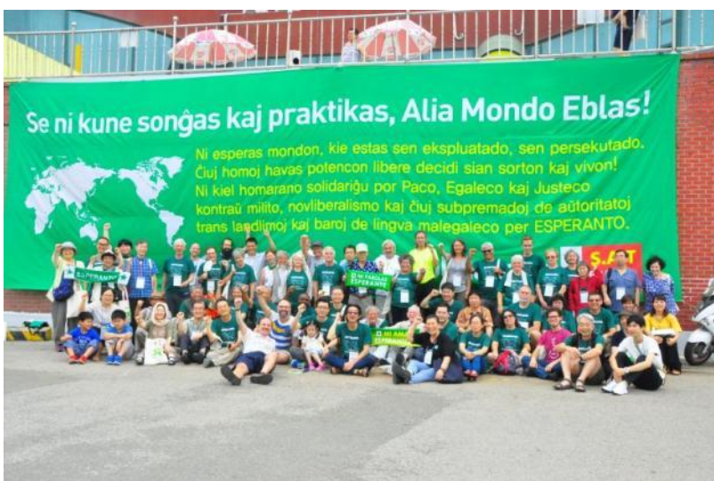
Kongresanoj antaŭ la grandega banderolo

La kongresa temo estis: „Demokratio en nuntempa mondo”. La semajna programo estis klare afiŝita sur apartaj paneloj kaj ankaŭ la kongreslibro en pli