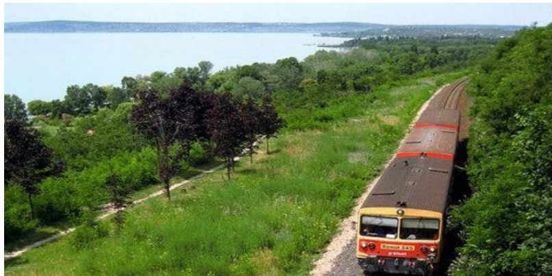
Fervojo apud la Balatono

Laŭ la pretendo de la trafiko oni daŭre malfermis novajn fervojstaciojn kaj haltejojn, kaj oni plivastigis la konstruaĵojn de la stacioj, eĉ plilongigis la fervojretojn en la stacioj. La elektrizado de la fervojlinio ĝis la stacidomo Keszthely okazis inter la jaroj 1988-1990. Per tiu elektrizado kaj la riparo de la trakoj kaj la sekurigaj instalaĵoj certigis pli grandan