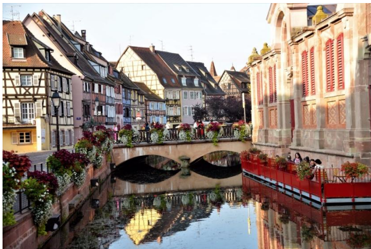
Belega urboparto de Colmar

La solenan malfermon ĉeestis renomaj gastoj; nome de UAICF (Arta kaj Kulturfleganta