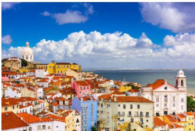
La belega urbo Lisbono