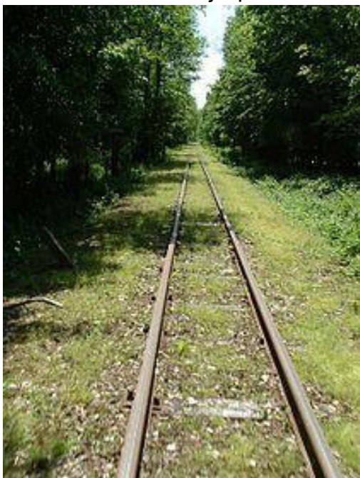
Etŝpura fervojlinio en Hungario

En Anglio oni komencis konstrui la unuajn fervojliniojn, kaj ili elektis tiun ŝpuron. Do ni ekzamenis la kaŭzojn pri tiu elekto, kaj ni povas konstati, ke en Anglio la planojn kaj ŝablonojn oni pretigis laŭ la larĝo de la radoj de la kaleŝoj kaj ĉaroj.