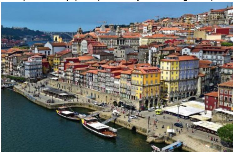
La alia belega urbo Porto

Dum la kunveno pri venontaj kongresoj prezentiĝis Lahtio (Finnlando) por la jaro 2019 kaj Montrealo (Kanado) por la jaro 2020. Kutimaj klerigaj lundaj programeroj