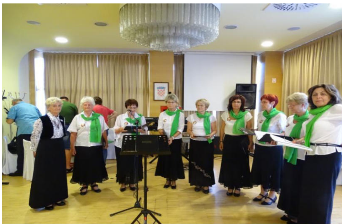
La Koruso Főnix el Komló kantis en la jubilea konferenco de Alp-Adria