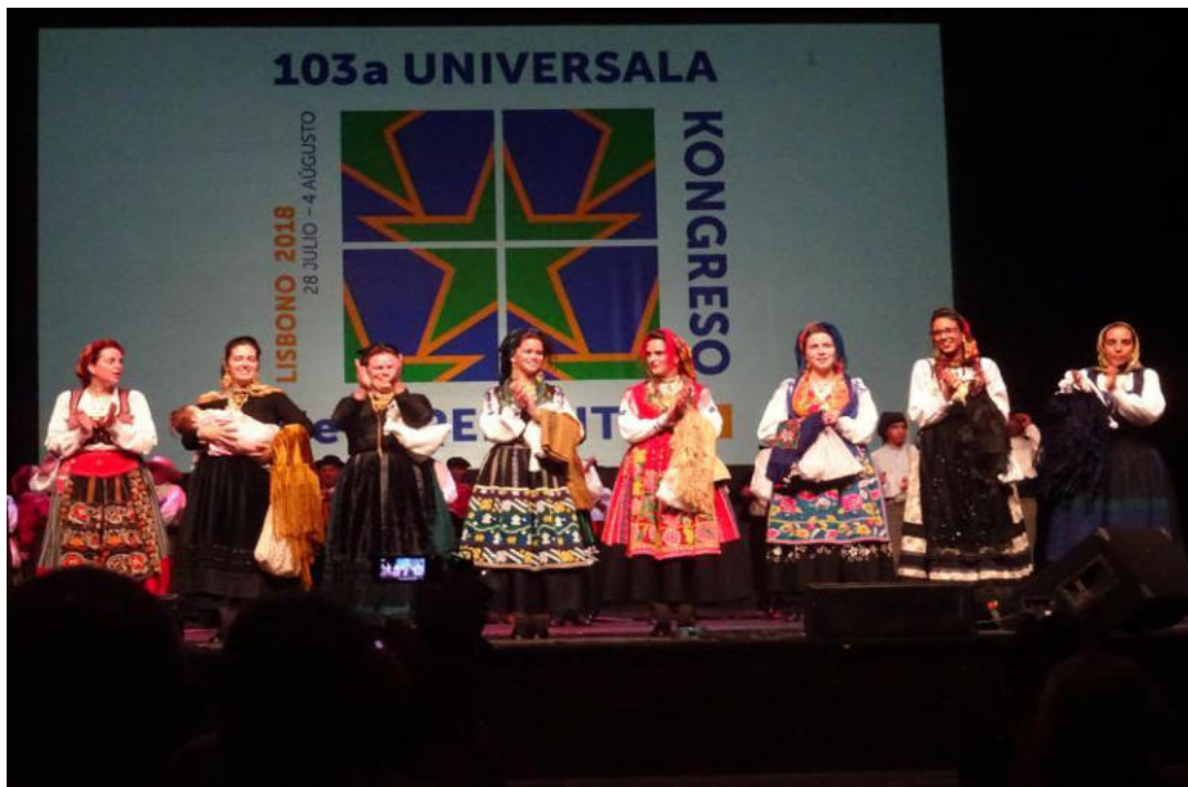
Portugalaj naciaj kostumoj en la Nacia Vespero dum la 103-a UK en Lisbono