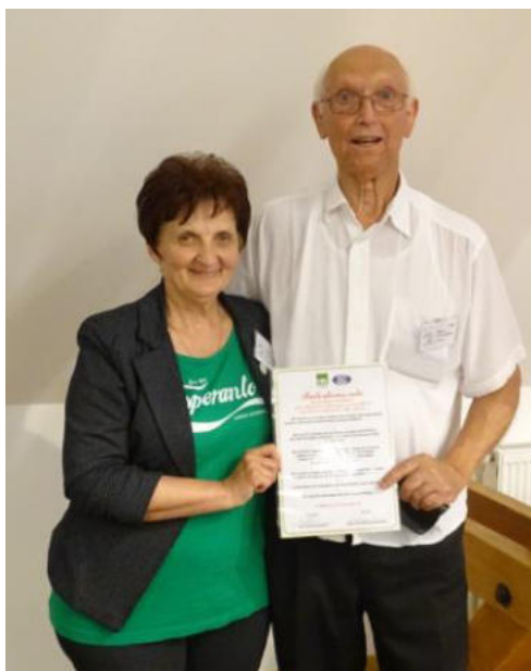
La prezidantino de HEA, kun la prezidanto de Kroata Esperanto-Ligo

„De la placo Esperanto al Urbo Bjelovar kun Esperanto koruso.