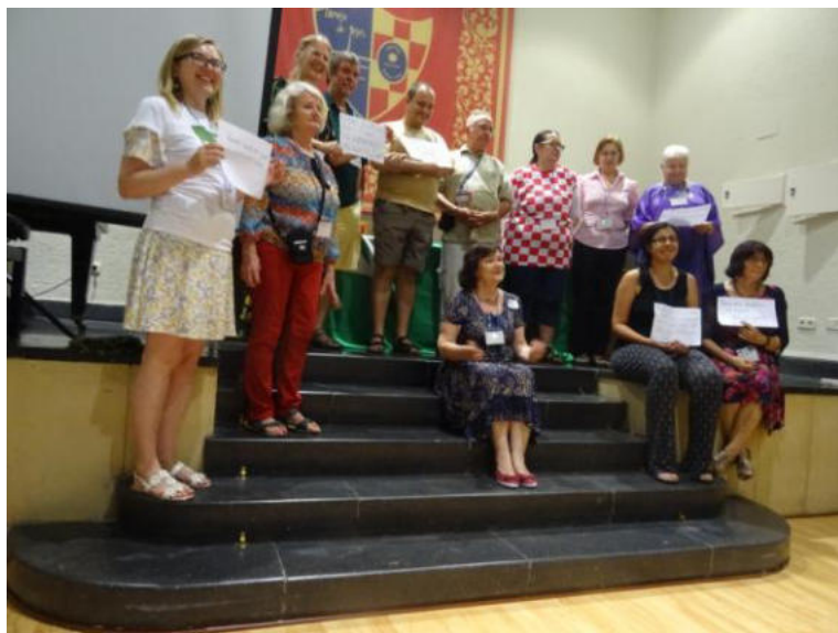
Kelkaj reprezentantoj de Lingva Festivalo

Ni ĝuis tre agrablan kongreson dank' al la bona organizado de niaj hispanaj kolegoj, kiuj multe ŝvitis dum tiuj varmegaj tagoj.