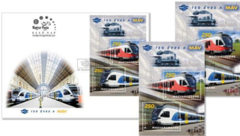
Poŝtmarkoj pri la 150-jara Hungaraj Ŝtatfervojoj

La unua mondmilito kreis multajn malfacilaĵojn, ĉar la tiamaj milittrafiko signifis grandan ŝarĝon, difektiĝis la stato de la fervojaj establaĵoj, kaj post la mondmilito okazis la „Trianona Packontrakto”, kiam restis en Hungario la 38%-oj de la antaŭa fervojreto. Ankaŭ kaŭzis grandegajn damaĝojn la dua mondmilito, kion oni povis nur parte restarigi ĝis la jarfino de la jaro 1946. Estis malbona evento, kiam laŭ la 1968-jara trafikpolitika koncepto, pli ol 1900 km-jn fervojliniojn oni likvidis, kaj la ekonomia situacio de MÁV jaro post jaro malpliboniĝis.