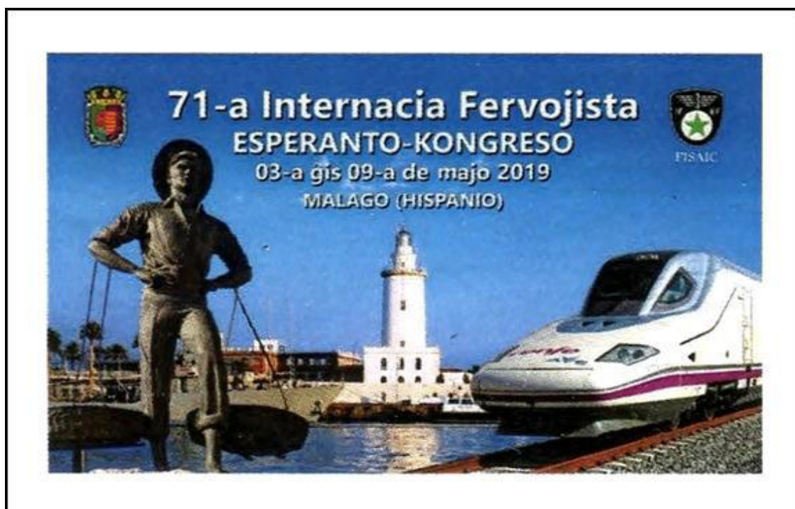
La 71-a kongreso de IFEF okazos de la 03-a ĝis la 09-a de majo 2019 en la hispana urbo Malago Informojn oni povas ricevi de la Hungara Fervojista Esperanto-Asocio