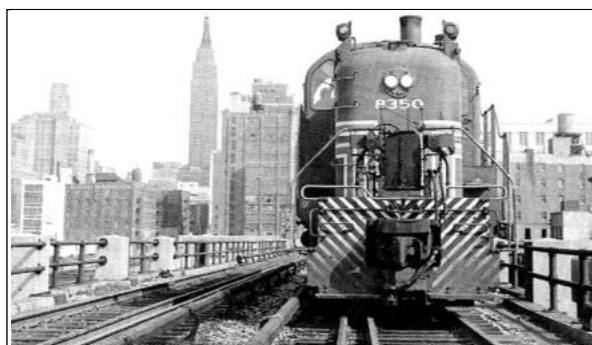
Regula trafiko sur High Line en 1950-aj jaroj

Tiu viadukto, ankaŭ kun branĉtrako al deponejoj, longa ĉirkaŭ 4 km (1,45 mejloj) suprenlevis la ĉi tiean fervojlinion super ŝosean nivelon, kaj eliminis entute 105 trak-nivelajn pasejojn. La projekto estis finance postulema, kaj entutaj kostoj atingis 150 milionojn da tiamaj Dolaroj (en nuntempaj prezoj ĉirkaŭ 2 miliardojn da Dolaroj).