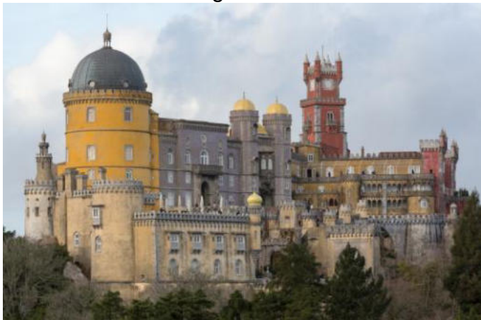
Palaco "Nacional da Rena" en Sintra

Oni parolis pri perspektivoj por la Eŭropa Unio, pri sukcesoj kaj perspektivoj en planedoscienco. La kongresa kuriero TAĴO NIA informis pri ĉiutagaj okazaĵoj.