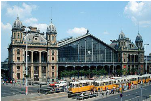
La Okcidenta Stacidomo de Budapeŝto

Antaŭ 150 jaroj – la 1-an de julio 1868 – komencis funkcii la Hungaraj Reĝaj Ŝtatfervojoj. De tiu tempo ni kalkulas la ekzistadon de la ŝtatfervojoj en Hungario.