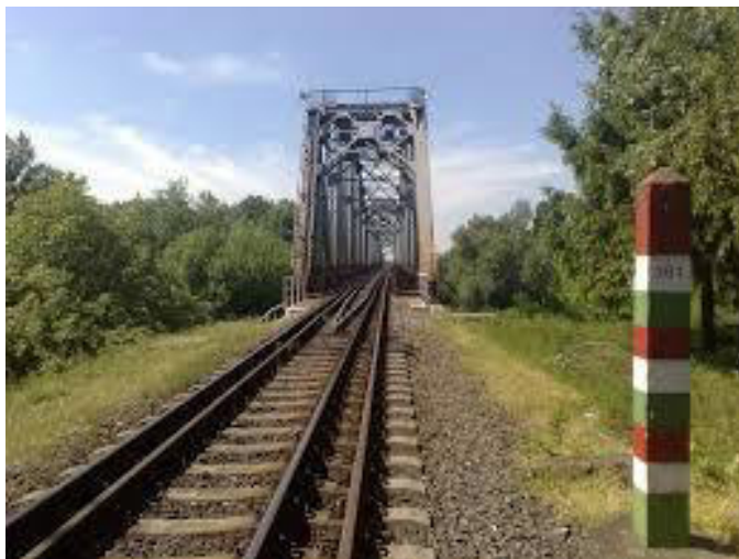
Larĝŝpura kaj normalŝpura fervojlinio ĉe Záhony

Ĉe la 18%-j de la fervojo de la mondo ekzistas t.n. larĝŝpuraj fervojlinioj, kiuj havas 1520 mm-ojn (Rusio, Mongolio Finnlando, Irano), 1600 mm-ojn (Aŭstralio, Brazilo, Irlando),