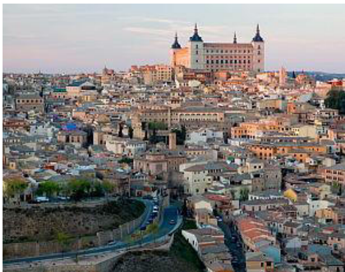
La vidaĵo de urbo Toledo

Ĉe la fino estis prezentata la venonta kongreslando Serbio kaj la urbo Ĉaĉak, kie ILEI kongresos de la 13-a ĝis la 20-a de julio 2019. Poste prezentiĝis nova estraro de ILEI kaj fine oni debatis pri kongresaj konkludoj kaj aliaj aktivaĵoj. Dum la Internacia adiaŭa