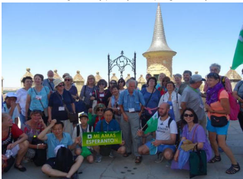
Partoprenantoj de la ekskurso en Segovio

La solena inaŭguro kaj pluraj ILEI programeroj okazis en la fakultato pri humanecaj fakoj