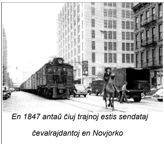
En 1847 antaŭ ĉiuj trajnoj estis sendataj ĉevalrajdantoj en Novjorko