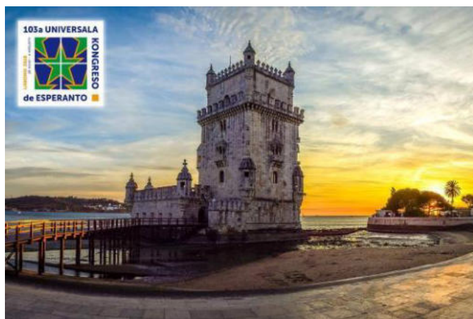
La turo Belém en Lisbono

pro intereso rapide plenigis la koncernatajn salonojn. Dum la tuta kongresdaŭro ni kleriĝis en prelegoj de IKU, ISAE, AIS kaj aliaj. Malfacila estis la elekto inter tiom da programeroj.