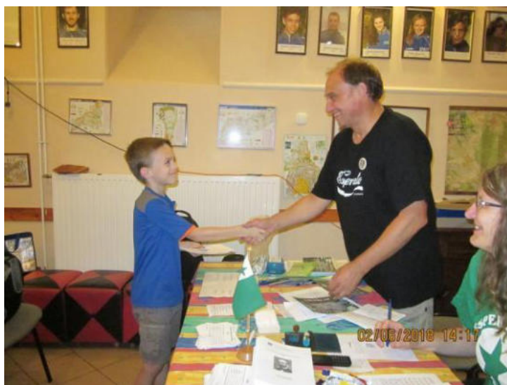
Juna partoprenanto de la memorekskurso

Esperanto kaj al la belvidejo Zamenhof. Tie akceptis la partoprenantojn la „punkto-kontrolisto”, kaj daŭrigante la vojon la ekskursantoj iris al la montokresto „Gubacsi”, de kie estas belega panoramo al la Danubkurbiĝo, al la fortikaĵo de „Visegrád”, al la montaro Pilis kaj al la belvidejo „Nagyvillám”. Estis interesa, ke la pensoj de Zamenhof estis troveblaj en la memorlokoj. La ekskurso finiĝis en la apudrivera urbeto Nagymaros-Visegrád.