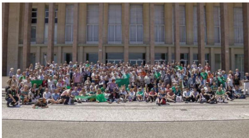
Kongresanoj antaŭ la kongresejo

La kongresa temo estis "Kulturoj, lingvoj, tutmondiĝo": Kien nun? Kiel kutime, la kongresaj programeroj estis superŝarĝitaj je diversaj prelegoj, diskutoj kaj ne eblas en