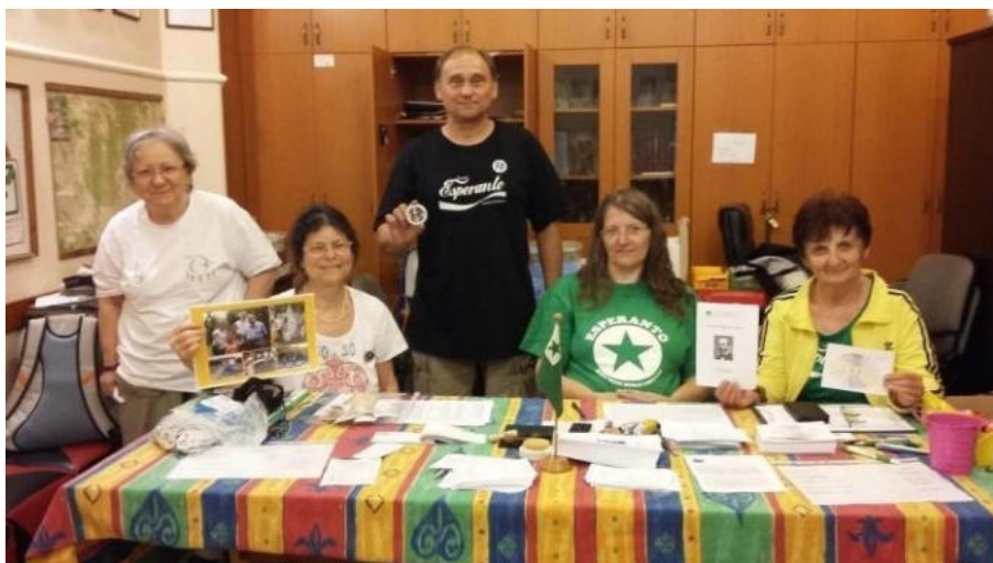
Organizantoj de la memorekskurso

La ekskursvojo konsistis el du etapoj, kiuj estis 11 kaj 33 km-j longaj. La starto okazis en