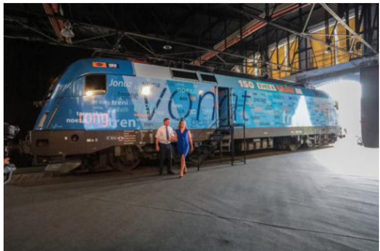
La vorto "Trajno" en 150 ligvoj sur la lokomotivo

La ŝtatigo komenciĝis en 1868 kun la „Hungara Norda” Fervojo (126 km), kaj daŭris en 1876 kun la „Hungara Orienta” Fervojo (603 km), poste sekvis en 1879 la „Vágvölgyi” Fervojo (140 km), en 1880 la „Tiszavidéki” Fervojo (604 km), en 1884 la „Duna-Dráva” Fervojo (165 km), kaj samjare la „Első Erdélyi” Fervojo (290 km), en 1885 la „Alföld-Fiumei” Fervojo (393 km), en 1889 la „Pécs-Barcsi” Fervojo (74 km), ankaŭ en 1889 la „Magyar-Nyugati” Fervojo (304 km), en sama jaro la „Első Magyar Gácsországi” Fervojo (135 km) kaj la „Budapest-Pécs” Fervojo (261 km), poste en 1890 la „Magyar Északkeleti” Fervojo (559 km), en 1891 la hungarlandaj linioj de la „Aŭstra-Hungara Ŝtatfervojo” (1523 km), en sama jaro la „Arad-Temesvár” Fervojo (55 km) kaj fine en 1932 la hungarlandaj linioj de la „Suda Fervojo” (631 km).