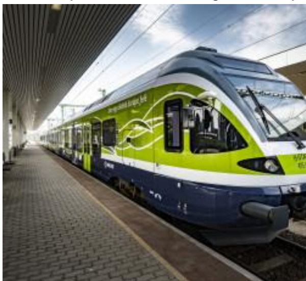
“La verda trajno” de MÁV

Tiu slogano estas la simbolo de la verda kampanjo de la Hungaraj Ŝtatformoj (MÁV), kiu interkroĉas ĝin al la „Eŭropa Jaro de Fervojo”. Laŭ la slogano MÁV prilaboris naturprotektan akcioplanon, laŭ kio oni povas certigi la klimatan neŭtralismon en Hungario ĝis la jaro 2050. Tiu plano helpas la konservadon de la naturheredaĵo, kies unu el la plej gravaj kampoj estas la trafiko. Devas rimarki, ke ne ekzistas moderna trafiko sen moderna fervojo, pro tio nia lando uzas gravajn sumojn al la evoluigo de la ŝpurgvidata transporto. Tiu celo estas ankaŭ en la estonto. En la nuna jaro en Hungario oni transdonos kaj ekfunkciigos kvazaŭ 700 miliardojn da forintoj por grandvaloraj investadoj. Tiu tendenco certigas la efikajn realigojn de la naturprotektanta akcioplano.