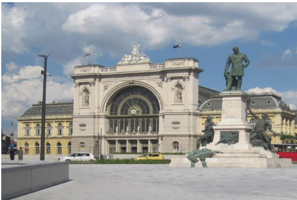
La statuo Baross antaŭ la Orienta Stacidomo