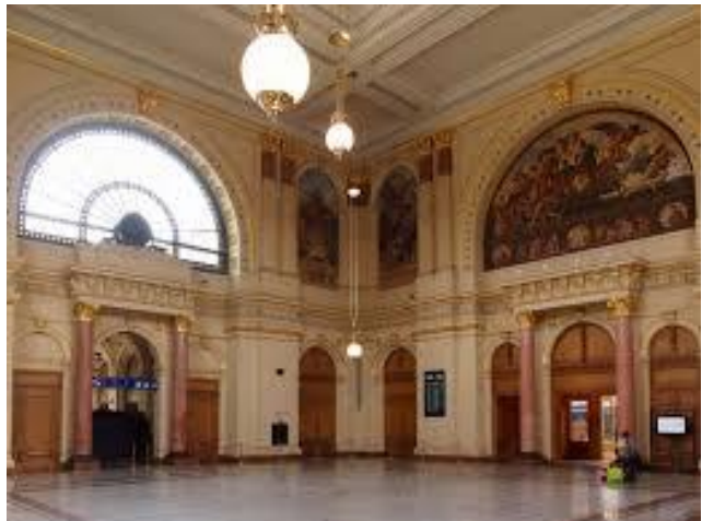
La granda salono kun la freskoj Lotz.

vapormaŝino) kaj Georges Stephenson (la planisto de la vaporlokomotivo „Rocket”). Super ili troveblas en 32 m-j alteco la alegoria statuogrupo. Parto de la fasado de la stacidomo pretiĝis el vitro, sur kio troveblas granda horloĝo kaj kvar statuoj pri famaj homoj. La plej suba parto de la fasado estas la enirejoj al la granda halo. Menciinda estas la elektra lumigo de la konstruo, kiu en tiu tempoperiodo vekis sensacion en la tuta mondo. Tiun lumigon Károly Zipernowsky planis kaj efektivigis. Sepdek arklampoj lumigis la grandan halon, kaj en la oficejoj 644 inkandeskaj lampoj certigis bezonatan lumon. Do la arkitekto estis Gyula Rochlitz, kaj la ŝtalstrukturisto de la granda halo estis János Feketeházy hungara inĝeniero. En la halo konstruiĝis kvar trakoj, kiujn kompletigis kvin trakoj sur la norda parto kaj tri trakoj sur la suda parto de la stacidomo.