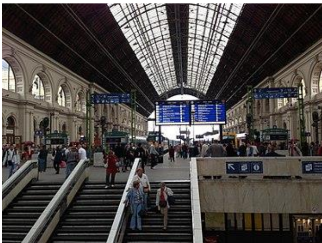
La granda halo kun la LED-signalilo

Poste pro la trafikaj perturboj oni devis konstrui pli novajn trakojn, kion dum la jardekoj oni plilarĝigis eĉ rekonstruis. Pro la malsufiĉa tereno de la stacidomo la rapidan evoluon de la fervoja trafiko oni povis solvi per novaj trakinterligoj.