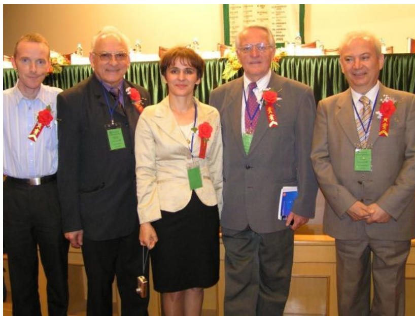
La estraro de IFEF en Činio dum la IFEF-kongreso

de la landaj asocioj oni konstatis, ke la averaĝa aĝo de la membraro altiĝas, kaj ĉiam pli multe da junuloj mankas el la movado. La kulturaj prog-ramoj estis ege interesaj, ĉar ne nur hungaraj ensembloj ĝojigis la parto-prenantojn, sed el Aŭstrio venis la „Tamburizza-grupo” el Horstein prezenti verajn kaj grandsukcesajn aŭstrajn muzikojn kaj dancojn. Inter la hungaraj ensembloj ni ĝuis la programojn de la „Fervo-jista Muziklernejo” el Budapeŝto kaj la „Koruso Egressy” el urbo Tata.