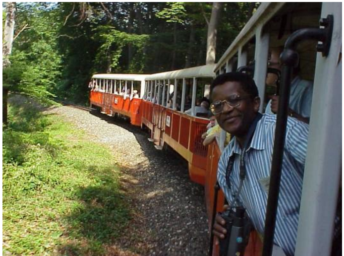
La infanfervojo en Budapeŝto

Ekzistis ĝemelurbaj kontaktoj, en kiuj havis elstarajn rezultojn la membroasocio Tata kun nederlanda kaj germana urboj, kaj la fakgrupo Zalaegerszeg kun slovenaj urboj. La fakgrupo Szombathely regule partoprenis en la agado de Alp-Adria. La membroasocio Miskolc jam de multaj jaroj organizis karavanajn ekskursojn parte en Hungario, parte en diversaj landoj, bone servante la amikecon, interesiĝon eĉ propagandon por Esperanto. La fakgrupo Kelebia-Kiskunhalas klopodis propagandcele meti sur la muro de la stacidomoj Kelebia kaj Kiskunhalas murgazeton kun multaj koloraj bildoj kaj informoj ĉefe pri la IFEF-kongresoj. Ekzemplodone agadis la membroasocio Tata, kiu organizis urban „Egressy Ĥoron”, kiu multe rolis en Esperanto-aranĝoj eĉ ankaŭ eksterlande. La alia aktiveco de Tata estis la establo de la „Belarta Societo”, kiu aranĝis altnivelajn ekspoziciojn dise en la lando eĉ eksterlande. Verŝajne ĝi estas la unusola „Esperantista Belarta Societo” de la mondo. Grave estas, ke la fakgrupo Pécs grandsukcese organizis kelkajn Landan Ami-kan Fervojistan Renkontiĝon eĉ IFEF-kongreson. La fakgrupo Zalaeger-szeg komune kun la urba Esperanto-grupo pretigis multajn esperantajn broŝurojn kaj aliaj esperantaĵojn.