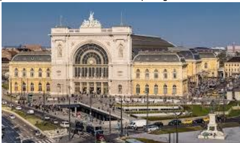
La stacidomo el la direkto de la placo Baross

La evoluigo de la stacidomo daŭras. En la granda halo en marto de ĉi tiu jaro komenciĝis la konstruo de la nova pasaĝercentro. Kadre de tiu konstruo jam pretiĝis la malkonstruoj de la malnovaj ŝtuparoj, la kaso kaj kelkaj muroj. Komenciĝis la fundamentaj laboroj kaj la konstruo de la tenilaj muroj. La investado kostas pli ol 1,6 miliardojn da Forintoj, kion la hungara registaro kaj la Eŭropa Unio komune financas. Tiun pasaĝercentron oni konstruas sub la peronnivelo, kaj havos pli ol 1540 m 2 -jn. Ĉi tie efektiviĝos klientarservo sur 250 m 2 -j, naŭ biletgiĉetoj, oficejo por la fervoja live-radvendo. La internajn murojn, eĉ la intertegmentojn oni konstruos el vitro. Inter la peronnivelo kaj la pasaĝercentro konstruiĝas lifto kaj ankaŭ movŝtuparo. La konstruado finiĝos atendeble en la fino de la kuranta jaro.