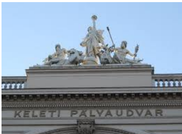
Alegoria statuogrupo sur la tegmento

Baross oni translokis la statuon al la norda parto de la granda halo, kaj en 2013 denove oni starigis ĝin sur la originalan lokon.