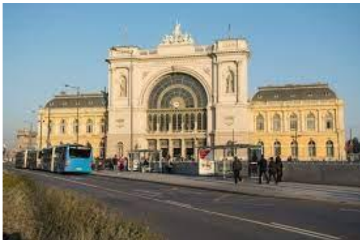
La fasado de la Orienta Stacidomo

La Orienta Stacidomo estas la plej frekventata pasaĝerstacio en Budapeŝto. La stacio estas deirpunkto de kvar ĉeflinioj: Budapeŝto – Győr – Vieno (1-a linio), Budapeŝto – Hatvan – Miskolc (80-a linio), Budapeŝto – Szolnok – Békéscsaba – Arad (120-a linio) kaj Budapeŝto – Kelebia – Beogrado (150-a linio,). La stacio estas ankoraŭ la start- kaj finstacio de la plej multaj enlandaj InterCity trajnoj, respektive ĝi estas la plej grava internacia fervojnodo en Hungario.