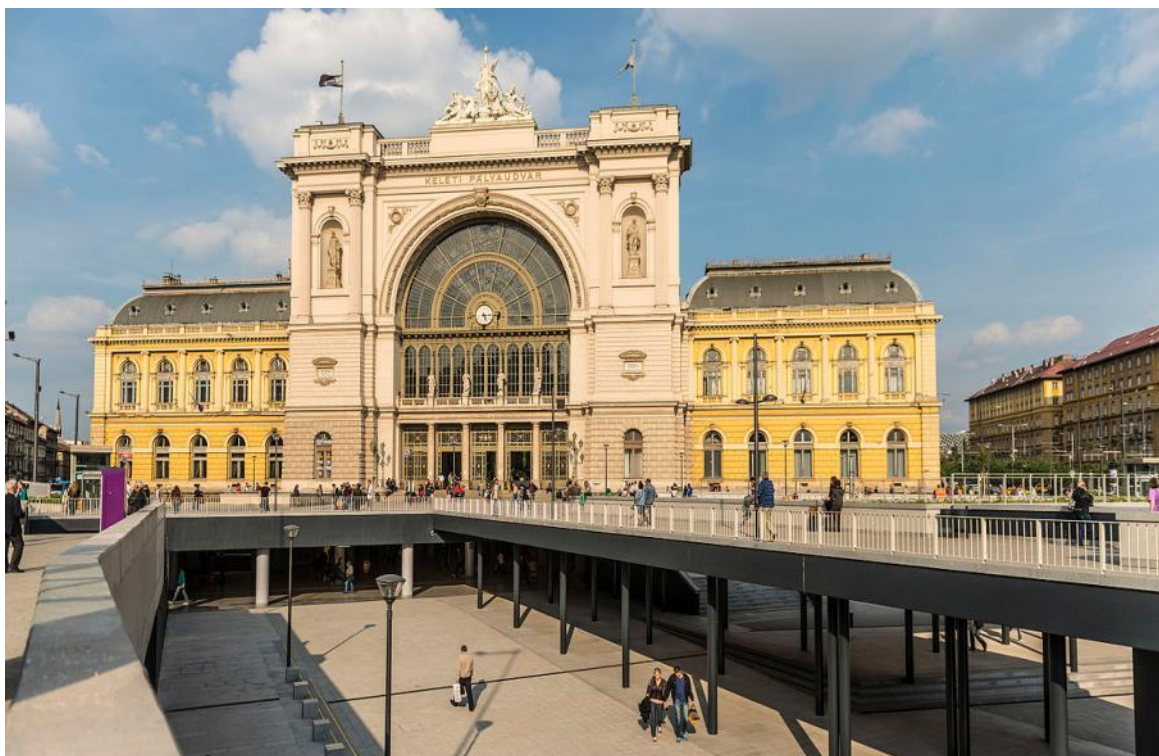
La Orienta Stacidomo en Budapeŝto