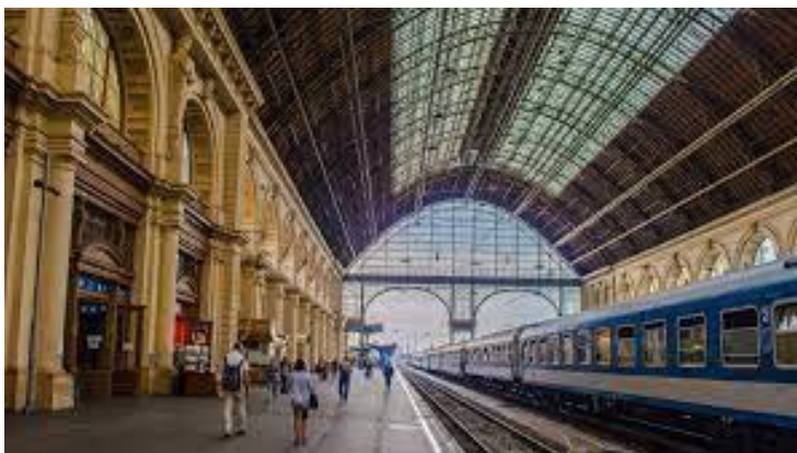
La granda halo de la stacidomo

La efektivigo de la konstruado de la stacidomo komenciĝis en 1881 kaj finiĝis en 1884. Tiu stacidomo estis la plej moderna stacidomo en Eŭropo en tiu tempoperiodo. Dum la fundamentaj laboroj okazigis malagrablan surprizon la malstreĉa marĉa tero, pro tio tiuj fundamentaj laboroj bezonis longdaŭrajn kaj multekostajn fostofundamentajn laborojn. Kiel en Venecio en Italio ankaŭ ĉe la konstruado de la Orienta Stacidomo tiuj fostoj transportis la ŝarĝon de la konstruadoj al la ŝarĝkapabla subgrundo. Oni uzis cedroarbajn fostojn, ĉar tiuj lignoj fosiliĝis kaj fariĝis tempreziston. La fostofundamentan laboron planis kaj direktis per granda faksperteco la norvega Gregersen Guilbrand. En la fino de la sesdekaj jaroj en la pasinta jarcento konstruiĝis la M2 metrolinio sub la stacidomo, kaj en la komenco de la jaro 2010 konstruiĝis la M4 metrolinio ankaŭ tie, kiam la konstruistoj trovis tiujn fostojn en plena konservado.