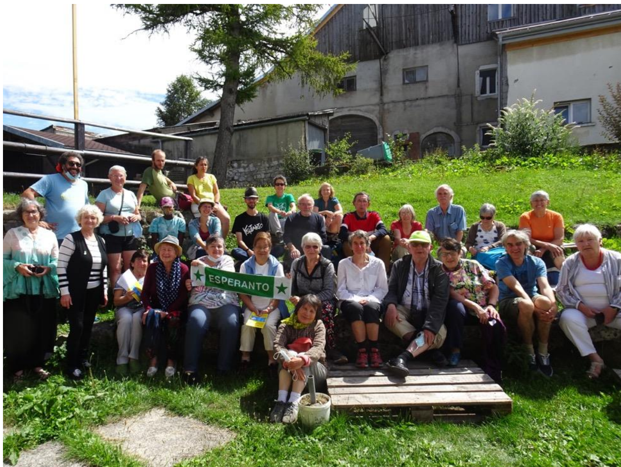
Partoprenantoj en la staĝo