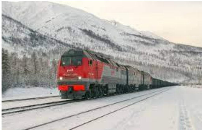
Vartrajno sur la BAM-fervojlinio ie en Siberio

duŝpurajn trakojn, radaks-ŝanĝejon, plusajn parktrakarojn, modernajn vagonlavinstalaĵojn, vagonriparejon, eĉ logistikajn kaj administrajn establaĵojn, fervojan industrian parkon, helpopretajn fervojistajn kaj ĉion, kio ankoraŭ estas bezonata por moderna kaj grandkapacita fervojstacio. Grava vidpunkto estas, ke la realigo de la projekto bezonas aliajn liveradojn, kiuj donas multajn novajn laborejojn por la homoj de tiu teritorio.