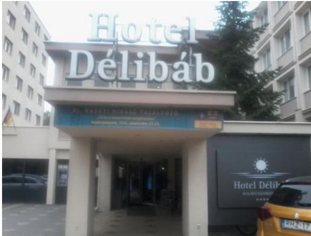
Fig. 1 La loko de la renkontiĝo

La renkontiĝon de la fervojaj pontistoj oni aranĝis jam 11-a foje, ĉi-okaze la 22-23-an de septembro 2021, en la fama banloko Hajdúszoboszló , laŭ komuna organizado de Fonduso „Fervojaj Pontoj” kaj Hungara Inĝeniera Ĉambro. La slogano de la renkontiĝo estis: „25 jaroj en la servo de fervojaj pontoj”. Por la aranĝaĵo donis hejmon la kvarstela Hotel Délibáb (Hotelo Miraĝo). (Fig. 1)