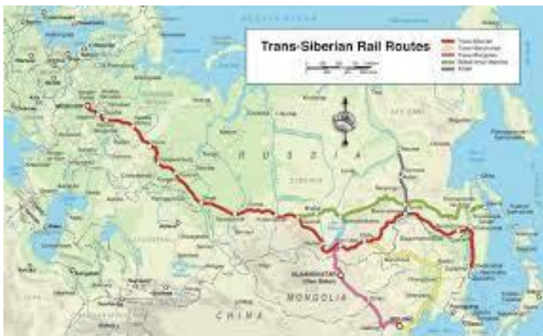
La Trans-Siberia (BAM) fervojlinio

„Stopiĝis la Nova Silkvojo” – mi legas sur la ekrano de mia komputilo. Tiu surprizita sciigo montras la realan situacion en la Ekstrema Oriento, ĉefe en Ĉinio, de kie multaj komercaĵoj atendas la transportadon al Eŭropo. Laŭ tio Ĉinio devas refoje pripensi la ekspedan praktikon. La ĉina transporta procezo kaj la ekonomia fundo