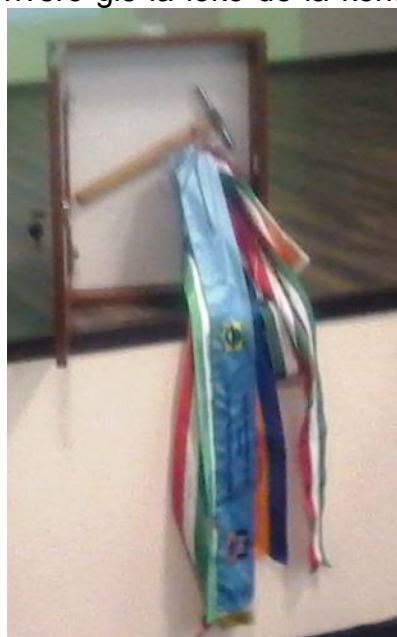
Fig. 3 La migra martelo

je 24 transport-unuoj. El ili kvar estis kargitaj sur barĝojn speciale formitajn, kaj tie La ŝtalan pontostrukturon oni produktis sur insulo Csepel. Laŭ longa direkto la ponto estis oni kunveldis ilin. Tiel formiĝis unu levo-unuo, kiun oni trenis kun la barĝo sur la rivero ĝis la loko de la konstruado. Ĉar por la levado ne eblis uzi grupon, pro tio oni devis projekti kaj konstrui specialan levinstalaĵon, levi la