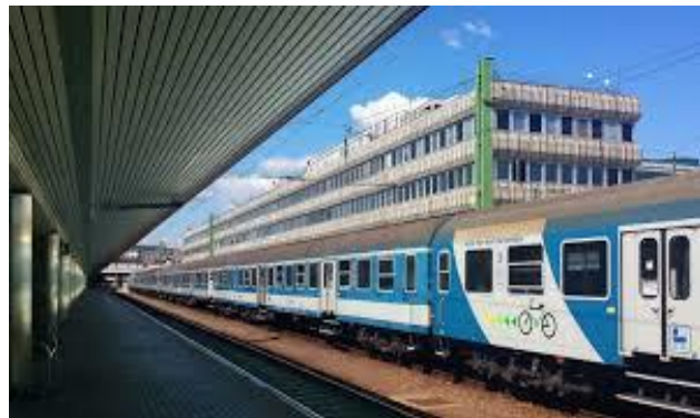
La multifunkcia konstruaĵo en la fono

En la lastaj jardekoj aperis multaj imagoj pri la ĉesigo, translokigo, ambiciaj rekonstruoj de la Suda Stacidomo. Laŭ tiuj imagoj la funkciojn de la Suda Stacidomo transprenus la fervojstacio Kelenföld. Laŭ la alia imago la tutan stacion oni kovrus, kaj sur tiu kovrado oni konstruus multajn konstruaĵojn.