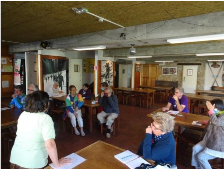
Dum la prezentado

En la "Domo de la rezervejo" sur areo je 500 m 2 estas instalitaj interagaj ekspozicioj dediĉitaj al faŭno kaj flaŭro de la ĵurasa montaro. En proksimeco oni povas promeni