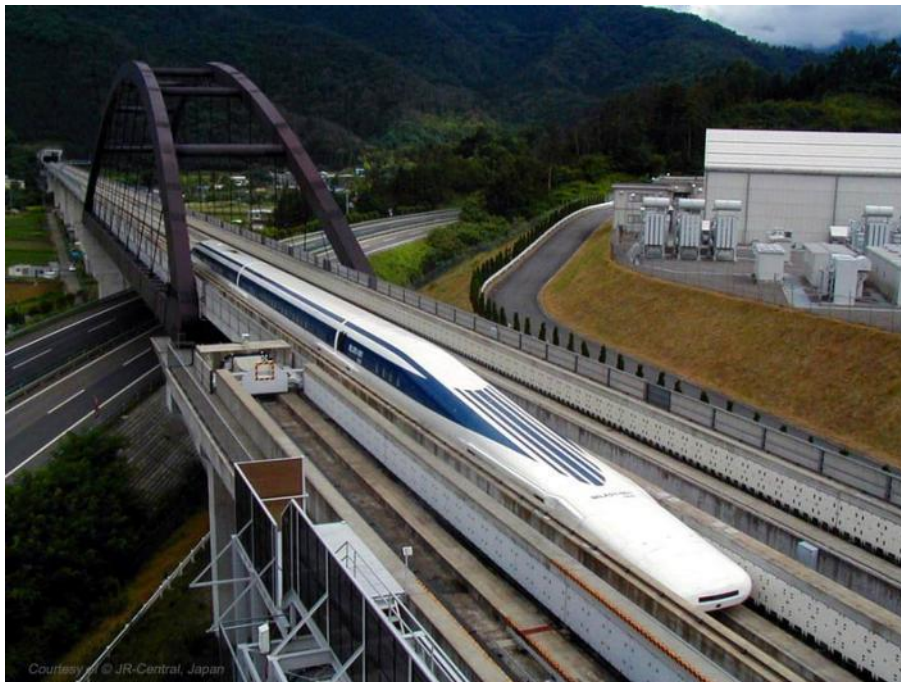
La LO-Maglev trajno en provveturo en Japanio

La evoluigo de la magnetŝvebaj trajnoj komenciĝis jam en la sepdekaj jaroj de la XX jarcento. Ekde tiam en multaj landoj progresas la eksperimentoj, kaj la plej