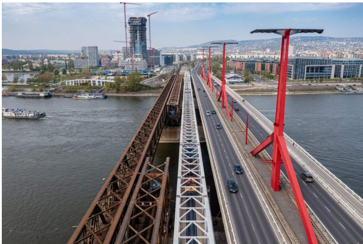
Fig.2. La unua ponto jam estas preta, oni malkonstruas la duan

de la ĉeftraboj estas 49,26+4 \times 98,52+49,26 m. La alto de la pontostrukturo estas 8 m, la aksodistanco de la ĉeftraboj estas 5,2 m. La ŝtalan pontostrukturon oni produktis sur insulo Csepel. Laŭ longa direkto la ponto estis dividita