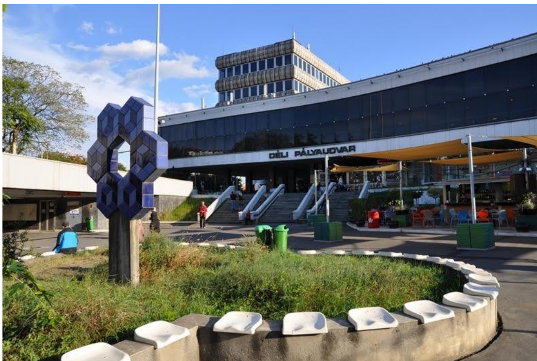
La Suda Stacidomo en Budapeŝto