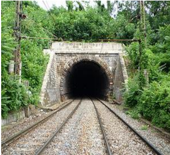
La suda bordego de la tunelo

Tiujn arkitekturajn establaĵojn en 1861 oni jam ne opiniis elstaraj konstruaĵoj, nur eble la 361,8 metrojn longan tunelon opiniis tiel. Tiu tunelo konstruiĝis sub la monto Gellért, kiu estis la dua tunelo en la hungarlanda fervoja historio. La stacidomo ekde la jaro 1883 ricevis oficiale la nomon „Suda Stacidomo” post la unuiĝo de Buda, Pest kaj Óbuda.