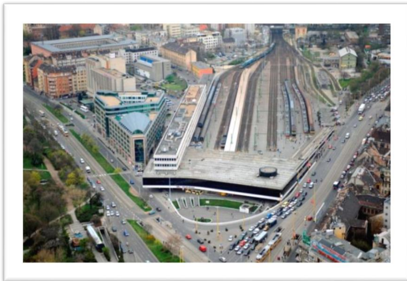
La Suda Stacidomo el flugperspektivo

La Suda Stacidomo estas unu el la plej gravaj stacidomoj de Budapeŝto kune kun la Orienta Stacidomo, Okcidenta Stacidomo kaj Kelenföld Fervojstacio. La profesia trafiko estas grava dum la tuta jaro, la refreŝigaj trafikoj somere kreas grandan trafikon al la lagoj Balatono kaj Velence. Ĉiutage meznombro 250 trajnoj trafikis en la Suda Stacidomo. Tiuj trajnoj