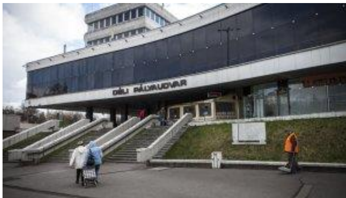
Unu el la enirejoj de la Suda Stacidomo

La konstruon de la Suda Stacidomo anticipis longaj debatoj en la dudekaj kaj tridekaj jaroj de la XIX jarcento. Ties kaŭzo estis, ke la ideo de la fervojkonstruo devenis el Grafo István Széchenyi, kiu jam en la jaro 1820, kaj poste en 1848 kiel trafika ministro proponis la primaran konstruon de transdanubia fervojlinio, kaj samtempe konstrui la Sudan Stacidomon de tiu fervojlinio. Laŭ tiuj proponoj la konstruo de la stacidomo komenciĝis en septembro 1859, kaj malfermiĝis en aprilo 1861 kiel la finstacio de la Buda – Kanizsa fervoja linio. La stacidomon oni nomis „Buda Stacidomo”, kiu estis la antaŭulo de la nuna Suda Stacidomo. La stacidomon funkciigis la „Déli Vasút” (Suda Fervojo) Trafika Societo, kaj tiu societo funkciigis ankaŭ aliajn gravajn fervojliniojn en la landparto Transdanubio.