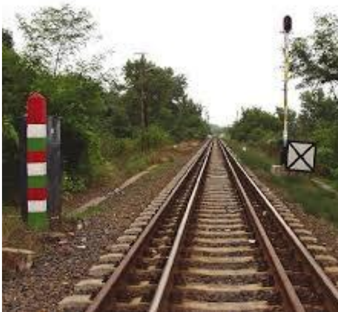
Larĝa kaj normala trako en Záhony

La ĉina vivkoncepto diferencas de la eŭropanoj, pro tio la ĉinoj serĉas tiujn partnerojn kiuj bone konas la impostadajn kadrojn kaj eblecojn. Tiujn pretendojn la nunaj partneroj en Záhony (CELIZ konzorcio) bone povas kontentigi. La funkciigo de Záhony jam rolas en la elstara kunlaboranta partnero de la ĉina ŝtata entrepreno CRRC (China National Railway Locomotive & Rolling Stock Industry Corporation), kaj la ĉina ŝtata fervojentrepreno CRSC (China Railway Signal and Communication