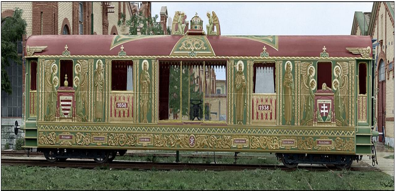
La „Ora Vagono” en la Hungara Fervojuhistoria Parko