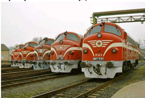
Vohaboj en la stacidomo Budapeŝt-Ferencváros

La dizellokomotivoj Nohab havas sesdek jaraĝojn, ĉar la fabrikado de la sveda „stalmiraklo” komenciĝis en jaro 1963. Tiuj lokomotivoj ricevis la identigan numeron M61, kaj tiam enfokusiĝis la aĉetado de tiu lokomotivo en Hungario, kiam la vaportrakcio komenciĝis regresi. MÁV planis evoluigi la dizelizadon kaj elektrizadon, kaj al ĉi tio estis bezonata novaj grandpovumaj dizellokomotivoj. Ĉar en tiuj jaroj ankoraŭ nur kelkaj fervojlinioj estis elektrizitaj, pro tio aĉetado de elektraj lokomotivoj ne estis aktualaj.