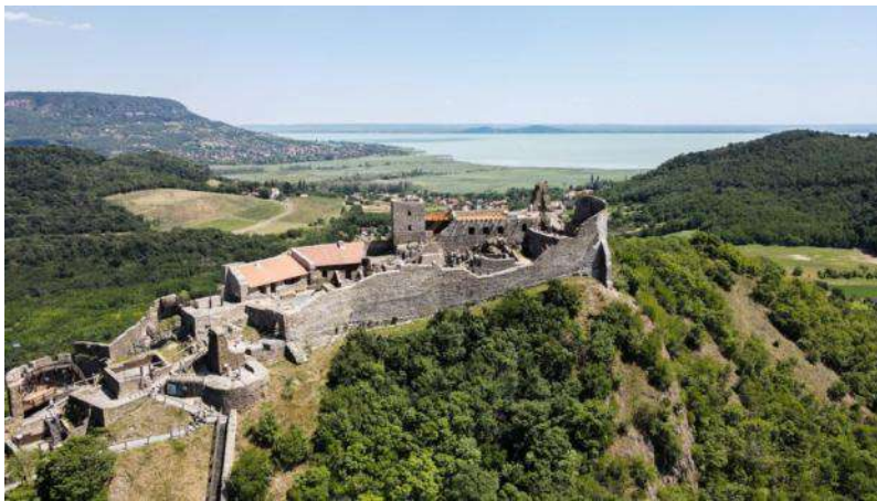
La fortikaĵo Szigliget

La fortikaĵruinoj same apartenas al la balatona pejzaĝo kiel la vinberoj, premildomoj, somerdomoj aŭ kapeloj. Kelkaj ruinoj restis kiel ŝtonamaso, aliajn la turistoj povas vizitadi kaj ĉirkaŭiri, ĉar tiujn ruinojn oni renovigis. Multaj fortikaĵoj troveblas en la Altlando de la Balatono, eĉ ankaŭ ĉe la suda parto de la lago troveblas kelkaj fortikaĵoj. Kelkajn fortikaĵojn mi iomete detale prezentas, kaj la aliajn mi nur denombros.