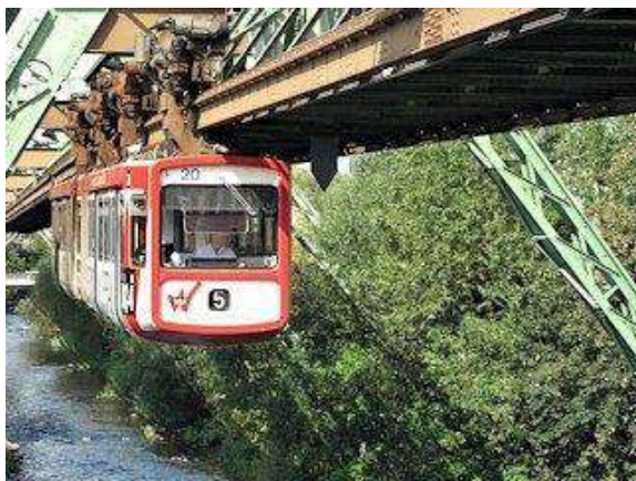
La Wuppertala telfero

Tiu unurela fervojo troveblas en urbo Wuppertal. La malvasta Rivero Wupper fluas tra serpentuma valo, kie estis kelkaj malgrandaj industriaj urboj, kiujn kunligis tiu telfero jam en 1901. Tiu telfero pogrande helpis la evoluadon de tiuj industriaj urboj, kaj en jaro 1929 ili kuniĝis kun la urbo Wuppertal. Tiu telfero estas la spino de la pasaĝertransporta reto en la urba trafiko. La traceado de la telfero sekvas la vojkurbojn de la rivero, kaj alte kondukas super la