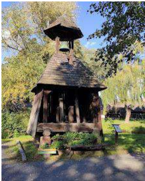
„Göcsei” Vilaĝmuzeo (Sonorilstablo)

Apud la urbo Zalaegerszeg oni elformis imageblan vilaĝon, kie oni konstruis kvardek