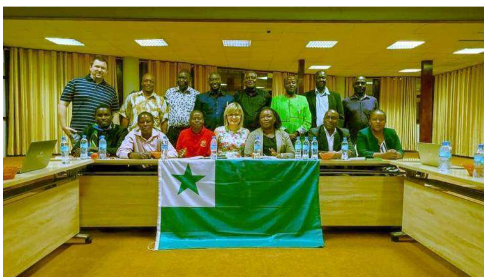
Esperantistoj el Tanzanio en la 108-a UK. En Tanzanio okazos la 109-a UK en 2024.