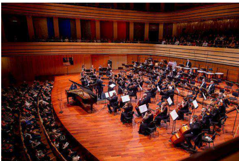
La MÁV Simfonia Orkestro koncertas en la Muzika Akademio

esperon kaj kuraĝon al la koroj por la rekomencado. Li efektivigis specialan fervojan vagonaron, en kiu formigis dormkupeon por la muzikistoj, kaj en alia vagono oni lokigis la muzikinstrumentojn. Per tiuj vagonoj vojaĝis la orkestro en la tuta lando, kaj donis koncertojn en multaj hungaraj urboj. Komence la orkestro konsistis el amatoraj muzikistoj kaj el la blovorkestroj de MÁV, sed poste ĝi iĝis oficiala grandorkestro. La unua dirigento estis Szóke Tibor, kiu formis veran simfonian kompanion el la amatoraj muzikistoj. Dum la paso de la tempo kuniĝis novaj altinstruitaj muzikistoj al la orkestro.