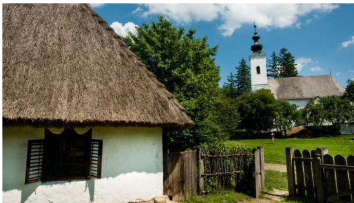
"Szennai" Subĉiela Etnografia Muzeo

La kuriozaĵo de tiu skanseno estas, ke oni elformis ĝin en la mezo de la vivanta samloka vilaĝo. Pro tio la skanseno ricevis „Eŭropa Nostra” internacian premion. Ĝi prezentas la arkitekturon kaj la tradicion de la naturparko „Zselic”, kaj multaj kulturaj programoj atendas la vizitantojn. Multfoje okazas dancaj amuzoj kaj metiistaj okupiĝoj. Al la skanseno apartenas la barokstila preĝejo, konstruita en 1785, kiu staras sub protekto pro la karakterizaj kasonoj de la plafono. La skanseno estas fama pro la planddomoj, kiujn entuziasmajn vilaĝanoj transportis el la Sud-