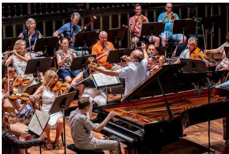
La provo de la orkestro en la provĉambrego

La orkestro regule kunlaboras kun la Budapeŝta Printempa Festivalo, la Miŝkolca Internacia Operfestivalo, la Budapeŝta Festivalorkestro, la Filharmonia Orkestro en Budapeŝto. La orkestro koncertas en Hungario ne nur en Budapeŝto, sed ankaŭ en la provincaj urboj. La granda artista sciado estas rekonata en la tuta mondo per la internaciaj gastroj. La orkestro jam koncertis preskaŭ en ĉiuj eŭropaj landoj, krome en