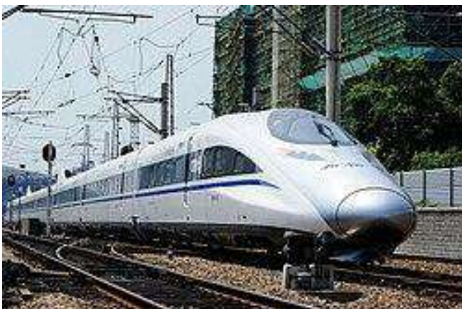
La grandrapida trajno en Ĉinio

La Ĉina Radio Internacia sciigis gravan novaĵon pri la neimagebla plano de la Ĉina Fervojo. Laŭ tio la Ĉina Fervojo planas konstrui pli ol 3.000 km-jn da fervojoj en la jaro 2023, inkluzive de 2.500 km-jn da rapidegaj fervojlinioj por altgradigi la transportan sistemon en progresintan reton. Se ni ekzamenas la statistikajn indikojn pri la ĉina fervojreto, ni devas kredi, ke tiun planon la ĉinoj efektiviĝas. Laŭ mia informo en la unua duonjaro la granda parto de la plano jam efektiviĝis.