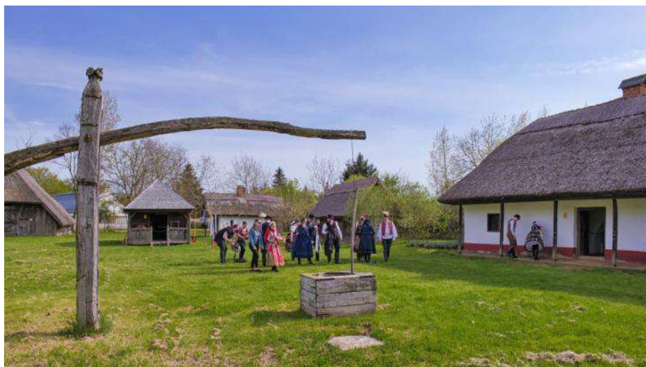
La korto de la "Sóstói" Skanseno.