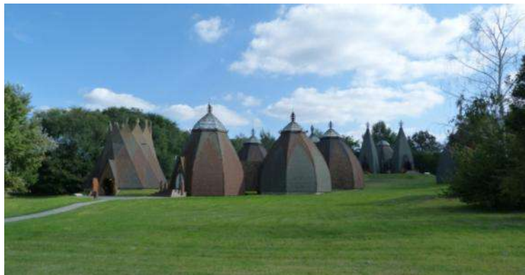
„Ópusztaszeri” Subĉiela Etnografia Muzeo („Csete”-jurtoj)

ĉiĝas al la Nacia Historia Memorparko. Tiel videblas en la ronda vizitanta centro, „Rotunda” la „Feszty-rondpentraĵo”, kies titolo estas „Enpatrujiĝo de la hungaroj”. Okazas multaj interaktivaj kaj hidrologiaj ekspozicioj. Inter la eksteraj vidindaĵoj oni povas rigardi la nomadan parkon, ruinan ĝardenon, kronan jurton kaj la kuriozformajn „Csete”-jurtojn. Komune kun la Nacia Historia Memorparko la skanseno organizas multajn eventoseriojn, inter alie rajdospektaklojn.