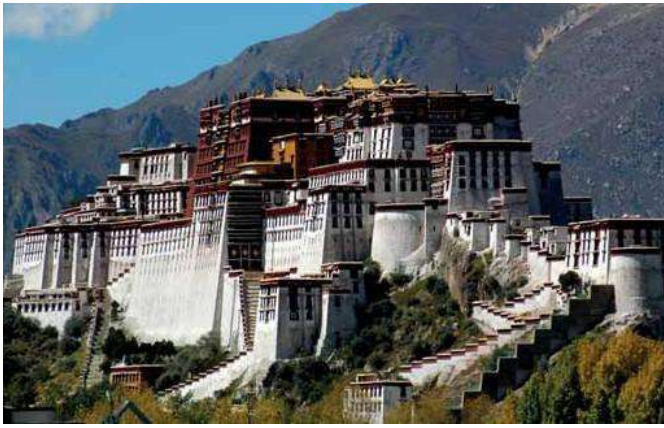
La "Potala Palaco" en Lhasza

La konstruo de la Csinghaj – Lhasza (Tibeto) fervojlinio komenciĝis en la jaro 2001, kaj dum 5 jaroj ĝi konstruiĝis, kio estis giganta plenumo. La longo de la linio estas 1142 km-j, el kiu konstruiĝis 960 km-jn super la marnivelo pli ol 4000 m altecoj. La plej alta stacio de tiu fervojlinio estas Tang Gu-la, kiu konstruiĝis sur 5068 metrojn alta. La kostoj de la konstruo estis 3,3 miliardojn da Eŭroj.