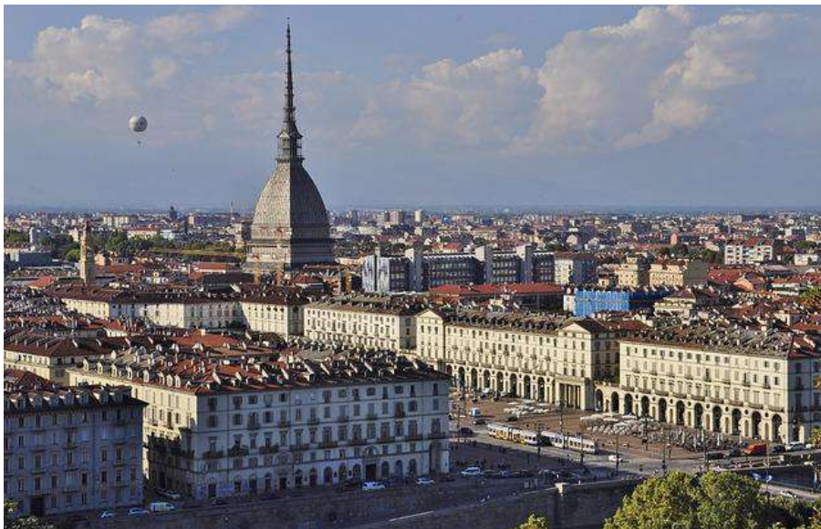
La kongresurbo Torino

En Torino jam okazis pluraj Esperanto-kongresoj. Ĉi-foje la kongresejo situis en la