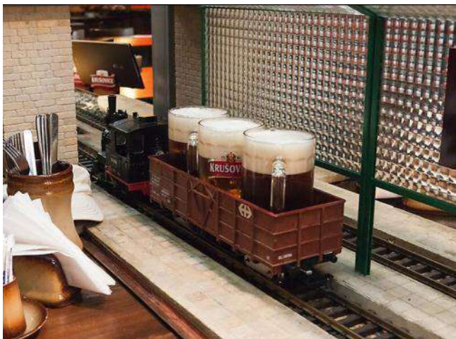
Vojaĝas la bieroj al la gastoj

deflankiĝon. Tiu fervojreto estas iomete komplika, ĉar la posedantoj devis efektivigi dum kelkaj jaroj tiun interesan planon. La trajnoj traveturas arbaran kaj rokan regionon, kaj klakadas tra tuneloj kaj pontoj, por ke ili povu transporti la bieron al la gastoj. Okaze de la iama estrarkunsido de IFEF, la estraranoj kaj la ĉeĥaj kolegoj vizitis tiun restoracion, kaj ni trinkis pere de la vagonoj kunportitajn bierojn. Ni ege ĝuis la viziton, ĉefe la bongustan bieron.