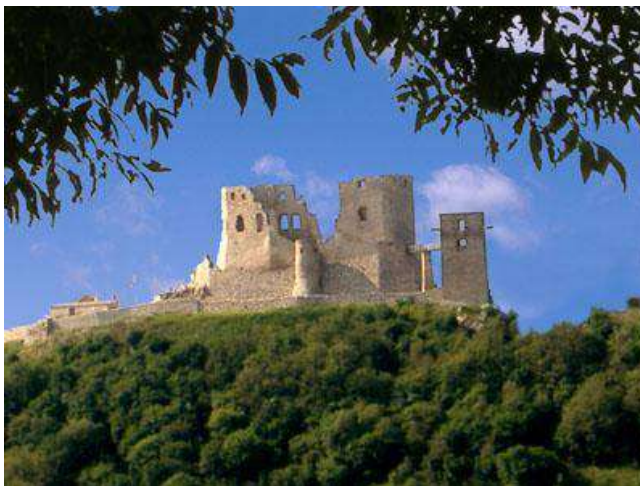
La fortikaĵo Csesznek

La vilaĝo Csesznek troveblas en la norda parto de la montaro Bakony, kiun sorĉigas la harmonioj de la valoj, altplataĵoj, montoj kaj riveretoj. Apud la vilaĝo estas sur elstariĝa kruta roko la 700-jara belega fortikaĵo Csesznek, kiu estas la plej vidinda fortikaĵruino de la montaro Bakony, kaj apartenas al la plej belaj ekskursejoj de la lando. La unuaj skribaj fontoj mencias en la XIII-a jarcento la csesznekan fortikaĵon, kiun konstruigis Cseszneki Jakab. Poste la fortikaĵon oni alikonstruigis, per kio ĝi iĝis impona kavalira kastelo. Dum la jarcentoj la fortikaĵo plurfoje ŝanĝis posedantojn. En la periodo de la turkoj la fortikaĵo iĝis limfortreso, kaj ĝi