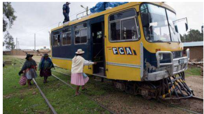
La Ferrobús kaj la vojaĝantoj

el karoserio de malnovaj ŝoseaj veturiloj kaj fervojaj radoj. Tiuj malstabilaj veturiloj signifas por la malproksimaj montaj vilaĝoj veran savrimedon, kiuj tute ne havas oficialajn koneksajn vojojn. La ferrobúsoj uzas la forlasitajn fervojliniojn, kiujn oni konstruis en la 19-a jarcentoj al la minado de la mineralriĉaĵo. La fervojliniojn de la ferrobúso oni povas trovi en Cilio, Bolivio kaj Kolombio inter la montopintoj de la montaro Andoj. La ferrobúso estas populara por la turistoj, kiuj serĉas la danĝerajn veturadojn kaj la nekonatajn travivaĵojn. Bolivio estas la citadelo de la ferrobúso, kie sur tri fervojlinioj trafikis tiuj busoj. La vojaĝo per ferrobúso estas harstariga travivaĵo, kaj memorinda evento.