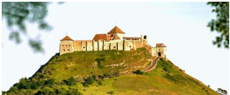
La fortikaĵo Sümeg

La alia fortikaĵo estas Sümeg , kie „la historio revivigas”. La fortikaĵo altiĝas sur la monteto de la urbeto Sümeg, kiu regas la pejzaĝon kaj altiras la rigardon. En la murego troveblas multaj bastionoj. Ĝi estas unu el la plej belaj mezepokaj fortikaĵoj, kiu restis en konservita. En la fortikaĵo oni gardas la