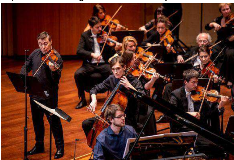
La violonistoj dum la koncerto

La hungaraj fervojistaj esperantistoj antaŭ kelkaj jardekoj havis jarajn abonbiletojn al la koncertoj de la MÁV Simfonia Orkestro. Ni ĉiuj ege ĝuis la altnivelajn koncertojn, pri kio aperis artikolo en nia faka revuo Hungara Fervojista Mondo.