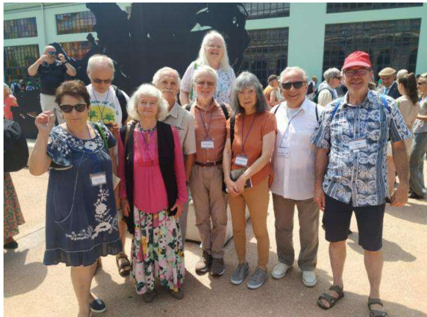
Fervojistaj esperantistoj dum la kongreso

En la vestiblo estis instalita libroservo. Tie eblis aĉeti librojn donace por Tanzanio, sed ne nur. Samloke okazis aŭtoraj duonhoraj prezentadoj de diversaj libroj. Kiel kutime okazis ankaŭ Esperanto-kursoj kaj ERR-ekzamenoj de ĉiuj niveloj. Aperis pluraj artikoloj en ĵurnaloj. Dum la kongreso prezentiĝis pluraj asocioj. Okazis Ekumena Diservo, Erasmus+, TEJO sinprezentas, Internacia Koruso, Ŭombulismo, Bona Espero, Belartaj Konkursoj, Oratora Konkurso, UNO kaj UNESKO, prelegoj pri Italio, itala lingvo, Meditado, Vortludoj, Afriko, Eŭropo, Ameriko, Juristoj, Esperantologia Konferenco, Libroj de la jaro, Bobelarto, Komitata Forumo, Ateliero pri origamio. La Kongresa Kuriero „La Taŭra voĉo” informis pri aktualaĵoj kaj ŝanĝoj en la programo. En la korto esperantistoj ne nur dancis, sed ankaŭ ludlernis. Multnombraj estis duontagaj kaj tuttagaj ekskursoj al interesaj lokoj de la lando, kiuj allogis ĉiutage multajn parto-