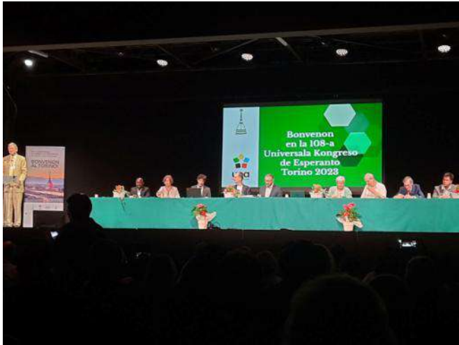
La prezidio de la kongreso dum la inaŭguro