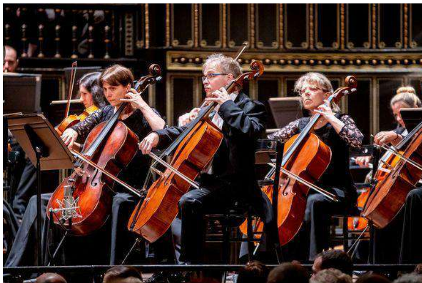
La muzikistoj dum la koncerto

La orkestron komandis multaj famaj dirigentoj, nur kelkaj nomoj el inter la eminentaj artistoj: Kurt Masur, Ferencsik János, Kodály Zoltán, Rózsa Miklós, Lamberto Gardelli, Franco