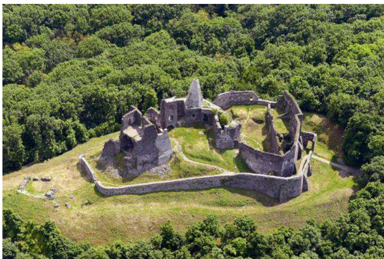
La fortikaĵo Somló

la fortikaĵo. Tiu fortikaĵo konstruiĝis sur vulkana konuso. La fortikaĵon antaŭlonge oni povis malfacile alproksimigi, ĉar antaŭ la enirejo estas okmetra seka foŝaĝo. La plandeseĝo de la fortikaĵo estas senregula, kaj havas internajn turojn kaj kelkajn kortojn. Sur la fendego transkondukas levponto, kiu sendifekte restis dum la