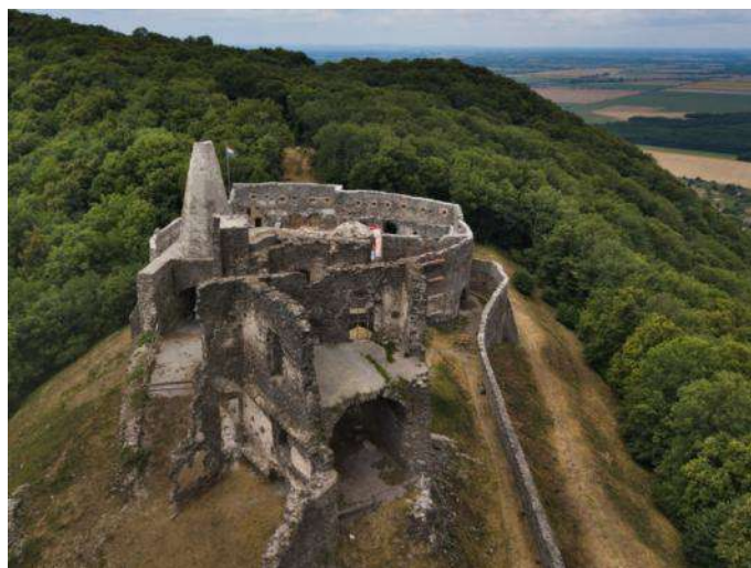
La fortikaĵo Rezi

La fortikaĵo konstruiĝis en la fino de la 1200-aj jaroj, kiun la skribaj dokumentoj unue menciis en jaro 1333. Kiel ĉiujn fortikaĵojn dum la jarcentoj posedis multaj riĉaj aristokratoj kaj reĝoj, ankaŭ la sorto de la fortikaĵo Rezi estis sama. En la 1580-aj jaroj la fortikaĵon aĉetis la familio Pethő, sed la reordigaj laboroj elĉerpiĝis la resursojn de la familio, kaj la familio parte faligis la fortikaĵon. Tiam pereis du turoj kaj la granda parto de la muregoj. Poste la familio Festetics aĉetis la ruinan fortikaĵon, sed ĝi plu detruigis. En