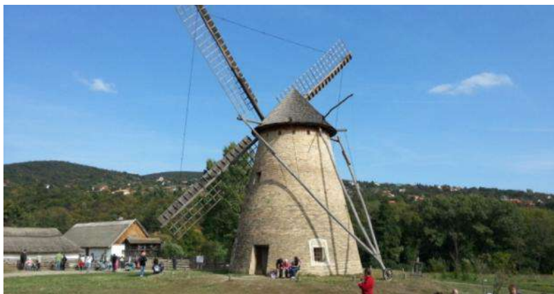
"Szentendrej" Subĉiela Etnografia Muzeo (Ventmuelilo)

Alvenis la aŭtuno, kiu estas la tempo de la ekskursoj. Unu el la plej interesaj ekskursaj programoj estas la vizitoj al la skansenoj, kaj tie oni povas konatiĝi kun la plurjarcentaj popolaj arkitekturoj, mastrumoj kaj vivmanieroj. En la skansenoj la