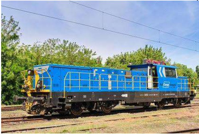
La elektra manovra lokomotivo

La „Rail Cargo Hungaria” mendis elektran manovran lokomotivon de la ĉina „CRRG Group”, kiu estas la plej granda fervoja veturilfabrikado en la mondo. La evoluigitan lokomotivon la ĉinoj prezentis en Hungario, kiu rikoltis grandan sukceson. La amaso de la lokomotivo estas 74 tunoj, ĝia teĥnologio estas elektra kaj elektra hibrida instalaĵo. La lokomotivo aplikas litiotitanatan akumulatoron, kiun oni ŝargas el la katenario, kiu plibonigas la efikecon de la veturilo. La ŝargo de la akumulatoro estas el la katenario dum 2,5 horoj, kaj el elektra reto estas dum 8 – 10 horoj. La lokomotivo estas medioindulga, kaj la maksimuma rapido estas 100 km/h. Post la ŝtata permeso de la veturilo ĝi faros priservon sur la ranĝostacioj kaj la industritrakoj, ĉar tie ne estas katenario super la trakoj. Ĝis nun sur tiuj trakoj oni faras la manovradon per dizellokomotivoj. La elektra manovra lokomotivo reprezentas senegalan teĥnologion en Eŭropo.