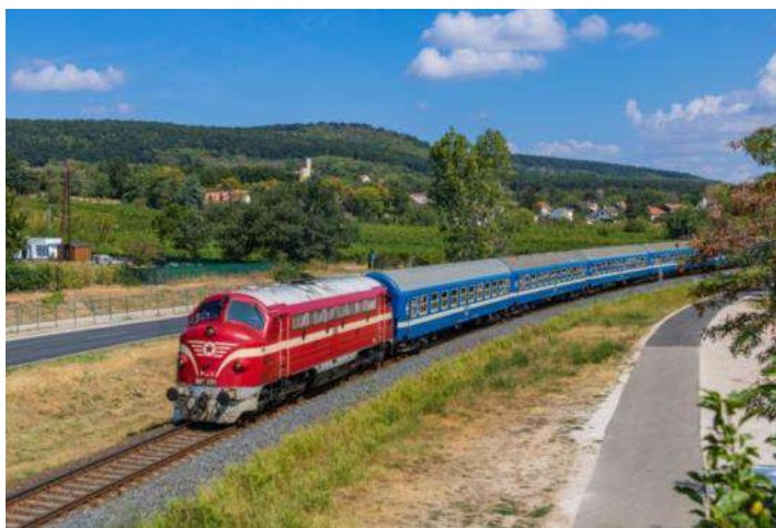
Nohab prenas pasaĝertrajnon apud la Balatono

En la lastaj jaroj individuaj iniciantoj prenis sub protekton de la Nohab-aferon, kaj kelkajn lokomotivojn oni riparitis, kelkajn ricevis protekton por la Trafika Muzeo. Nuntempe MÁV jam ne havas Nohabojn, sed – ĉefe ĉe la Balatono – kelkaj funkcikapablaj Nohaboj trafikis kiel nostalgia lokomotivo.