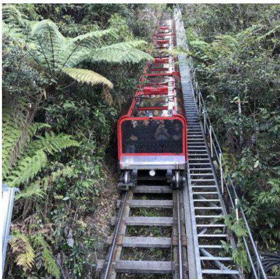
La timiga Scenic Railway