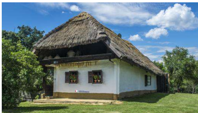
„Őrségi” Popolaj Monumentoj

konsistas el ok partoj, inter tiuj la plej bela estas la „Pityerszer”. La subĉiela muzeo gardas la malnovajn vivoformojn, kaj ankaŭ la domojn kiuj gardas la karakterizajn trajtojn. Sur la montetoj troveblas kelkaj domoj, kiuj estas malstrikta komunaj formoj de la kolonioj. La ĉi tie vivantaj homoj elformis dum jarcentoj la mozaikajn bildojn de la pejzaĝo. La tradicia konstrumaterialo estis eĉ estas la ligno. La plej praforma domtipo de la teritorio estis la fumoplena domo. Apud la domoj troveblas la t.n. „toka”, kion oni uzis por la kolekto de trinkakvo. En la limo de „Szalafő” kaj „Pityerszer” videblas unu el la plej romantikaj skanseno de Hungario. La karakterizaj domoj ekstere kaj interne redonas fidele la iaman vilaĝan realaĵon.