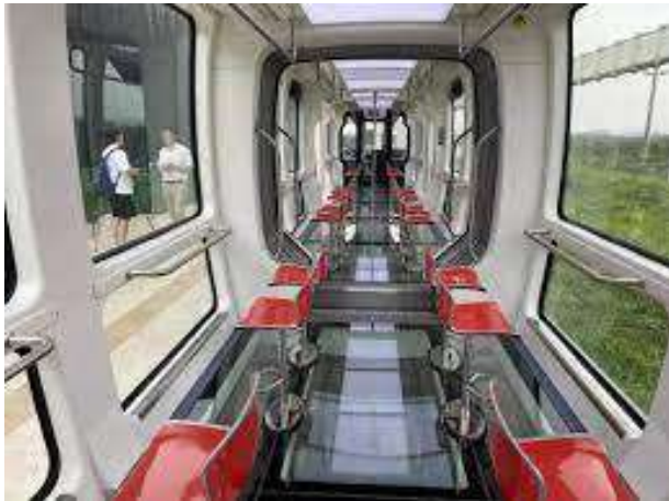
La Hanging Train

11,5 km-ojn longan fervojan linion. La malpezajn vagonojn ĉinoj konstruis el karbonfilamento kaj kompozita ŝaumo-materialo.