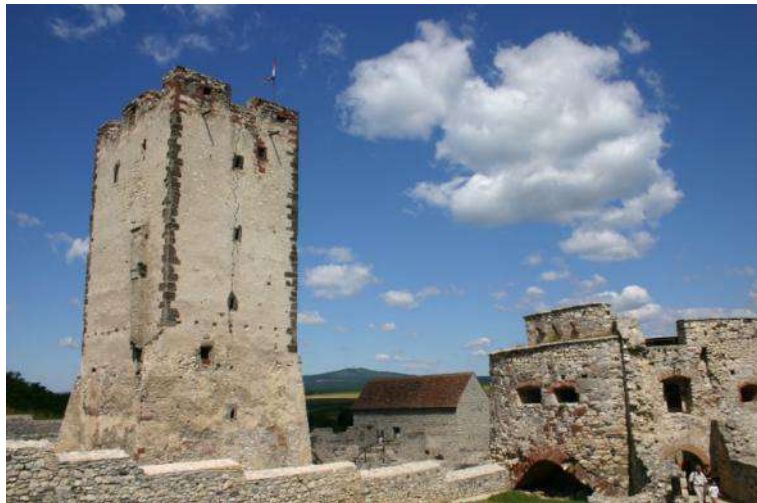
La fortikaĵo Nagyvázsony

La tria fortikaĵo estas Nagyvázsony , kiu estas „la fortikaĵo de la heroo Kinizsi”. Ĝi troveblas sur la dekliveto de la Altlando de Balatono. La fortikaĵo konstruiĝis apud la rivereto. Ĝi ricevis sian bonfamon de la „Muelŝtona Bravulo” Kinizsi Pál, kiu ricevis