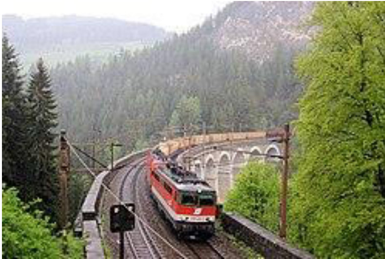
ÖBB- trajno sur la viadukto

La 1-an de oktobro 2023 la Aŭstraj Federaciaj Fervojoj festis sian 100-an datrevenon.