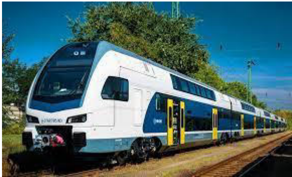
"Kiss" elektra motorvagonaro

La Aŭstraj Ŝtatformoj (ÖBB) mendis 35 etaĝajn „KISS” elektrajn motorvagonarojn de la firmao „Stadler” laŭ la antaŭ ligita kadra kontrakto. La sumo de tiu kadra kontrakto estas tri miliardojn da Eŭro. La totala valoro de la nun aĉetitaj elektraj motorvagonoj superas la 600 milionojn da Eŭroj, kaj ekde 2026 oni en trafikigos ilin periode. La menditaj motorvagonoj konsistas el 14 pecoj long-distancaj vagonaroj, kiuj havas aparte po ses vagonojn, kaj 21 pecojn por la regionaj trafikoj, kiuj havas aparte po kvar vagonojn. La kvarvagonaj motortrajnoj havas 380 sidlokojn, kaj la sesvagonaj trajnoj havas 480 sidlokojn, La maksimuma rapido estas 200 km/h. La trajnoj estas instalitaj kun porkliensaj servoj. ÖBB anoncis, ke la fervoja entrepreno donas avantaĝon al la longdistanca trajntrafiko, pro tio nuntempe ÖBB plilarĝigas la veturilaron kun modernaj kaj etaĝaj Railet-trajnoj.