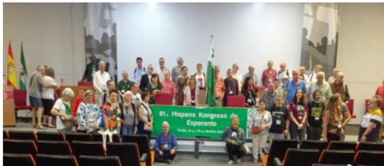
Partoprenantoj de la kongreso