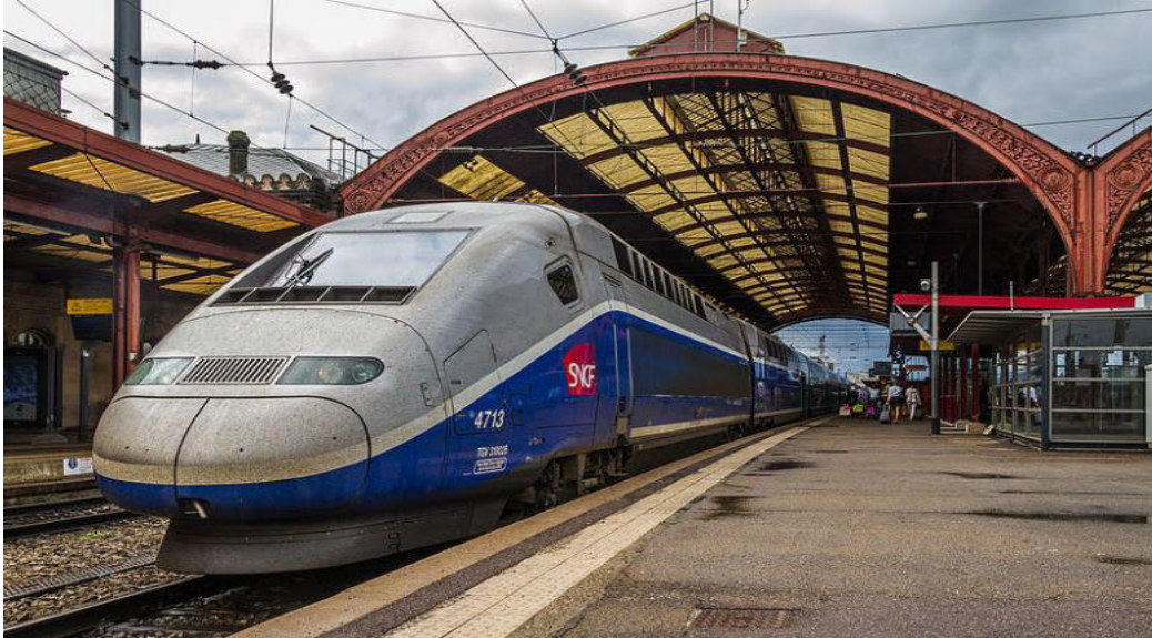
La stacidomo de Strasburgo Tie okazos la 76-a IFEF-Kongreso en 2024