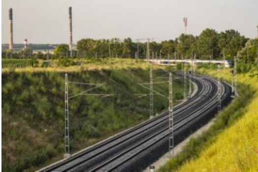
Dutraka linio en Slovenio

La Eŭropa Investa Banko konsentis 200 milionojn da Eŭroj prunton al la konstruo de la dua fervojlinio inter Divača – Koper. Tiu sumo estas 21%-oj de la totala sumo, kio estas 1,1 miliardoj de la projekto. Kun la entreprenistoj jam efektiviĝis la efektiveblaj kontraktoj, kaj la realigeblaj laboroj jam komenciĝis. El la entutaj 37 km-j longaj tuneloj jam 24 km-j da tuneloj estas elterigitaj. Oni boras po 350 metrojn da tuneloj semajne, kaj laŭ la kontraktoj la laboroj finiĝos ĝis la fino de jaro 2025. En la kadro de la