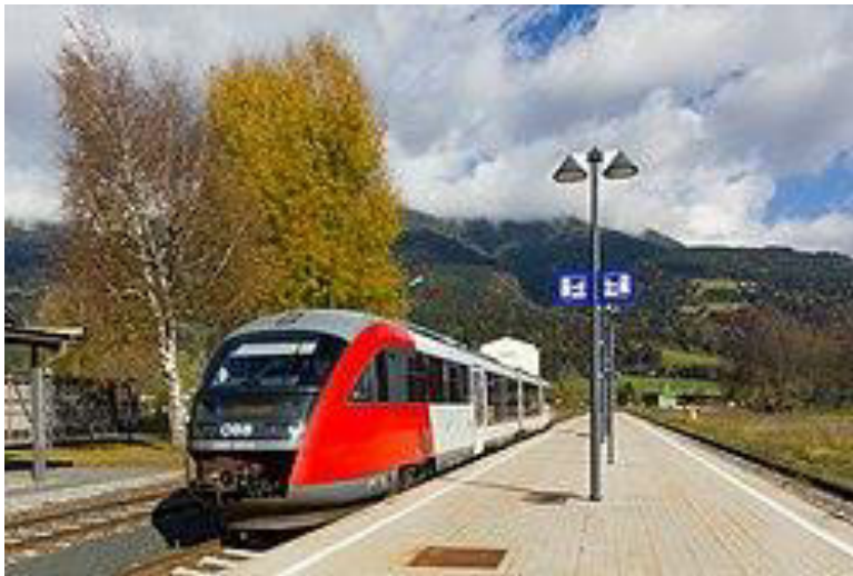
ÖBB-trajno en la stacio

La nova organizo: 1995-2010: Aŭstrio aliĝis al la Eŭropa Unio en 1995. Tiu aliĝo necesigis disigi la firmaon ÖBB. En la sama tempo la S-Bahn-reto estis vastigita en la kadro de laŭleĝo. Laŭ tio la fervojo bezonis apartigi infrastrukturon kaj vendi areojn kun propra firmaostrukturo kaj konto. La kostefikeco de la pasaĝertrafiko estis optimumigita,