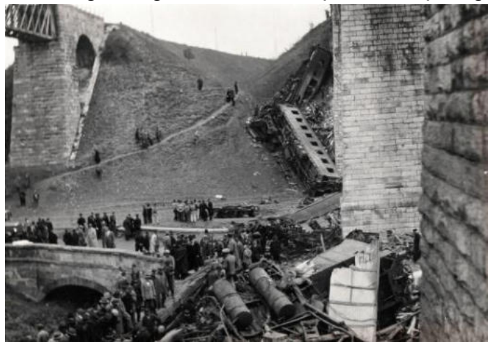
Post la eksplodigo

En 2002 la viaduktoj ricevis lokan artobjektan protektatecon, kie memortabulo memorigas pri la atenco.