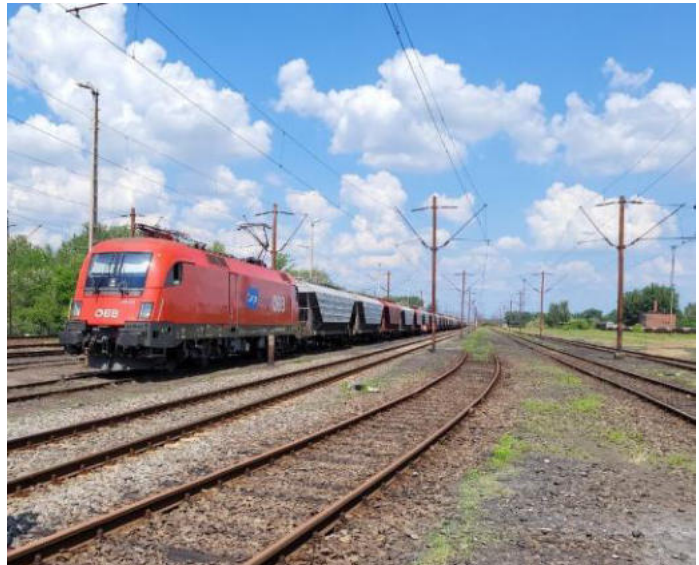
ÖBB vartrajno sur la relo

Alvenis la periodo por komenci la reconstruon de la entrepreno, kaj restarigi centran administradon. Post la kapitulacio de la germana ŝtato en majo 1945, Aŭstrio estis reestigita lando fare de la plej gravaj aliancaj potencoj ene de la 1937-a landlimoj kaj estis dividita al kvar okupzonoj. La perspektivo de la fervojo komence estis rapida kreado de la nova organizaformo sub la nomo „Aŭstraj Ŝtataj Fervojoj”. Devis tuj komenci financan, komercan kaj teknikan operaciojn. Oni klopodis restarigi –