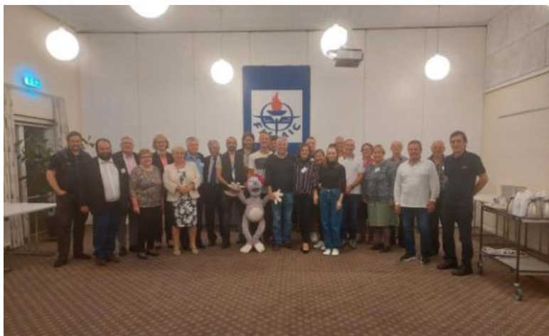
Partoprenantoj de la asembleo

Danio estas konstitucia monarkio , unu el la plej malnovaj monarkioj de la mondo, kaj estas parto de la Eŭropa Unio. Gronlando kaj la Ferooj estas la kronaj teritorioj de Danio, unu la alia kun federacia reĝo. La ŝtato estas organizita kiel parlamenta demokratio. La registaro kaj nacia parlamento kunsidas en Kopenhago, la ĉefurbo de la nacio, plej granda urbo kaj ĉefa komerca centro. Danio ekzercas hegemonian influon en la Dana Sfero, transdonante potencojn por pritrakti internajn aferojn. Danio iĝis membro de la Eŭropa Ekonomia Komunumo (nuna Eŭropa Unio) en 1973, konservante kelkajn