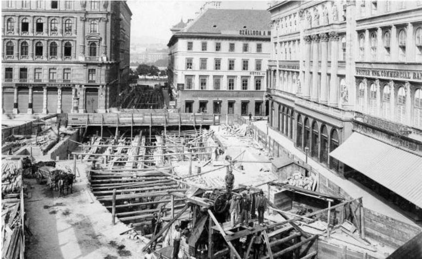
konstruado de la subtera fervojo en placo Gizella – nun placo Vörösmarty

Dum ĝia mallonga vivo – ne pli ol 6 monatoj – du foje okazis amasakcidentoj kun mortiga fuminhalado, kaj sufokiĝo de multaj dekduonoj da homoj. Sekve tion la Londona