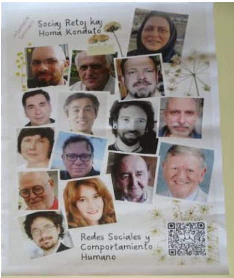
Prelegantoj en la Seminario