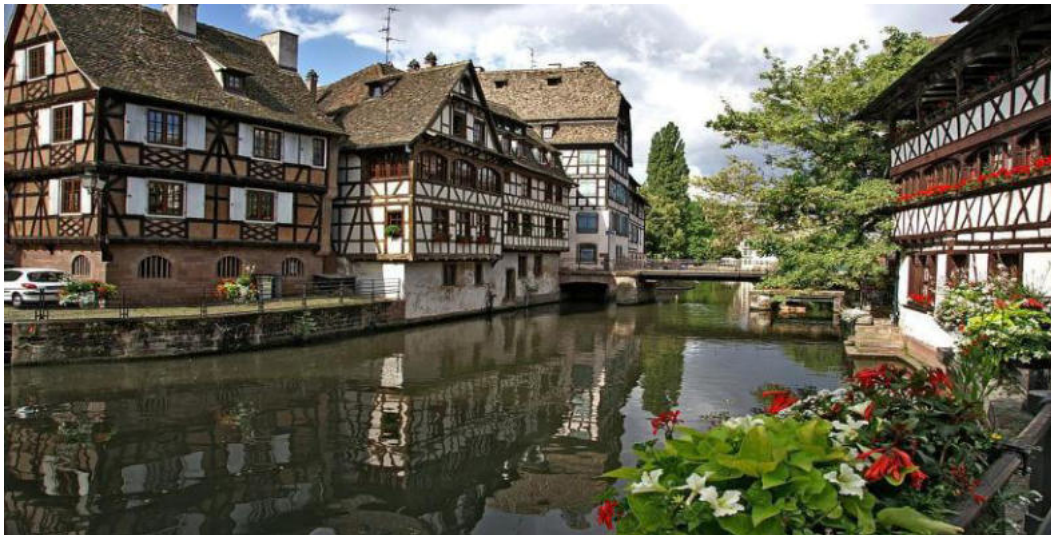
Belega urboparto de Strasburgo