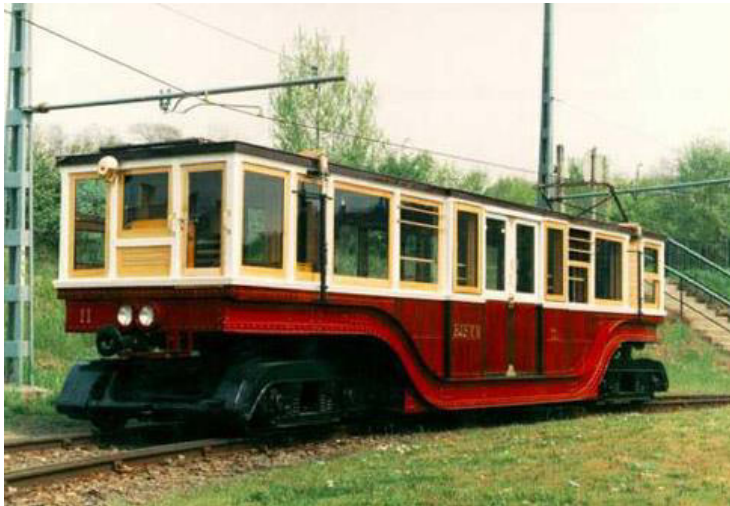
La nostalgia veturilo de la subtera fervojo

Dum ilia vivo la vagonojn oni ankaŭ plurfoje rekonstruis plej grave en 1930, tiam oni larĝigis la pordojn duklapaj. En 1960 okazis la ŝanĝo de la tutaj turntraboj kaj radaksoj