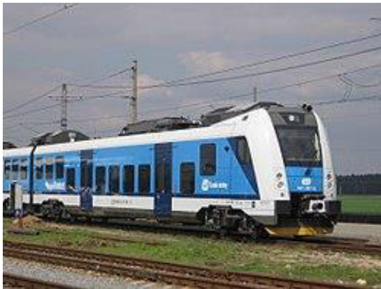
Fervoja trajno de firmao Ŝkoda

La Trenitalia fervoja entrepreno mendis 370 fervojajn vagonojn de la firmao Ŝkoda. Tiu firmao kreis komunan konsorcion kun la itala Titagarh Firema entrepreno. Per ĉi tiu konsorcio estas certigebla la efika laborprodukto, kaj la bonkvalita veturilfabrikado. La plena aĉetprezo estas 732 milionojn da Eŭroj. Tiu aĉetado estas la plej grandsignifa prizorgo de la firmao Ŝkoda. En la unua etapo la Trenitalia aĉetis 70 vagonojn. Helpe de la efektivigo de la aĉetado sur la fervojlinio Milano – Palermo trafikos nur nova veturilaro. La 70 vagonoj konsistas el 44 komfortaj, 22 luksaj kaj 4 ekonomiaj litvagonoj. La luksaj litvagonoj estas ekipitaj komfortaj kaj grandmezuraj dormejoj, el inter ili troveblas ses unulitaj kaj du dulitaj. Ĉiuj dormejoj havas propran lavopelvon, duŝejon, klimatizilon kaj aŭdvidan rimedon. Ĉiuj litvagonoj havas malgrandan kuirejon kun elektraj instalaĵoj. La komfortaj litvagonoj havas sep kupejon, kaj ĉiuj kupejoj havas kvar litojn kaj propran lavopelvon. En la litvagonoj troveblas pli granda spaco por la movhandikapuloj kaj la akompanantoj. La ekonomiaj vagonoj havas vastajn pasaĝerajn kupeojn, kiuj estas apartigitaj kun spacodividilaj vandoj. La larĝa, meza koridoro certigas komfortan vojaĝon por la pasaĝeroj.