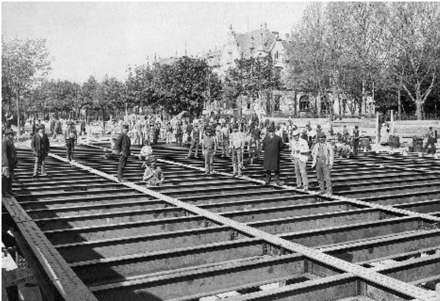
onstruado de la subtera fervojo ĉe la strato Aréna – nun placo de Hősök

Teknika-historia intesaĵo estas unu el la konserviĝitaj projektoj de motorvagono, sur kiu estis projektita la elektra konduko - simile al la nuna metroo - per trirela sistemo. La teknikan desegnaĵon faras precipe interesa, ke laŭ la modifita koncepto oni desegnis