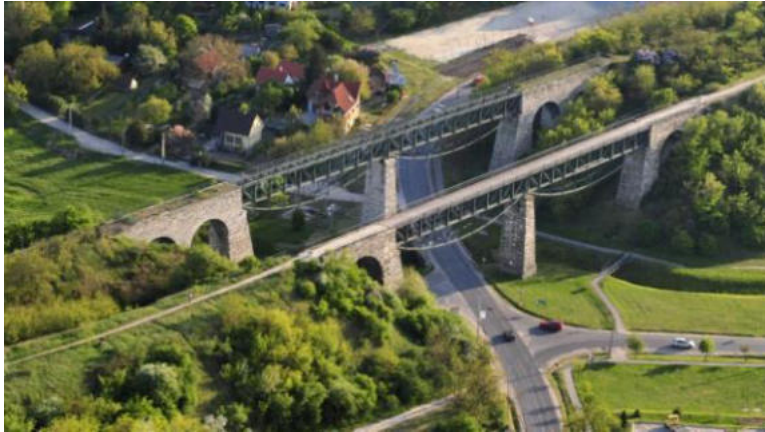
La du viaduktoj

viaduktoj traarkas super la rivereto „Füzes”, kaj ili kuŝas sur la naturŝtonaj murapogiloj kaj sur unu meza piliero. La viaduktoj estas ŝtalframaj muntaĵoj.