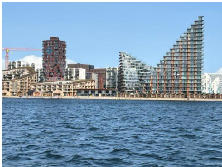
La nova urboparto de Aarhus

La urbo Aarhus estas grava urbo por la fervojistaj esperantistoj, ĉar la unua, deka kaj dudekkvina jubileaj IFEF-kongresoj okazis en ĉi tiu urbo. Eĉ la kvindeka IFEF-kongreso ankaŭ okazis en Danio, sed pro la altaj hotelprezoj en Aarhus ĝi okazis en urbo Aalborg.