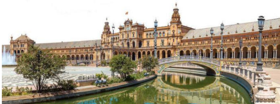
La ĉefplaco, Plaza de Espana

Okazis en la tre bela andaluzia urbo Sevilo, nomata perlo de Andaluzio. Post Madrido, Barcelono kaj Valencio ĝi estas la kvara plej granda urbo en la lando. Trafluas ĝin la rivero Guadalquivir. Sevilo famas pro flamenko-danco, taŭro-bataloj kaj aliaj tradiciaj festoj. La katedralo de Sevilo estas la tria plej granda en Eŭropo. Imponas ankaŭ la reĝpalaco Alcázar , unu el la plej antikvaj en Eŭropo kaj la plej bela en Hispanio. La majesta katedralo