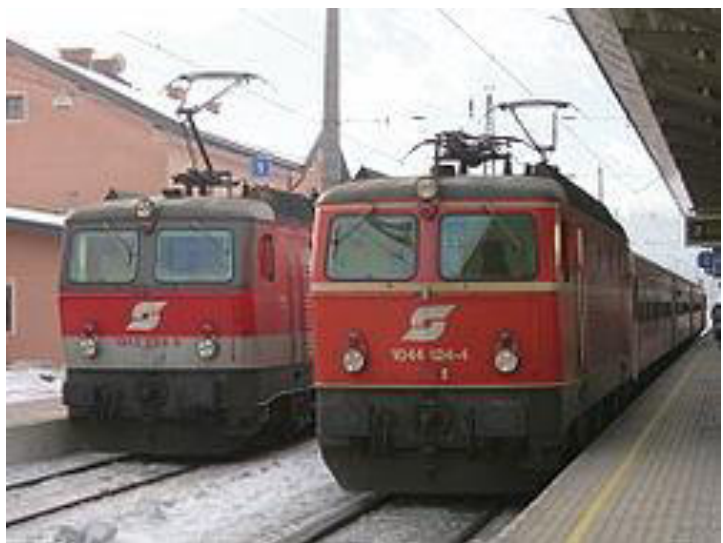
Elektraj lokomotivoj de ÖBB

Fondiĝo kaj fruaj jaroj 1923-1938: Ĝi estis malfacila komenco por ÖBB pro la tro grandaj perdoj de la materiaj rimedoj, tro malmulte da kapitalo, malmoderna trakveturilstoko, malagrabra socia kaj politika medio. Post kiam ÖBB estis refondita, la firmao estis sub alta ekonomia premo pro nesufiĉaj financaj resursoj. Ĝuste de la komenco la registaro ordonis reduktion de dungitaro de 25%-j dum kvin jaroj. Fine de ĉi tiu malpliigo oni devis atingi aktivan laborforton pere pr. 90.000 dungitoj. La celo estis ebligi pli