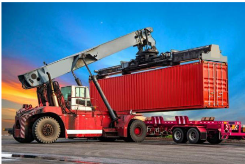
Nova intermodala fervoja terminalo konstruiĝis en urbo Szeged

La terminalo konstruiĝis el ducentmilionojn da hungaraj forintoj. Tiu terminalo kun-ligas