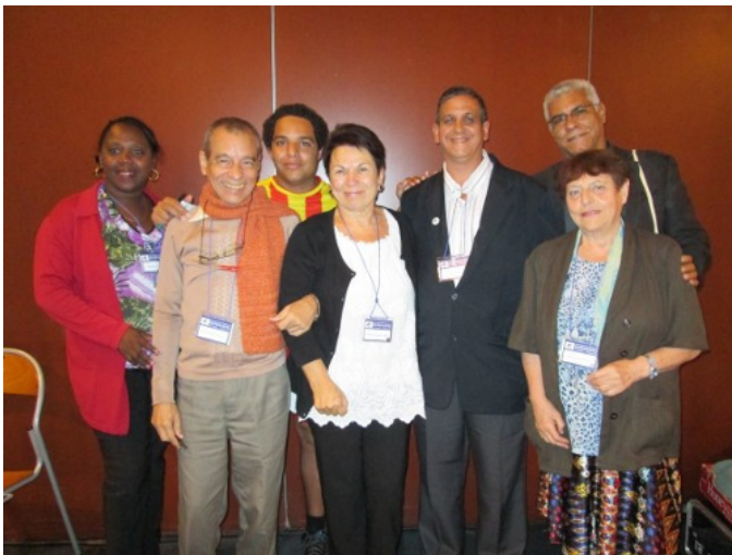
Post la kunsido kun la kubaj samideanoj

Pozitivaj estis ankaŭ la diskutoj kun kelkaj membroj de la Espéranto France Est Federacio , kiu invitis la IFEF kongreson en 2017 en Colmar, Alsaco (FR) . Ni pridiskutis la unuajn paŝojn, la necesajn programerojn kaj kondiĉojn por organizi sukcesplenan aranĝon. Al tiuj kontaktoj aldoniĝis tri aliaj programeroj en kiuj niaj fervojistaj kolegoj el Francio ludis gravan rolon.