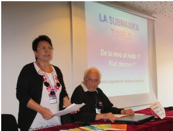
Dum la IFEF-kontaktkunveno

La Fervojfaka vizito en la trafika regadcentro de stacio Lille-France kunigis 35 kongresanojn kiuj dum unu horo ricevis klarigojn pri tiu centro kie tri deĵorantoj 365 tagoj jare, tagnokte kontrolas kaj regas la trajntrafikon sur 300 km de grandrapidaj linioj inter Parizo kaj norda