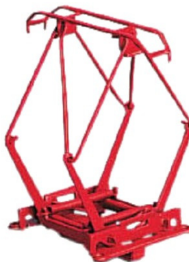
tutframa pantografo (TeKu 150, paĝo 4)