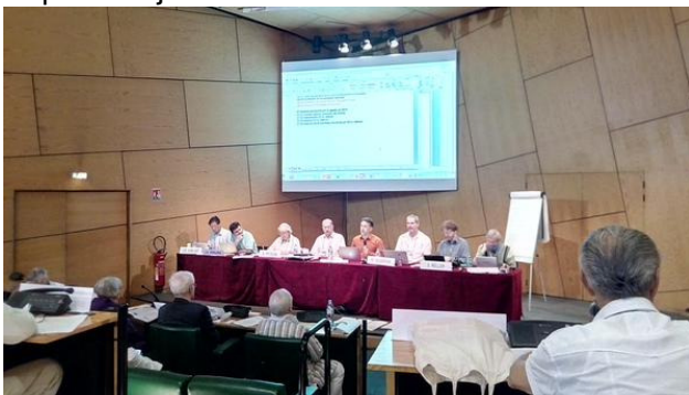
Komitatkunsido dum la centa UK

I - Komitata Forumo pri Konsciigo (lundo, 27.07) traktis la temojn pri informado kiel prioritata evoluiga kampo kaj ankaŭ pri la eksteraj rilatoj, esploro kaj dokumentado.