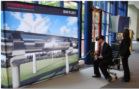
Japana foiro-gasto spertas virtualan vojaĝon tra la Hyperloop-tubo.

la kablojn kaj je la fino de la vojaĝo rekonduki lin al lia seĝo. Tiu vizio ankoraŭ bezonas tempon.