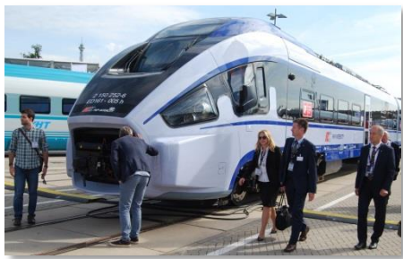
Pola motorvagono ED161 „Dart” kun malfermita kuplila kovrilo

Antaŭ unu el la ses enirejoj mi pripensas la vizitan sinsekvon. La vetera prognozo rekomendas unue inspekti la eksterajn areojn. Do mi senhalte pasas tra la haloj kaj staras tuj inter brilantaj lokomotivoj kun tegitaj bufroj kaj poluritaj cisternovagonoj puraj kiel poste certe neniam plu en ilia vivo. La nova ICE 4, prezentita 14.09.2016 - kelkajn tagojn antaŭe - en la berlina ĉefstacio, mankas. Supozeble ĝi jam osciladas inter Hamburgo kaj Munkeno por pruvi sian solidecon. Ĝi tion faros dum pli ol unu jaro. Spertoj pri nefermemaj pordoj, ne-funkciantaj necesaj sistemoj kaj strikanta klimatiza aparataro en novaj trajnoj laŭeble ne ripetigu. PESA "Link", dizela motorvagono de regiona trafikentrepreno Niederbarnimer Eisenbahn altiras mi-an atenton (vd. titolo paĝo). En la karoserion integritaj bufroj unuavide ŝajnas nure maskla dezajna ornamo. Sed la eksterordinara fronta formo estas konstrua sekvo de speciala kolizia sekureco. La liveranto argumentas per plenumo de la kolizia normo EN 15227 en klaso C-1.