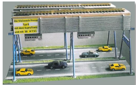
Maketo de la Multutila Traceo 6

super kvarŝpura aŭtoŝoseo. Flanke troviĝas altkurentaj kabloj, sube pendantaj vagonoj, ene kaj supre fervojaj trakoj. Pri la afiŝo titolita VzT6 "Vielzwecktrasse 6" ("Multutila Traceo 6") kun ŝpareblaj miliardoj, senbrua vojaĝado, ekskluziva uzo de sunenergio kaj facila riparo mi cerbumas ĝis alparolas min juna prizorganto kaj klarigas, ke temas pri faskigo de transportsistemoj en alto lasanta la naturon netuŝita. Sekvas klarigo pri la enorma kostoŝparo, kiun mi ne vere komprenas kaj kiu instigas min prefere ne demandi pri al- kaj forkondukaj konceptoj kaj aliaj problemoj unuavide ne regulitaj. Mi kun danko kunprenas prospekton kaj fuĝas en direkton elirejo.