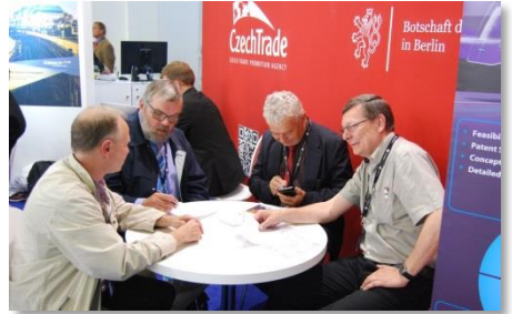
Rondo de esperantistoj konferencas ĉe la stando de la ĉeĥa fervoja industrio.