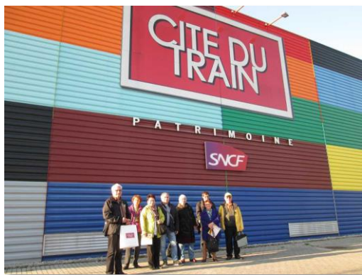
Skolteca vizito en la fervoja muzeo

Pli ĝenerale la IFEF-respondeculoj interesiĝis pri la financaj aferoj kaj la diversaj agadoj de IFEF (komisionoj faka, redaktora kaj statutrevizia) kaj diskutis la rezultojn de la laborgrupoj pri rilatoj internaj kaj eksteraj de IFEF, ĝia historio kaj arkivado.