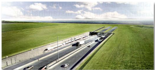
Rigardo sur la tunel-aperturon sur Lolando

Anticipebla motivo unuflanke estas atendataj perdoj en la turisma ekonomio pro la konstrulaboroj kaj la influo de kreskanta vartrajna trafiko.