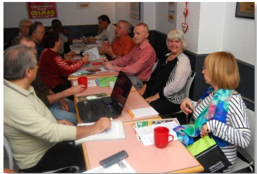
Koncentrite diskutantaj – LKK kaj estraro

La hotelo Balladins-Primo ofertis sin gastigi la kongresanojn kaj tial estis la elektita loko de la preparkunveno. Situanta rande de la centra kvartalo de la urbo ĝi prezentas allogajn kondiĉojn kun noktoprezo ege favora. Ekipita per lifto tiu hotelo ne ofertas lukson sed ĉiajn bezonatajn utilaĵojn.