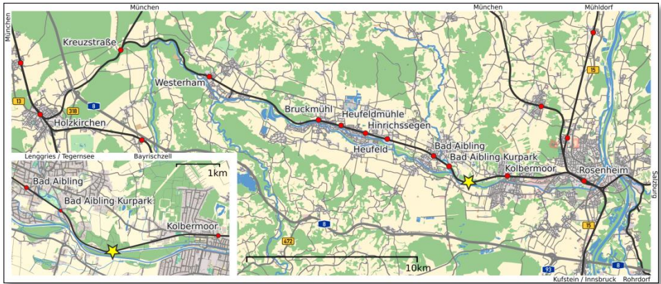
La fervoja linio Holzkirchen-Rosenheim (Mapo: Vuxi, WikiMedia, OpenStreetMap)