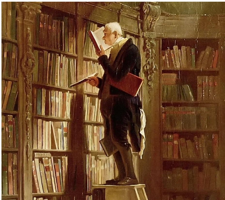
La libromaniulo – Carl Spitzweg 1850