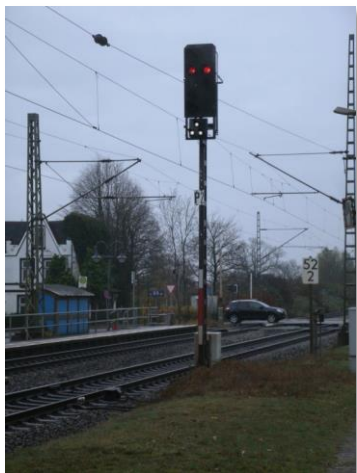
Substitua signalo 3 blankaj lumoj

mo en la respektiva signalilsimbolo sur la traskema pupitro. La pupitro estas la centra kontrolinstrumento de la regejo, kiu per lumoj bildigas la situacion sur la konektita trakreto. Okupitajn traksekciojn simbolas ruĝaj strioj, liberaj en stacioj estas blankaj.