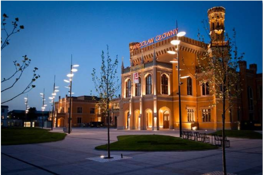
La novgotika ĉefa stacidomo Wrocław -Główny memorigas pri la Malnova Palaco de Florenco