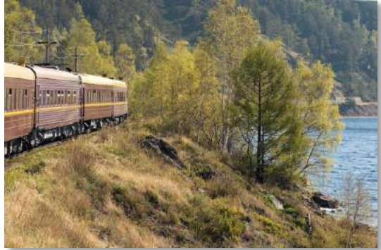
Transsiberia linio apud la Bajkal-lago

Kelkiu leganto jam konas la linion kaj kolektis spertojn pri fervojaj vojaĝoj en Rusio. La Transsiberia Fervojo ne estas altrapida konekto. Oni veturas pli trankvile, venkas la 9.288 kilometrojn ĝis Vladivostok tamen en sep tagoj. Dume restas paŭzoj de 20 ĝis 30 minutoj, dum kiuj la vojaĝantoj povas eliri kaj replenigi siajn provizojn. Ili tamen ne maltrafu la pluveturon: La rusa fervojo estas konata pro sia akurateco. Ekzistas ankaŭ restoracivagono en kiu la menuoj ankoraŭ estas freŝe preparataj. La kvarlitaj kupeoj estas komfortaj kaj vastaj. Lavĉambroj konformas al eŭropa kutimo (eĉ eblas sin duŝi survoje) kaj la prizorgo – po vagono kunvojaĝas du akompanantoj – estas atenta kaj helpema. Teo, keksoj aŭ eĉ nur varmega akvo estas riceveblaj je ĉiu taga kaj nokta horo. Rusa apartaĵo: Por la trajntrafiko validas tutlande la moskva tempo. La diferenco al la loka tempo sole sur tiu linio kreskas ĝis 7 horoj.