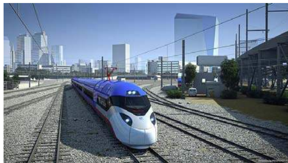
Avelia Liberty (bildo: Alstom, komputile kreita)

Oni tre ĝojas pri la ebleco modernigi tiun linion, kiu estas tre grava – kiam post la atako en New