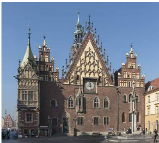
Ĝi allogas ĉiam pli da klientoj: la biciklo-turo de Hradec Králové

Ĉirkaŭ 3.600 hektarojn de la urbo kovras verdaj areoj, parkoj sole 24