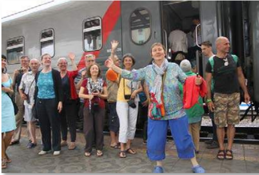
Sur la kajo de Krasnojarsk

liftoj sur la “Zibela Monto” kun elrigardo trans la lagon. La pluveturo per la fama trajno numero 2 (Moskvo-Vladivostok) daŭris tri tagojn kaj noktojn.