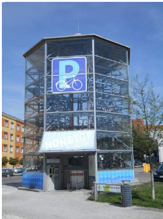
Ĝi allogas ĉiam pli da klientoj: la biciklo-turo de Hradec Králové

Trafikin farkto kaj polucio en la urbocentroj postulas alternativojn kaj konkretajn iniciatojn. La oferto de favora aŭ eĉ senkosta parksistemo proksima al stacioj tiel interligante fervojon kaj biciklon estas modela ekzemplo.