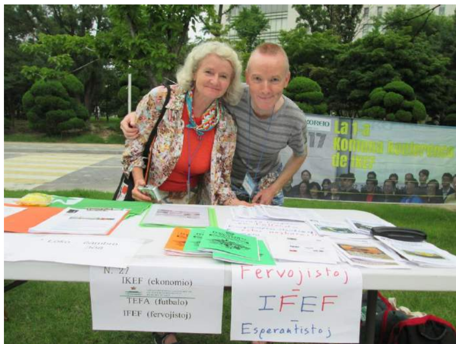
La tablotriono de IFEF – Liba kaj Laurent propagandas por IFEF kaj la IFK.