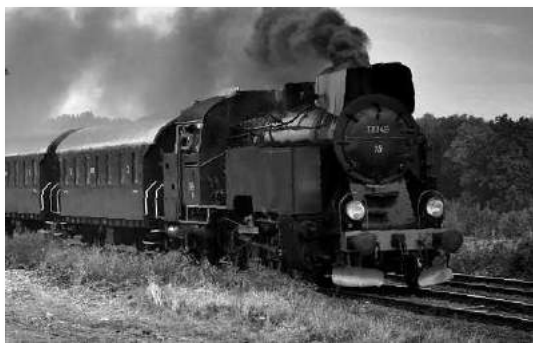
La semajnfina trajno el la fervoja muzeo