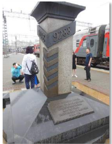
Monumento por la kilometro 9288