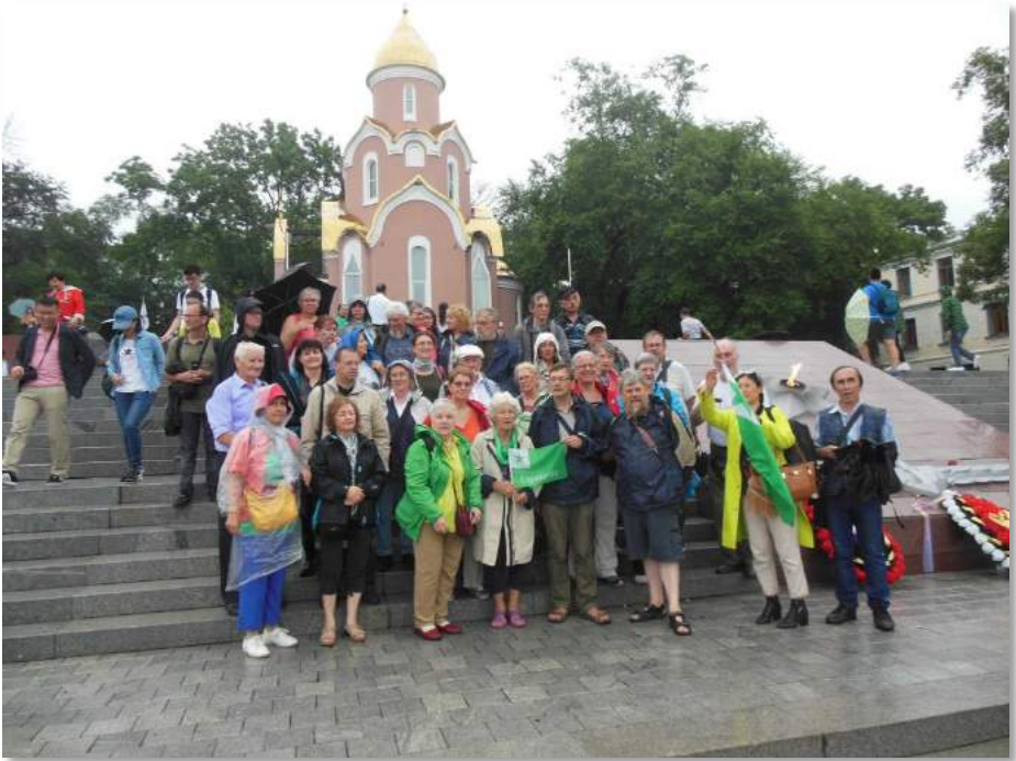
Plastoŝirmilo kaj mallonga pantalono estas taŭga vesto por sezontipa vetero. La karavano vizitas Vladivostok .