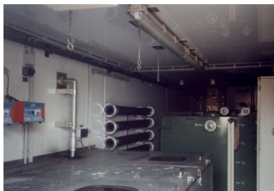
Provizujo en 12049 por fajroestingaj rimedoj