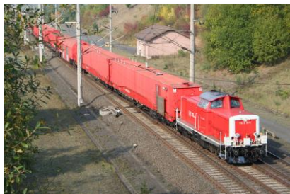
Trajnkompleto 12049 sur linio Hannover-Würzburg

PIV: kalkano (2) tekniko posta elstarajo de objekto.