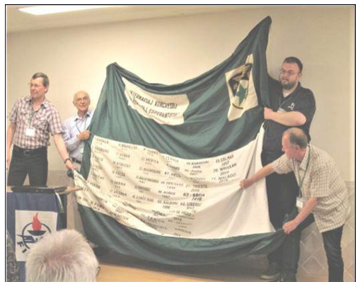
Trans-dono-preno de la IFEF flago: de Malaga al Frankfurt am Oder - Słubice.

Alla fine della settimana tutti gli esperantisti si sono salutati con "Ĝis revido la venontan jaron"! "Arrivederci al prossimo anno"! □ ViTo