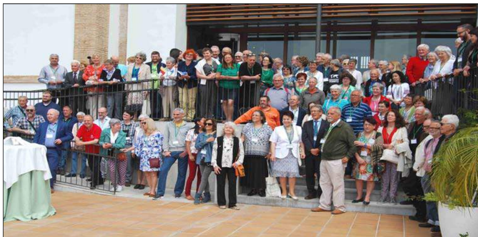
Foto de la partoprenantaro en Malago