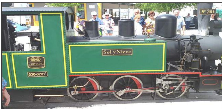
Vaporlokomotiveto al Zafarajo

tiuj de la hispana kaj de la andaluzia dimanĉe, tiu de IFEF marde.