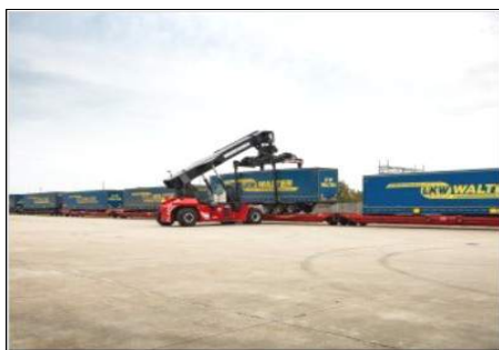
Movo de konteneroj en Cervignano.

Venonta celo estos kreskigi la frekven- con je 5 forveturoj semajne kaj evoluigi aliajn trajnojn. □ ViTo