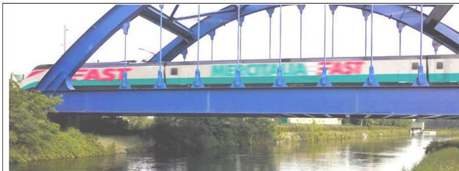
ETR.500 livreaĵo por la servo Mercitalia Fast.

Fakte, 500 milionoj da eŭroj jam estis investitaj el la sumo de 1,5 miliardoj da eŭroj antaŭviditaj fare de la 2017-2026 Komerca Plano, dum, por la unua fojo en la historio de la vara sektoro de la italaj fervojoj, monaj fluoj estis pozitive generitaj en 2017 por 40 milionoj da eŭroj. □ ViTo